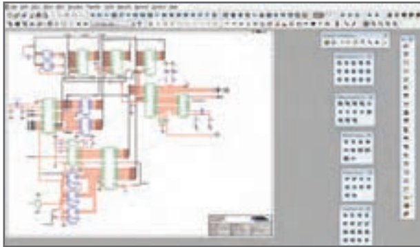
شکل ۶- نرم افزار مولتی سیم

نرم افزار مولتی سیم در حقیقت یک آزمایشگاه مجهز الکترونیک را به صورت مجازی و گرافیکی روی صفحه مانیتور کامپیوتر در اختیار کاربر قرار می دهد. در محیط این نرم افزار تمام قطعات اصلی الکترونیک در نوار ابزارهای مختلف تعریف شده است. برای ترسیم نقشه فنی (شماتیک - Schematic) مدار ابتدا قطعات لازم را به ترتیب انتخاب می کنید و آنها را به میز کار مجازی (Workbench) انتقال می دهید، سپس با تنظیم مشخصه های هر یک از قطعات و برقراری اتصال بین آنها با استفاده از موس، رسم مدار به صورت شماتیک کامل می شود. در مرحله بعد دستگاه های اندازه گیری مناسب را انتخاب و آنها را به نقاط لازم متصل می کنید. در مرحله آخر مدار راه اندازی شده و به تجزیه و تحلیل مدار می پردازید. دستگاه های اندازه گیری به صورت گرافیکی و شبیه سازی برخی از قطعات به صورت سه بعدی (3D) و دستگاه های پیشرفته واقعی مانند مولتی متر دیجیتالی، فانکشن ژنراتور و اسیلوسکوپ نیز در این نرم افزار وجود دارد که سبب جذاب تر شدن آن می شود. در (شکل ۶) محیط این نرم افزار را مشاهده می کنید. نرم افزار مولتی سیم تا حدودی توانایی تحلیل فیزیکی و ریاضی مدارهای الکترونیک و ترسیم مدارهای چاپی را نیز دارد.