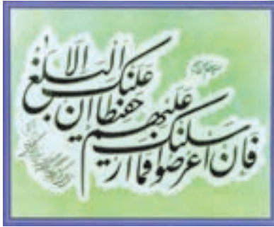
سوره شوری آیه ۴۸

پس از پیروزی انقلاب اسلامی، به دلیل درخواست‌های مکرر قرآن دوستان و قرآن پژوهان، رسانه‌های متنوع قرآنی در کشور ایجاد شده و رشد خوبی داشته است. برای آشنایی و استفاده شما دانش‌آموزان عزیز برخی از این رسانه‌ها معرفی می‌شود.