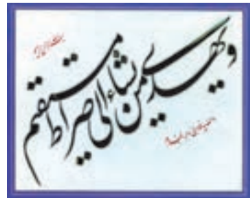
سوره یونس آیه ۲۵