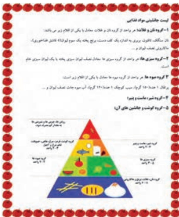
شکل ۶-۲- لیست جانشینی مواد غذایی

پس از مشاهده فیلم «نوشتن متن در رایانه» و «درج تصویر»، شکل ۶-۲ را در برنامه واژه‌پرداز (Word) ایجاد کنید.