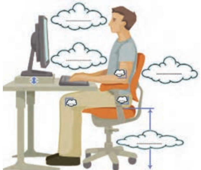
شکل ۵-۲- چگونه بنشیند درست هنگام کار با رایانه

در شکل ۵-۲ جاهای خالی را با عبارات مناسب پر کنید.