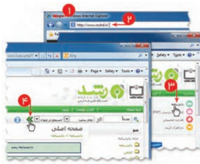
شکل ۷-۲- جست و جو مطلب در وبگاه شبکه رشد

برای درک اهمیت تغذیه در دوران نوجوانی می‌توانید مطالب مفیدی از وبگاه شبکه رشد جمع‌آوری کنید. برای انجام این کار فیلم «جست‌وجو در وبگاه رشد» را مشاهده کنید.