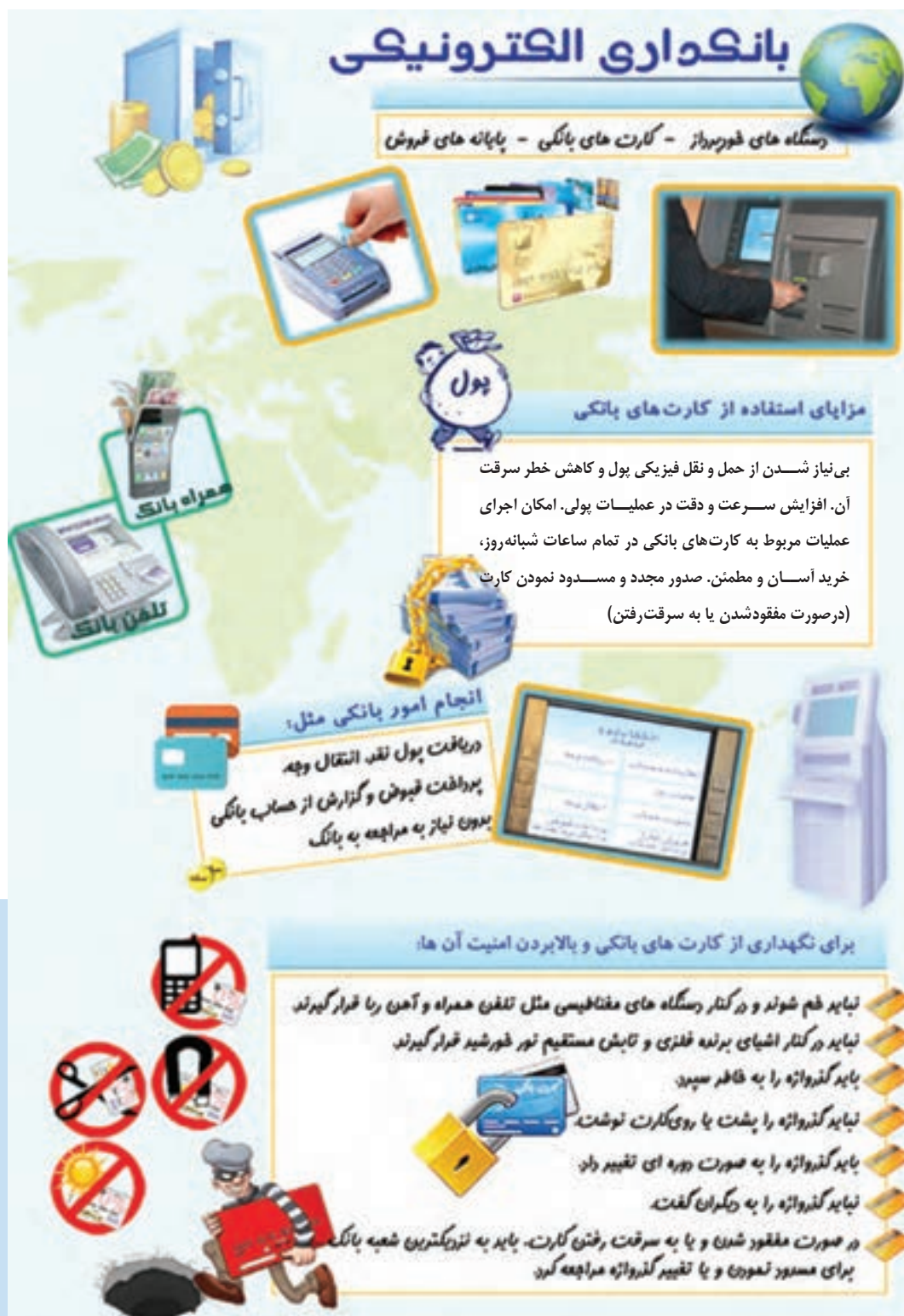
شکل ۱-۲- بانکداری الکترونیکی