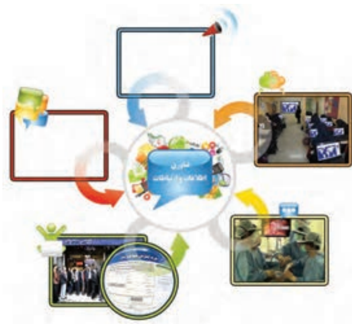
شکل ۲-۳- تأثیرات فناوری اطلاعات و ارتباطات