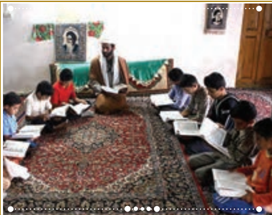
انس با قرآن کریم در استان فارس، شهرستان داراب

با راهنمایی آموزگار خود پس از آوردن قرآن کریم از دفتر مدرسه، آن را به صورت تصادفی باز کنید و از روی آن بخوانید.