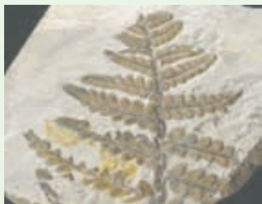
فسیل گیاه سرخس