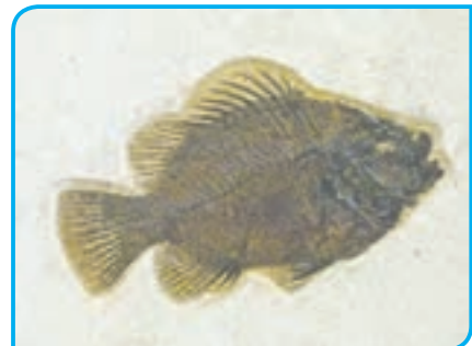
الف) فسیل ماهی