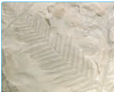
پ) فسیل گیاه

دانشمندان معتقدند که وقتی جاننداری می‌میرد، قسمت‌های نرم بدن آن با گذشت زمان از بین می‌رود اما قسمت‌های سخت، مانند استخوان، دندان و صدف، در بین گل و لای باقی می‌ماند. به آثار و بقایای گیاهان و جانوران که پس از سال‌ها به‌جا مانده است، فسیل می‌گویند. در شکل زیر، تصویر چند فسیل نشان داده شده است.