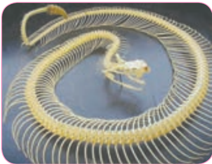
ستون مهره‌های مار

بدن کرم خاکی و بدن مار، چه شباهت‌ها و چه تفاوت‌هایی دارند؟ مار ستون مهره دارد و جانوری مهره‌دار است درحالی که کرم خاکی ستون مهره ندارد. به جانورانی که ستون مهره ندارند، جانوران بی‌مهره می‌گویند. مورچه، کفشدوزک، شته، عنکبوت و بسیاری از جانوران دیگر بی‌مهره‌اند.