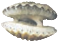
صدف دو کفه‌ای

جانوران بی مهره‌ی دیگری نیز وجود دارند که در آب و خشکی زندگی می‌کنند.