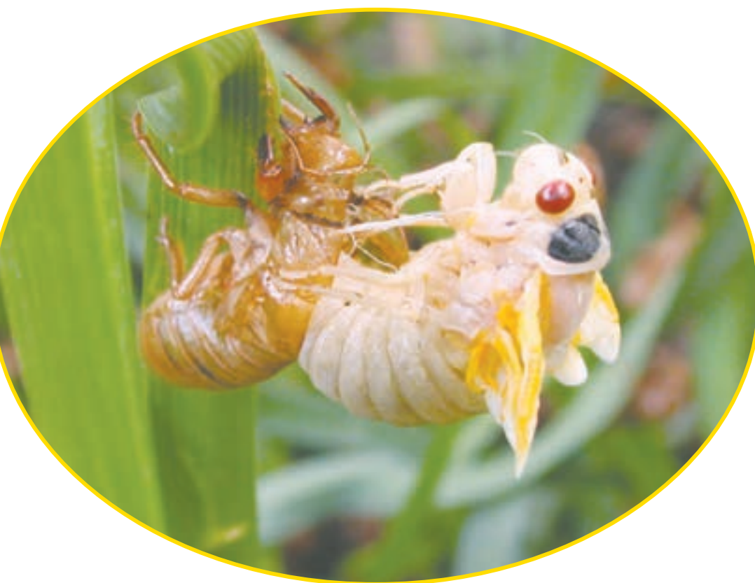
حشره در حال پوست‌اندازی

دانشمندان عنکبوتیان، حشرات، سخت‌پوستان و هزارپایان را در یک گروه بزرگ به نام بندپایان طبقه‌بندی می‌کنند. چرا این گروه‌ها را گروه بزرگ بندپایان می‌نامند؟ بدن بندپایان پوشش سختی دارد. آنها هنگام رشد کردن چند بار پوشش سخت خود را عوض می‌کنند؛ به این کار پوست‌اندازی می‌گویند.