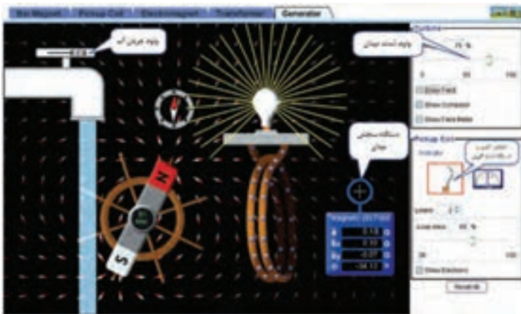
شکل ۱- نرم افزار phet

نرم افزار رایگان Phet نرم افزاری است که در آن آزمایش های علوم پایه از جمله مبانی برق به نحوی جالب و بر مبنای آخرین دستاوردهای محققان طراحی و شبیه سازی شده است و بر پایه نرم افزارهای فلش و جاوا برنامه نویسی و اجرا می شود. این نرم افزار به هنرجویان کمک می کند تا بتوانند مسائل علمی غیر قابل لمس را در محیطی پویا و با استفاده از گرافیک و کنترل های حسی با فشردن دگمه های نرم افزاری مشاهده نمایند. در این نرم افزار با تغییر مشخصه ها در آزمایش های مختلف می توان نتایج را از دیدگاه پژوهشی مستقیماً مطالعه کرد. هنرجویان با استفاده از این نرم افزار درک درست و تصویر ذهنی ماندگارتری از موضوع آموزشی مورد نظر را پیدا می کنند. نرم افزار Phet تعاملی است و با ارائه بیش از ۱۲۰ شبیه سازی، در زمینه های مختلف به درک علمی مفاهیم کمک می کند. این نرم افزار بخش فارسی نیز دارد. شکل ۱ نماد دسترسی به سایت نرم افزار Phet و تصویر شبیه سازی شده مولد را نشان می دهد.