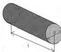
شکل ۵ - مشخصات چند نمونه مقاومت SMD