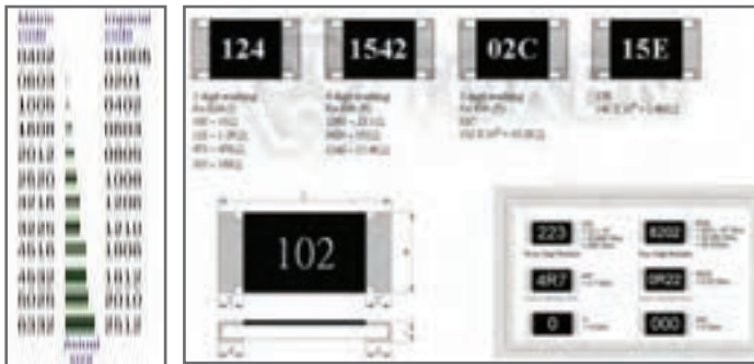
شکل ۷- نمونه دیگری از رمز «عدد-حرف»

نمونه های دیگری از رمز «عدد-حرف» و ابعاد در مقاومتهای SMD، (شکل ۷).