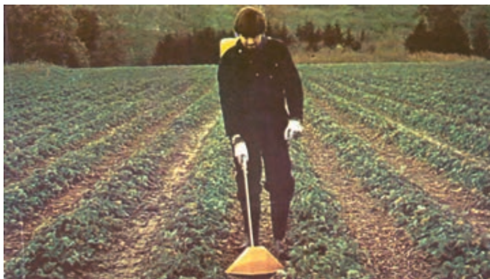
شکل ۵-۴ - کنترل علفهای هرز در کشتهای ردیفی و زراعتهای وجینی