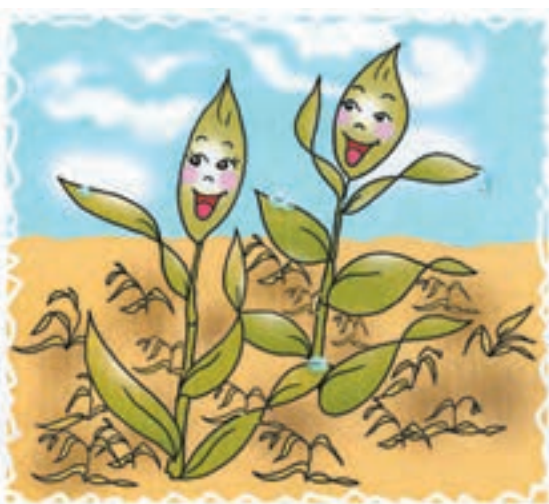
شکل ۵-۳ - بعضی از گیاهان خفه کننده علفهای هرز هستند.

ب - دسته دیگری از گیاهان با رشد سریع و غلبه بر علفهای هرز موجب کاهش رشد و توسعه آنها می‌شوند به این گونه گیاهان «خفه کننده علف هرز» می‌گویند مثل جو و گندم سیاه (شکل ۵-۳). ج - دسته‌ای از گیاهان به تمیزکننده علف هرز یا گیاهان وجینی معروف‌اند که به دلیل رشد کند این گیاهان، زارعین مجبور به مبارزه و دفع علفهای هرز (وجین) در این گونه زراعتها می‌باشند. به همین دلیل در این گروه از گیاهان علفهای هرز به مقدار زیادی از بین برده می‌شود (شکل ۵-۴).