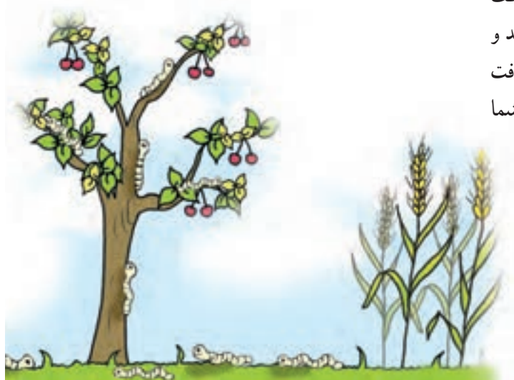
شکل ۳-۴- افزایش آفات و بیماریها

۳- افزایش آفات و بیماریها: کشت ممتد یک گیاه باعث تجمع آفات و بیماریهای بخصوصی باتوجه به شرایط مساعد و وجود میزبان مناسب در طول سالهای پیایی خواهد شد مثل آفت کرم ساقه خوار برنج یا بوته میری جالیز (حداقل دو مثال نیز شما ارائه نمایید) (شکل ۳-۴).