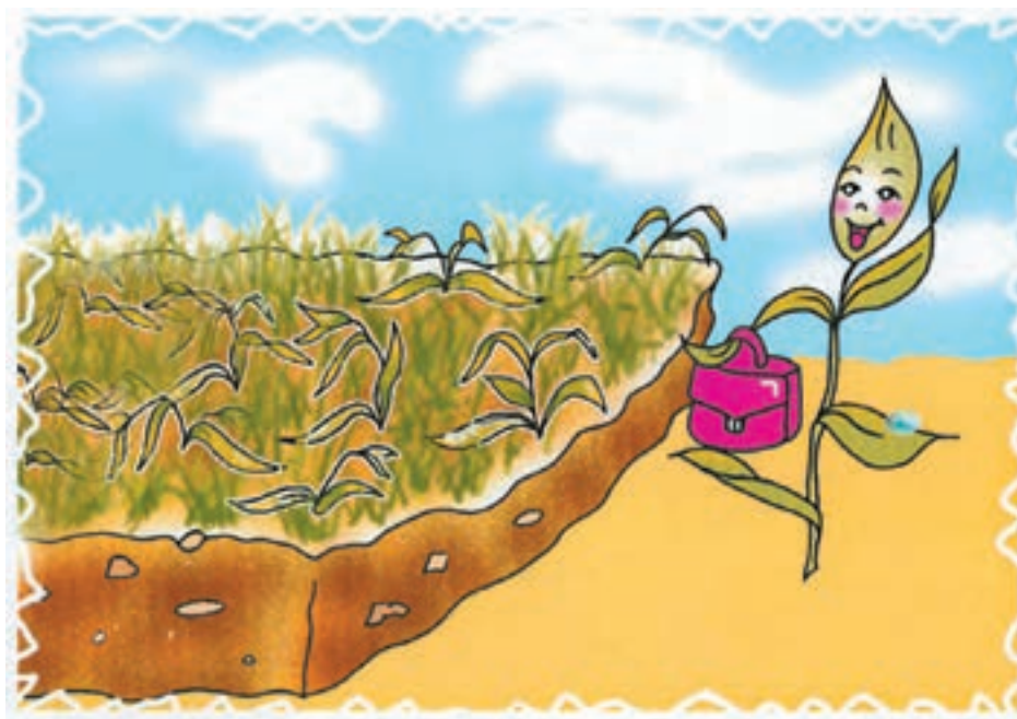
شکل ۲-۴- استقبال زمین از گیاه جدید

۱- خشکی و مسمومیت زمین: در اثر کشت ممتد یک گیاه حتی با استفاده از بهترین ترکیب کودی، در درازمدت، عملکرد به نحو مؤثرتری کاهش پیدا خواهد کرد که این امر، از خستگی و مسمومیت زمین ناشی می‌شود. باید توجه داشت افزایش ترشحات ریشه یک گیاه باعث ایجاد خستگی و مسمومیت زمین (الوپاتی) خواهد شد. این موضوع در بعضی از گیاهان مثل کتان شدت بیشتری دارد (شکل ۲-۴).