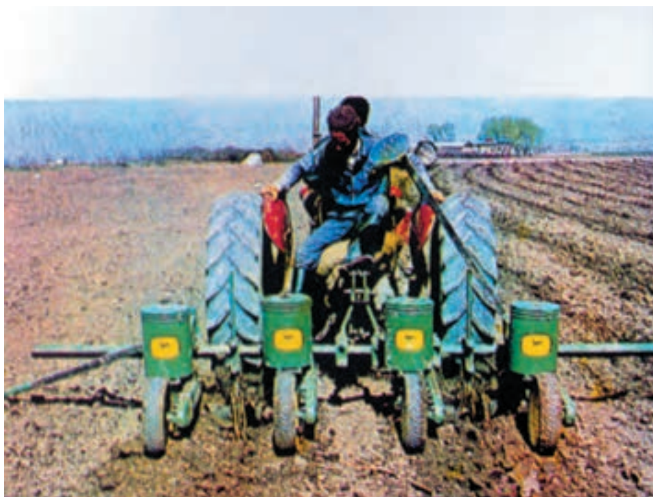
شکل ۵-۴ کاشت با استفاده از ردیفکار مکانیکی