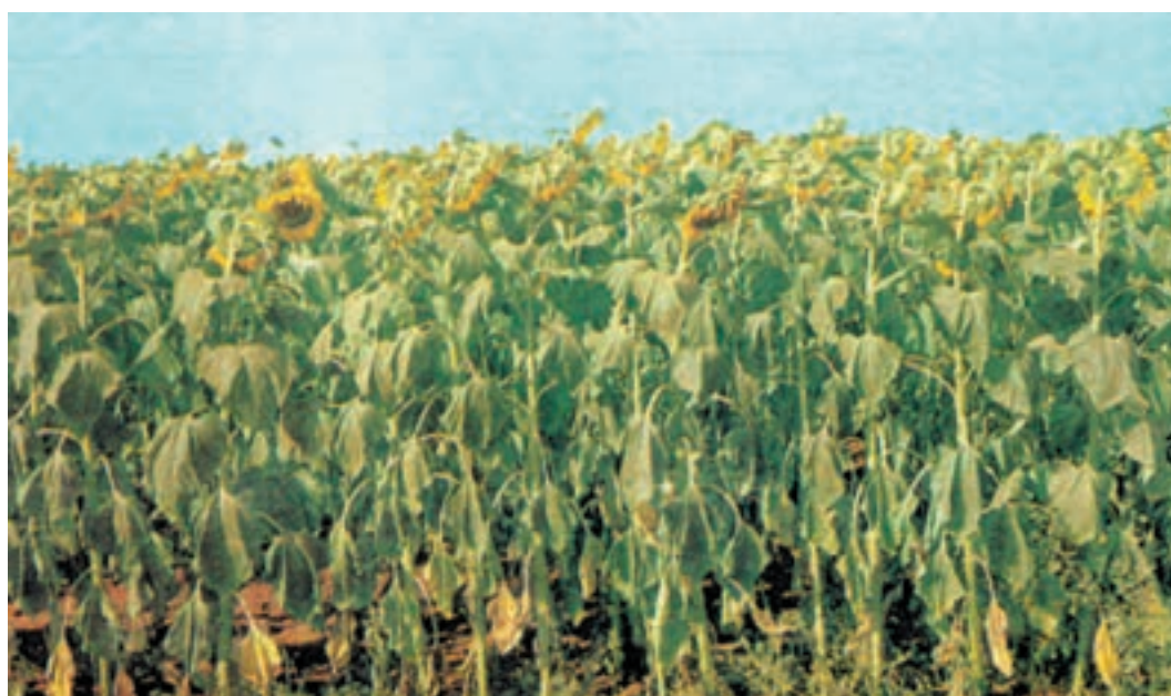
شکل ۴-۵ اثر تنش رطوبتی در آفتابگردان