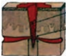
تشکیل لخته رگ‌خونی آسیب دیده انقباض رگ خونی

این که بدن شما می‌تواند به‌طور خودکار باعث کنترل خونریزی شود یا نه بستگی به مکان و شدت جراحات دارد. به‌طور کلی بدن از دو طریق سعی در کنترل خونریزی دارد.