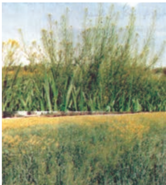
شکل ۱۴-۳ علف هرز خاکشیر (خاکشی) که با رشد سریع خود روی محصول سایه افکنی کرده است.

جذب آب و مواد غذایی، با سایه انداختن، رشد آنها را نیز کاهش می‌دهد. اگر رشد علف هرز زیاد باشد می‌تواند گیاه اصلی را بپوشاند و از رسیدن نور به آن جلوگیری نماید (شکل ۱۴-۳).