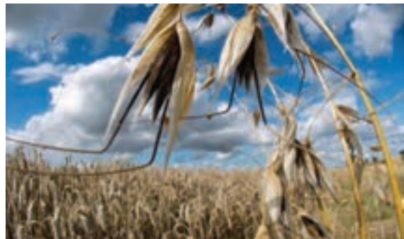
شکل ۳-۱- علف هرز یولاف وحشی (جو دو سر) در مزرعه گندم