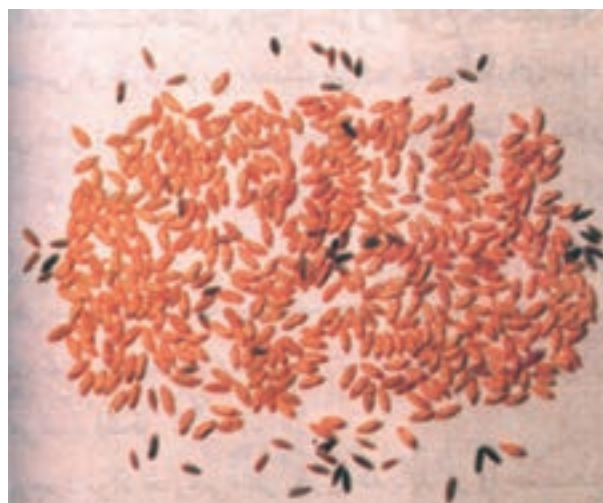
شکل ۱۸-۳: بذر چاودار در بین بذور گندم

۵- بذور مورد کشت : غالباً همراه بذور گیاهان، مقدار زیادی بذر علف های هرز دیده می شود که باعث آلودگی می گردد. در صورتی که تعداد بذور علف های هرز از حد استاندارد تجاوز کند اجازه کاشت داده نمی شود. در این حالت باید از بذوری استفاده گردد که فاقد بذر علف هرزند و توسط مراکز کنترل و گواهی بذر تأیید شده اند (شکل ۱۸-۳).