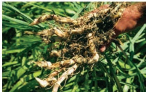
شکل ۵-۳- ریزوم های علف هرز قیاق

کار عملی ۱-۳ : بررسی خصوصیات علف های هرز در مزرعه هنرستان وسایل مورد نیاز : بیل، بیلچه، قیچی باغبانی، بینوکلر و لوپ دستی.