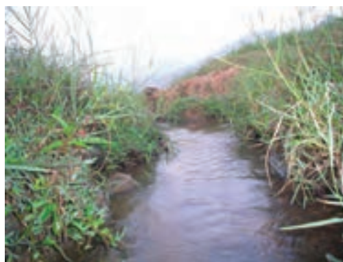
شکل ۱۳-۳ علف‌های هرز روئیده در کنار جوی

از آبی را که باید صرف رشد گیاه اصلی شود مصرف می‌کنند. وجود علف‌های هرز در کف یا کنار جوی‌ها، گُند شدن حرکت آب و به‌دنبال آن، نفوذ بیشتر آب در زمین و خارج شدن مقدار زیادی آب از دسترس کشاورز را در پی خواهد داشت. در بسیاری از مناطق بیشترین کاهش محصول گیاهان به دلیل رقابت با علف‌های هرز بر سر جذب آب است (شکل ۱۳-۳).