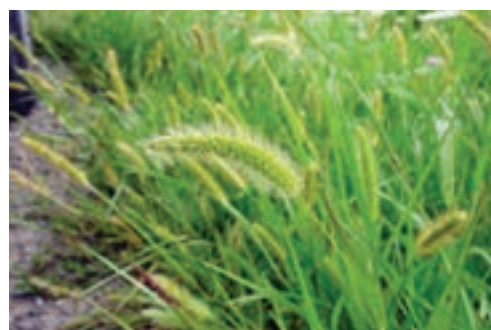
الف- علف هرز دم روباهی

۲- علف های هرز مهاجر: هرگاه علف هرزی در غیر محل رویش اصلی خود، رشد کند مهاجر نامیده می شود. مثلاً رشد بوته گل گندم در مزارع پنبه یا رشد علف هرز گاو پنبه، که بومی زراعت پنبه است، در مزرعه گندم (شکل ۹-۳).