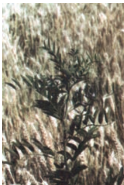
د- شیرین بیان