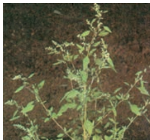
الف - علف هرز سلمه تره (سلمک)

۳- علف‌های هرز بذر بسیار زیادی تولید می‌کنند. برای مثال، تعداد بذر در یک بوته سلمه‌تره (سلمک) به ۷۲۰۰۰ و در تاج خروس به ۱۱۷۴۰۰۰ عدد می‌رسد (شکل ۳-۳).