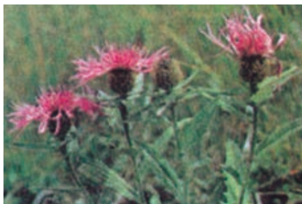
شکل ۸-۳- علف هرز گل گندم در مزرعه گندم

۲- علف های هرز مهاجر: هرگاه علف هرزی در غیر محل رویش اصلی خود، رشد کند مهاجر نامیده می شود. مثلاً رشد بوته گل گندم در مزارع پنبه یا رشد علف هرز گاو پنبه، که بومی زراعت پنبه است، در مزرعه گندم (شکل ۹-۳).