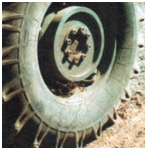
شکل ۱۹-۳: بوته علف هرز که روی چرخ ماشین کشاورزی قرار می گیرد و با آن جابه جا می شود.

بازدید ۳-۳ : همراه با مربی خود از دامداری هایی که دام خود را برای تعلیف به مزارع یا باغ ها می برند بازدید نمایید. روی بدن دام ها، مخصوصاً لابه لای پشم و موهای بدن آنها را بازدید کنید و بذر علف های هرز یا قسمتی از بوته آنها را بیابید.