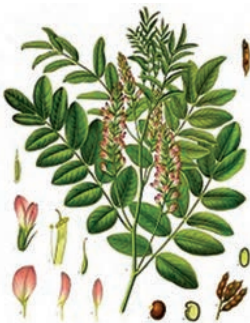
شکل ۱۲-۳- نمونه خشک شده علف هرز شیرین بیان

بازدید ۱-۳: از هرباریوم ها و کلکسیون های علف های