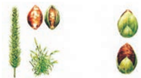
شکل ۱۷-۳- علف هرز دم روباهی که دارای بذرهایی با سطح خشن و ناهموار است و به این علت به بدن جانوران می‌چسبد و جابه‌جا می‌شود.

۳- جانوران: دام از عوامل حفظ و انتشار علف‌های هرز است. دام‌های وحشی و اهلی هر دو در پراکنش بذور علف‌های هرز دخالت دارند. پرندگان از بذر علف‌های هرز تغذیه می‌کنند و سبب انتشار آنها می‌شوند. از جمله این بذور، بذر گل تاج‌ریزی و عشقه را می‌توان نام برد. پرندگان، همچنین برای لانه سازی از ریشه و ریزوم گیاهان استفاده می‌کنند و باعث انتشار علف‌های هرز می‌شوند. بعضی از بذور هم به دلیل داشتن قلاب، کرک، خار یا دارا بودن سطحی خشن و ناهموار به بدن پرندگان یا به بدن و کرک و پشم حیوانات دیگر می‌چسبند و از محلی به محل دیگر منتقل می‌شوند. بذورهای جو موشی، توق و دم روباهی به این طریق پراکنده می‌شوند (شکل ۱۷-۳).