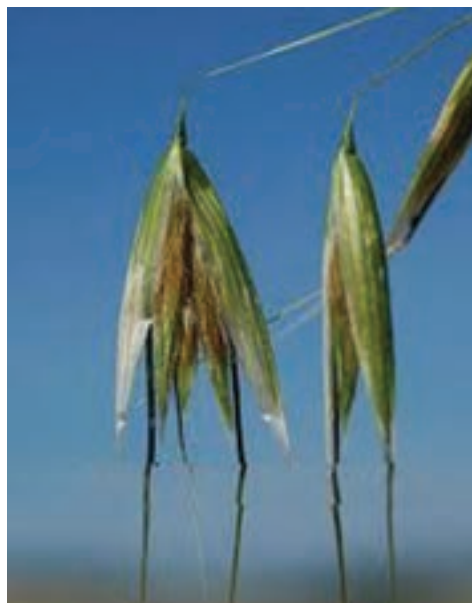
شکل ۴-۳- بذر علف هرز یولاف وحشی با بالپوش برای انتشار آسان تر

۱- گیاهان پهن برگ، مثل پنیرک، سلمه تره و توق (شکل های الف و ب ۳-۶).