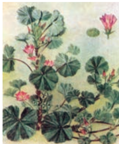
الف- علف هرز پنیرک با ساقه های نرم و پیچنده