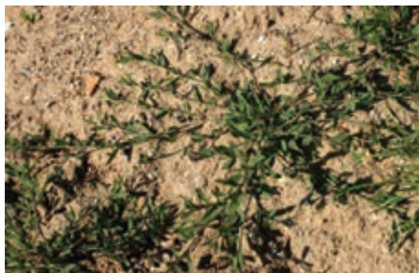
ج- هفت بند

الف) علف های هرز یک ساله : اینها گیاهانی هستند که تنها در یک فصل رویش زندگی می کنند و مراحل تکاملی آنها (از جوانه زدن بذر تا تولید بذر جدید و سپس مرگ بوته) در طول یک سال زراعی صورت می گیرد، مثال : تاج خروس، علف هفت بند، جو وحشی، چچم، دم روباهی، فرفیون، گل گندم و سلمه تره (شکل ۱۰-۳).