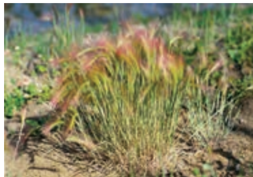
الف- جو وحشی

گیاهانی هستند که قادرند بیش از یک سال زندگی کنند. این گیاهان هر ساله رشد رویشی و تولید بذر دارند و فقط اندام های هوایی آنها از بین می رود و معمولاً ریشه یا ریزوم هایی که تولید می کنند ماندنی است، مثال : هویج وحشی، اویارسلام، پیچک صحرایی، شیرین بیان و قیاق (شکل ۱۱-۳).