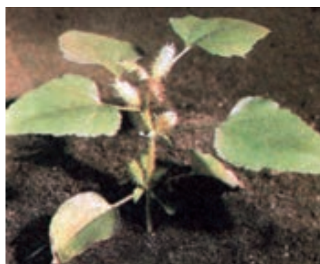
ب- علف هرز توق با ساقه خشی شکل ۶-۳