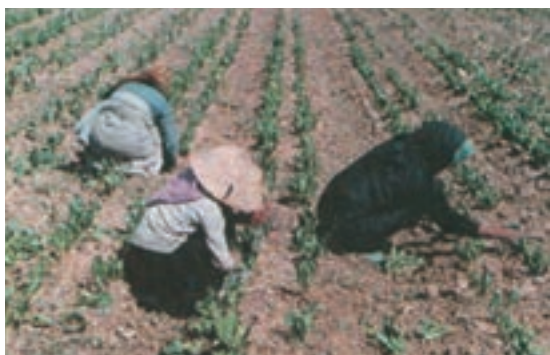
شکل ۱۵-۳ وجین علف‌های هرز توسط کارگران

وسیله‌ای که باشد دارای هزینه قابل توجهی است (شکل ۱۵-۳).