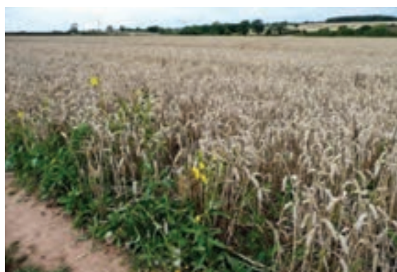
شکل ۳-۲- رویش علف‌های هرز در خاک‌های نامناسب حاشیه مزرعه

۴- بذور آنها عمر طولانی و قوه نامیه بالایی دارند؛ یعنی می‌توانند به خواب بروند و قدرت جوانه‌زنی خود را برای مدتی طولانی حفظ کنند. برای مثال، بذر علف‌های هرز گونه‌هایی از گاوزبان و پیچک صحرایی، دوره خواب چندین ساله دارند. علاوه بر این تمام بذور در برخی از گونه علف‌های هرز علیرغم فراهم شدن شرایط جوانه‌زنی به یکباره یا همزمان جوانه نمی‌زنند.