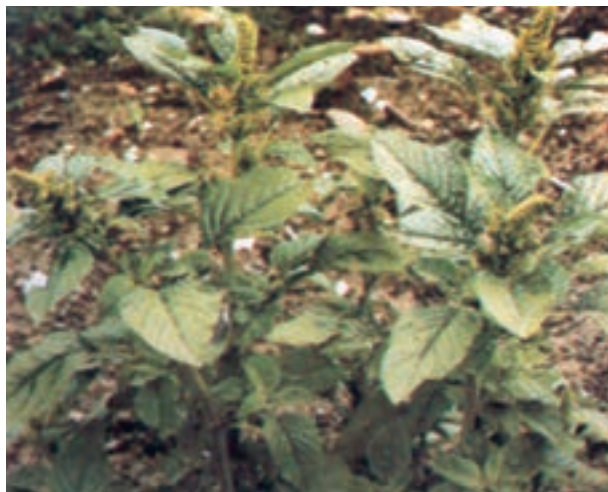
ب- علف هرز تاج خروس