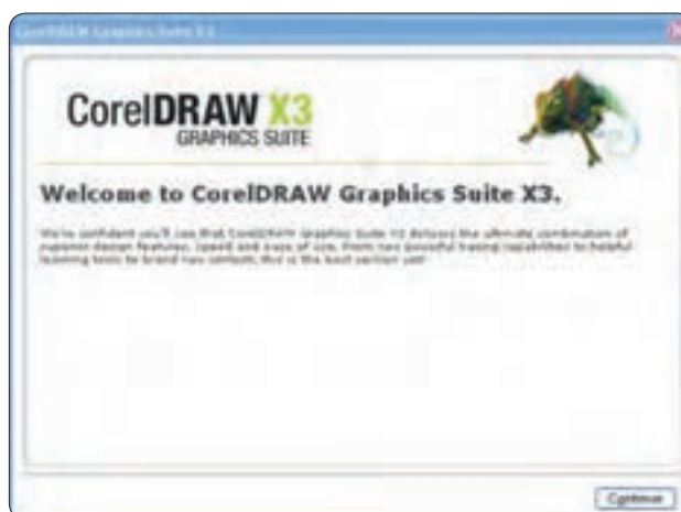
شکل ۱-۱ کادرمحاوره راهنمای نصب

در کادرمحاوره بعدی، شماره سریال (Serial Number) را در بخش 'Already have a Trial serial number?' از محتوای CD پیدا کرده و در کادر متنی مربوطه وارد کنید. سپس روی دکمه Continue کلیک کرده و وارد کادرمحاوره بعدی شوید (شکل ۱-۲).