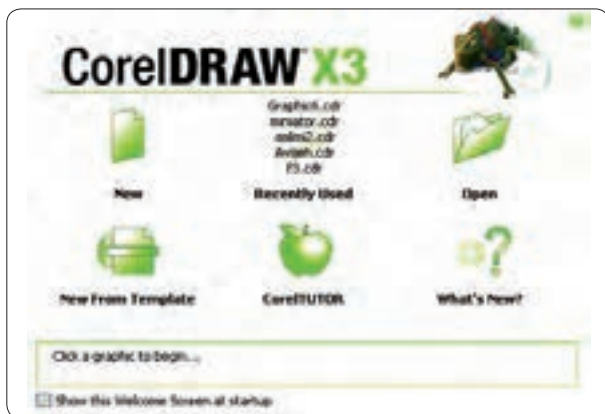
شکل ۱-۴ کادر محاوره خوشامدگویی

از مسیر Start/All Programs/Corel Graphics Suite X3 روی آیکن Corel DRAWX3 کلیک کنید تا نرم‌افزار اجرا شود. با اجرای نرم‌افزار، در ابتدای ورود به برنامه کادر محاوره خوشامدگویی (Welcome screen at startup) ظاهر می‌شود (شکل ۱-۴).