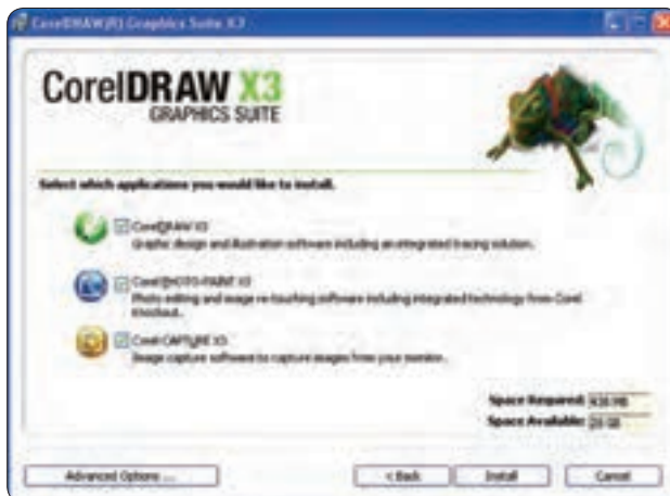
شکل ۳-۱ پنجره راهنمای نصب