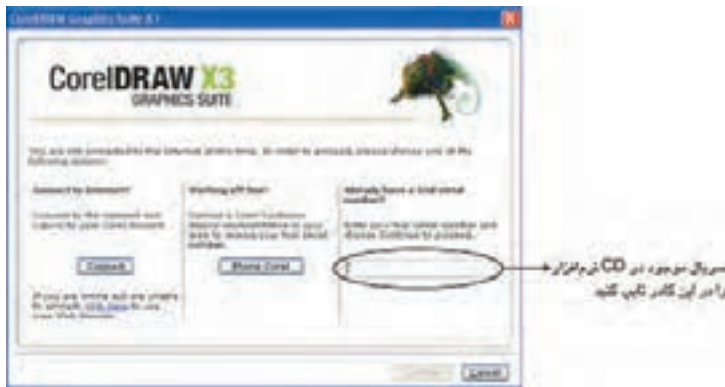
شکل ۲-۱ کادر محاوره راهنمای نصب

را به دلخواه تغییر داد. به عنوان مثال در این قسمت می توانید از نصب شدن Help نرم افزار خودداری کنید اما بهتر است در بخش Advanced Options تغییری ایجاد نشود. روی دکمه Install کلیک کنید تا نصب نرم افزار کامل شود.