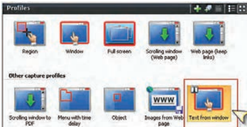
شکل ۳-۲ انتخاب نوع ورودی از بخش Profiles

پنجره‌ای را که می‌خواهید متن موجود در آن را جدا کنید، باز کرده و سپس در نرم‌افزار SnagIt از پانل Profile گزینه‌ی Text from a window را انتخاب کنید. اکنون اگر دکمه Capture را که در قسمت پایین و سمت راست کادر محاوره قرار دارد، کلیک کنید یا از کلید میانبر تعریف شده (Print Screen) استفاده کنید، اشاره‌گر ماوس به شکل یک دست در می‌آید؛ در این حالت چنانچه روی پنجره مورد نظر کلیک کنید، عملیات Capture انجام خواهد شد. (شکل ۳-۲)