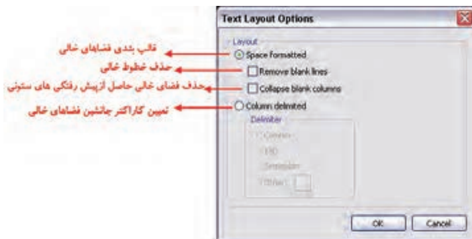
شکل ۳-۵ کادر محاوره تنظیمات جلوه Layout

از این گزینه برای تنظیم قالب بندی مربوط به فضاهای خالی و کاراکترهای جانشین قرار گرفته در این فضاها استفاده می‌شود با اجرای این گزینه، کادر محاوره‌ای مربوط به آن باز خواهد شد. (شکل ۳-۵)