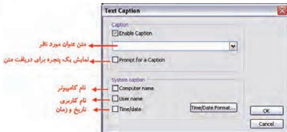
شکل ۳-۶ کادر محاوره Text Caption

با استفاده از این جلوه در بخش Effects می‌توان عناوینی مانند: قرار دادن یک عنوان برای تصویر، قرار دادن نام کامپیوتر، نام کاربر، اضافه کردن تاریخ و زمان را روی خروجی نهایی اعمال کرد. (شکل ۳-۶)