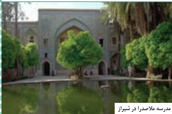
مدرسه ملاصدرا در شیراز

«فلسفه اسلامی فقه اکبر است، پایه دین است، مبنای همه معارف دینی در ذهن و عمل خارجی است، لذا باید گسترش و استحکام پیدا کند.» (مقام معظم رهبری ۱۳۸۲/۱۰/۲۹)