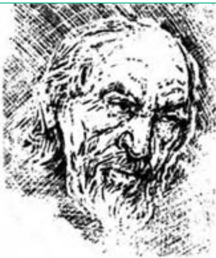
محنی‌الدین ابن عربی