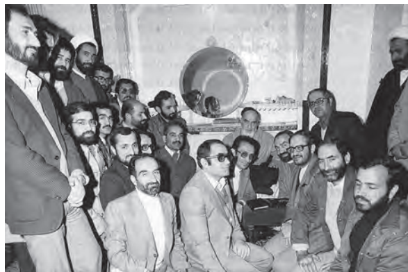
اعضای هیئت دولت شهید محمدعلی رجایی در دیدار با حضرت امام (ره)

پس از شروع به کار مجلس شورای اسلامی، ابتدا محمدعلی رجایی به عنوان نخست‌وزیر معرفی گردید و سپس وزرای معرفی شده توسط او از مجلس شورای اسلامی رأی اعتماد گرفتند؛ دولت دائم بر سر کار آمد و مدیریت امور کشور را از شورای انقلاب تحویل گرفت.