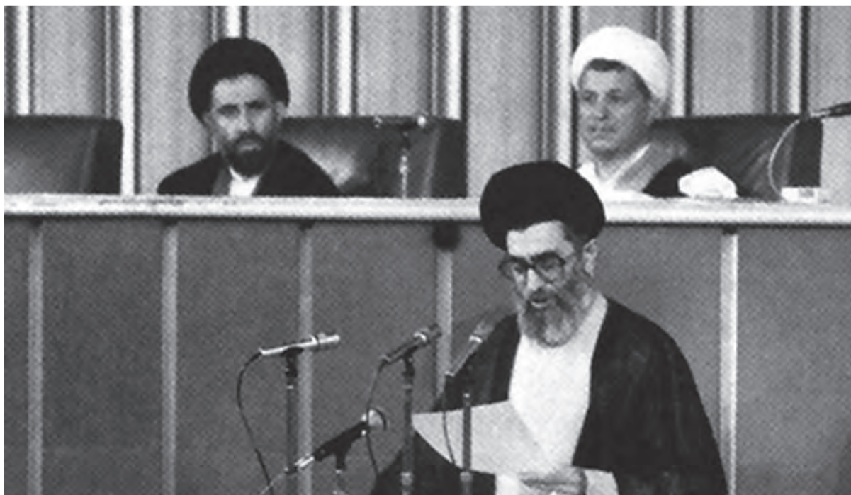
حضرت آیت‌الله خامنه‌ای هنگام خواندن وصیت‌نامه حضرت امام در مجلس خبرگان - ۱۴ خرداد ۱۳۶۸

بلافاصله پس از رحلت بنیان‌گذار جمهوری اسلامی ایران، مجلس خبرگان رهبری تشکیل جلسه داد و با اکثریت قریب به اتفاق آراء، حضرت آیت‌الله سید علی خامنه‌ای را به دلیل داشتن شرایط و ویژگی‌های مندرج در اصل یکصد و نهم قانون اساسی ۱ به مقام رهبری برگزید (۱۴ خرداد ۱۳۶۸).