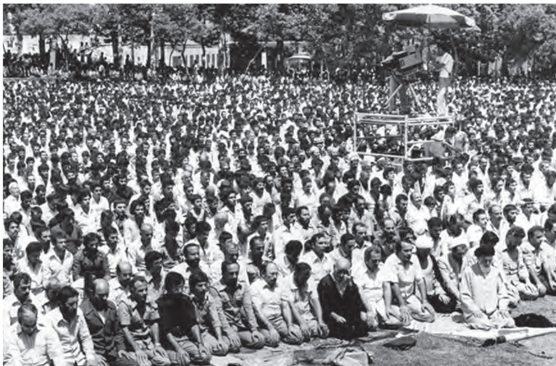
اقامه نخستین نماز جمعه تهران به امامت آیت‌الله طالقانی در دانشگاه تهران

در بُعد آیینی و مناسکی نیز اولین نماز جمعه به امامت آیت‌الله طالقانی (۵ مرداد ۱۳۵۸) در تهران و سپس به تدریج در سایر شهرستان‌ها اقامه گردید.