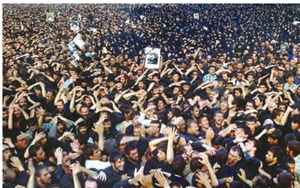
نمایی از تشییع جنازه میلیونی امام خمینی علیه السلام