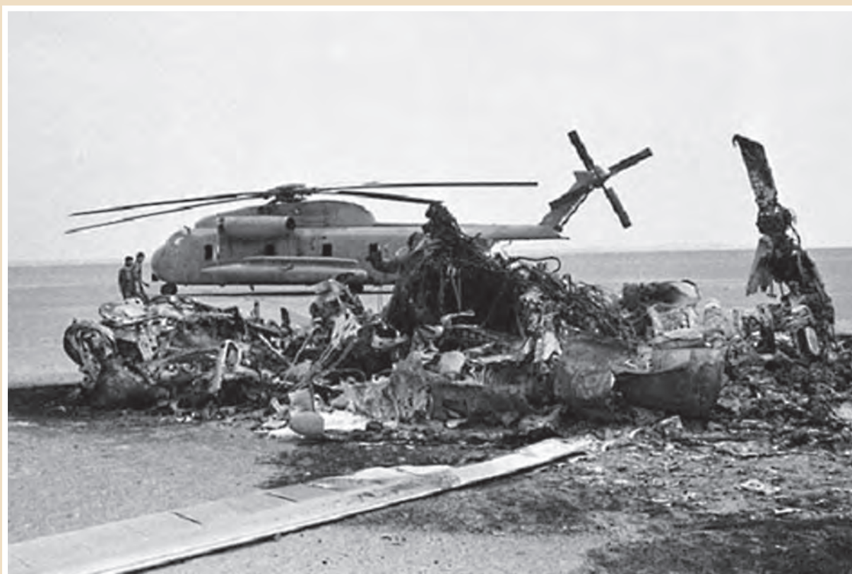
بقایای لاشهٔ هواپیماها و بالگردهای آمریکایی در طبس