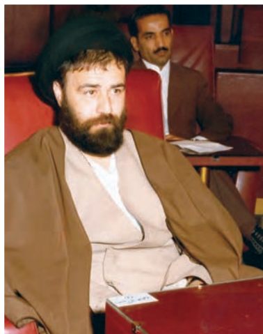
حاج سید احمد آقا خمینی