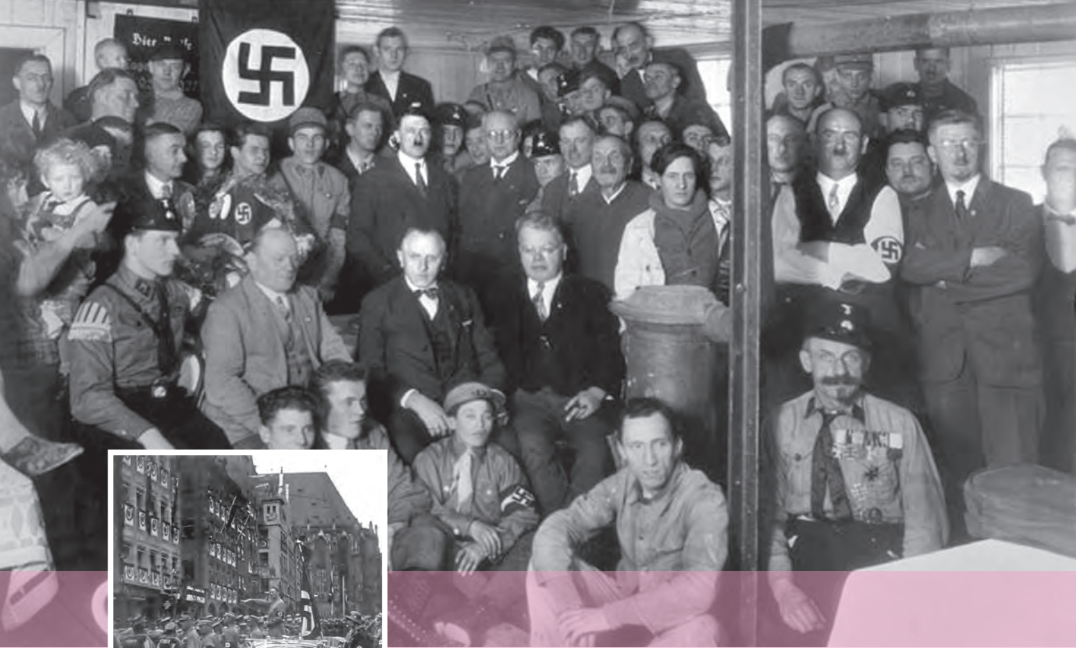
هیتلر و اعضای حزب نازی - دسامبر ۱۹۳۰