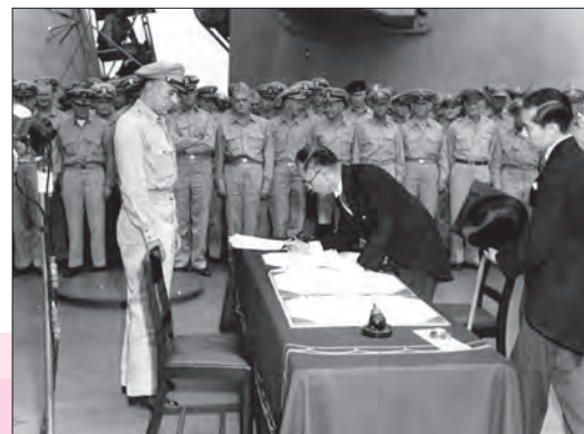
وزیر خارجه ژاپن در حال امضای تسلیم‌نامه این کشور - سپتامبر ۱۹۴۵