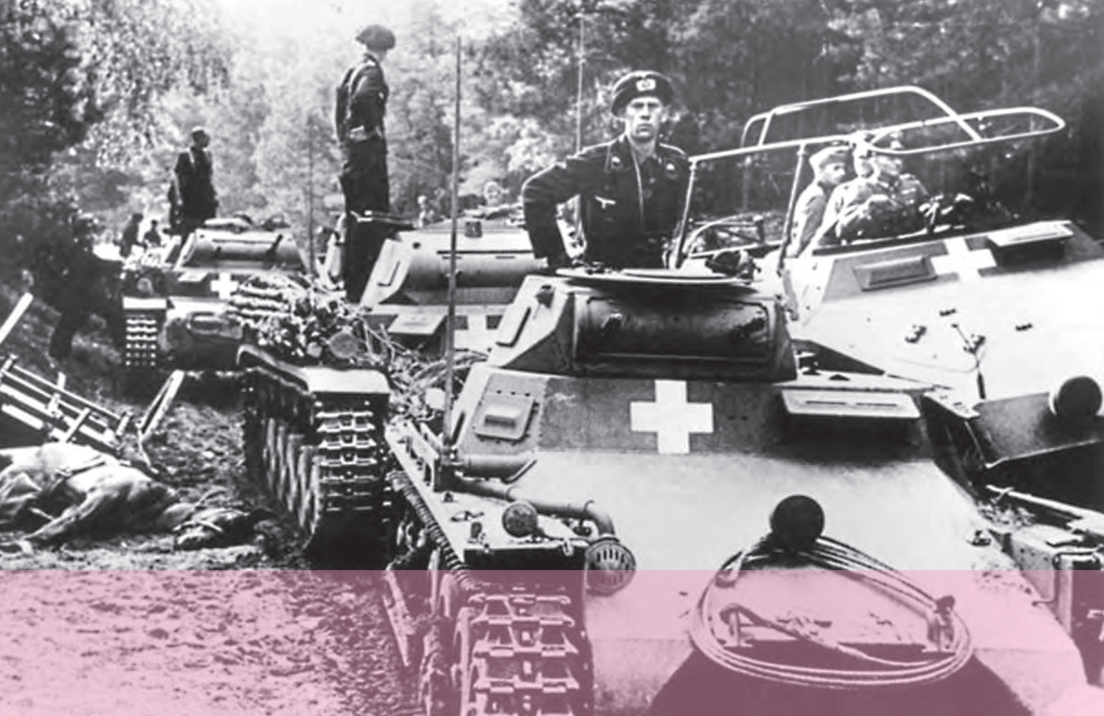
نیروهای ارتش آلمان در حمله به لهستان