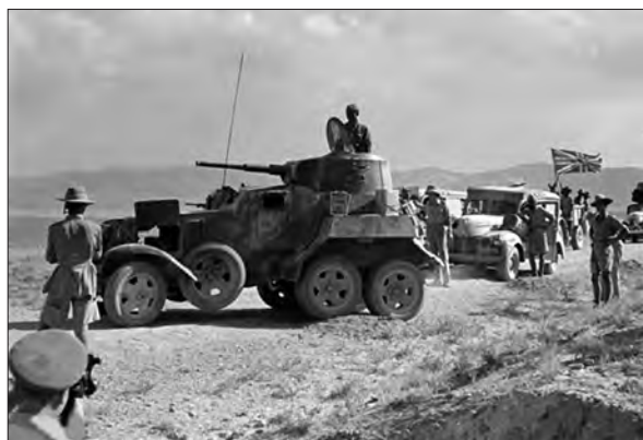
نیروهای انگلیسی در ایران - جنگ جهانی دوم

وقتی جنگ جهانی دوم در گرفت، دولت ایران اعلام بی طرفی کرد. در آن زمان، کشور ما روابط بازرگانی گسترده‌ای با آلمان داشت و تعداد زیادی از کارشناسان (تکنسین‌های) آلمانی در ایران مشغول کار بودند. تلاش‌های انگلستان برای جلوگیری از داد و ستد آلمان با کشورهای بی طرف، اعتراض حکومت رضاشاه را برانگیخت و باعث شد که ایران از طریق شوروی به تجارت با آلمان ادامه دهد.