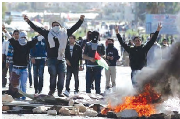
نمایی از انتفاضة مردم فلسطین علیه اشغالگران صهیونیست

اشغال کشور مسلمان فلسطین و تأسیس رژیم غاصب اسرائیل یکی از مسائل مهم منطقه خاورمیانه و جهان اسلام در سده ۲۰م است. مهاجرت گروه‌های کوچکی از یهودیان به فلسطین در اوایل دهه ۱۸۸۰م آغاز شد. انگلستان در سال ۱۹۱۷م با صدور اعلامیه بالفور ۱ نظر مساعد خود را با ایجاد سرزمین یهودی در فلسطین اعلام کرد. در دوران قیمومیت انگلستان بر فلسطین در سال‌های پس از جنگ جهانی اول، یهودیان بیشتری به این کشور مهاجرت کردند و با خرید و تصرف زمین‌های وسیع،