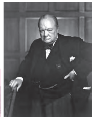
وینستون چرچیل، نخست وزیر انگلستان در دوران جنگ جهانی دوم

بن بست جنگ با انگلستان در جبهه غرب، هیتلر را واداشت که جبهه دیگری در شرق بگشاید. از این رو، ارتش نازی با نادیده گرفتن بیمان عدم تجاوز به شوروی، برق آسا به خاک این کشور، که تا آن زمان در جنگ بی طرف مانده بود، هجوم برد (ژوئن ۱۹۴۱). ارتش استالین که غافلگیر شده بود، ضربات و تلفات سنگینی را متحمل شد و آلمانی ها تا نزدیکی مسکو پیش رفتند، اما روس ها به خود آمدند و سرسختانه در برابر آلمانی ها مقاومت کردند. آنان با بهره گیری از سرمای زود هنگام زمستان و کمک های تدارکاتی و تسلیحاتی انگلستان و آمریکا، که از طریق خاک ایران به آنها می رسید، پیشروی نیروهای آلمانی را متوقف و حملات متقابل خود را آغاز کردند. در نتیجه ایستادگی روس ها، ارتش هیتلر از حالت تهاجمی خارج شد و موضع دفاعی گرفت.