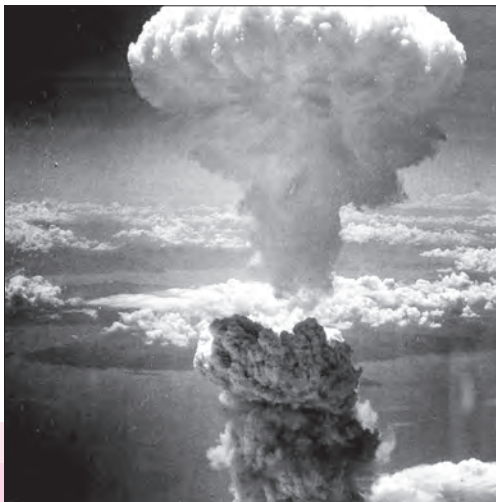
بمباران اتمی ژاپن توسط آمریکا

پس از به زانو درآمدن نازی‌ها، جنگ با ژاپن ادامه یافت. در حالی که نشانه‌های شکست و تسلیم شدن ژاپنی‌ها آشکار شده بود، هواپیماهای آمریکایی دو شهر هیروشیما و ناگاساکی ژاپن را با بمب‌های اتمی ویران کردند و جنگ جهانی دوم با این حادثه وحشتناک به پایان رسید (اوت ۱۹۴۵).