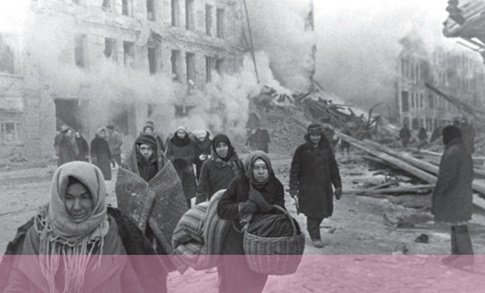
مردم لنینگراد هنگام ترک خانه و کاشانه خود در جنگ جهانی دوم