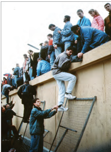
دیوار برلین، نماد عصر جنگ سرد و فروریختن آن، نشانه پایان این عصر بود.

پس از جنگ جهانی دوم، آمریکا با تکیه بر قدرت سیاسی، اقتصادی و نظامی فزاینده خود، رهبری جهان غرب یا کشورهای دارای نظام سرمایه‌داری (بلوک غرب) را برعهده گرفت. شوروی نیز رهبر کشورهای کمونیستی (بلوک شرق) شد. اتحاد و همکاری شوروی با دیگر قدرت‌های متفق در زمان جنگ جهانی دوم به سبب ضرورت مقابله با دشمن مشترک، یعنی فاشیسم و نازیسم، صورت گرفته بود. از این رو، با از میان رفتن دشمن مشترک، رقابت و بی‌اعتمادی شدیدی میان شوروی و کشورهای اقماری آن از یک سو، و آمریکا و کشورهای تحت حمایت آن از سوی دیگر در گرفت و تا سقوط دیوار برلین و فروپاشی نظام کمونیسم ادامه یافت (۱۹۸۹م). این دوره از تاریخ به عصر جنگ سرد معروف شده است.