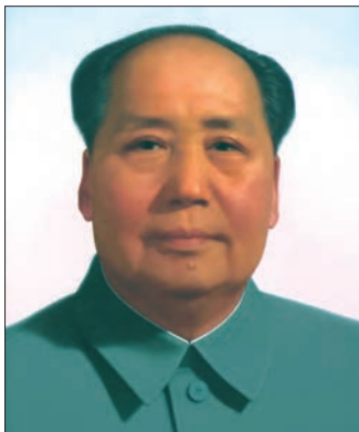
مائو، بنیان‌گذار جمهوری خلق چین

ژاپن، صنعتی‌ترین کشور آسیا، پس از شکست در جنگ جهانی دوم به اشغال آمریکا درآمد. قانون اساسی جدید آن کشور، دموکراسی را تقویت و قدرت سیاسی را از اختیار امپراتور و فرماندهان نظامی خارج کرد و به نمایندگان منتخب ملت سپرد. ژاپنی‌ها نیز با سخت‌کوشی و برنامه‌ریزی دقیق به موفق‌ترین قدرت پیشرو اقتصادی در جهان تبدیل شدند. تولید صنعتی این کشور در سال ۱۹۵۳م به میزان تولید سال‌های آغازین جنگ جهانی دوم رسید ۱ .