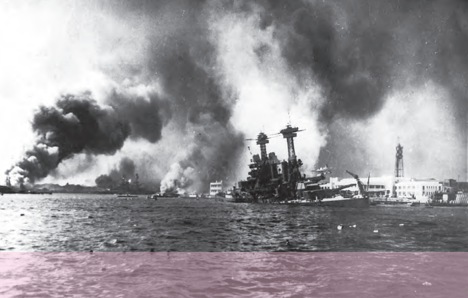
حمله هوایی ژاپن به ناوگان دریایی آمریکا در پرل هاربر