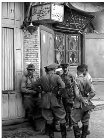
نظامیان شوروی در ایران - قزوین - جنگ جهانی دوم