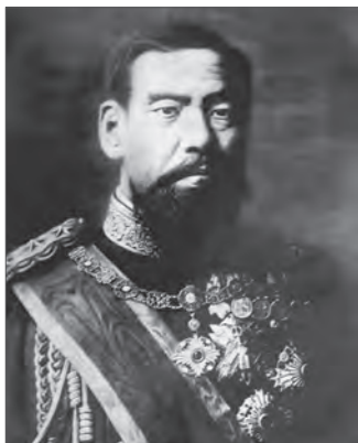
موتسو هیتو (Mutsuhito)، امپراتور ژاپن (۱۸۶۸-۱۹۱۲م) در دوران انقلاب میجی

ژاپن در جنگ جهانی اول به اتفاق مثلث پیوست اما در مقایسه با انگلستان، فرانسه و آلمان زیان عمده‌ای متحمل نشد و اقتصادش در سال‌های پس از جنگ همچنان شکوفا بود. از آنجا که اقتصاد ژاپن وابسته به واردات مواد خام بود، رشد صنعتی این کشور با قدرت نظامی و دریانوردی ارتباط تنگاتنگی داشت. در فاصله دو جنگ جهانی، نظامیان هدایت سیاست داخلی و خارجی ژاپن را در اختیار گرفتند و آن را به سمت و سوی توسعه طلبی نظامی سوق دادند. همچنین، به کشورهای همسایه از جمله چین لشکرکشی کردند، از جامعه ملل خارج شدند و به همراه آلمان و ایتالیا کشورهای محور را شکل دادند.