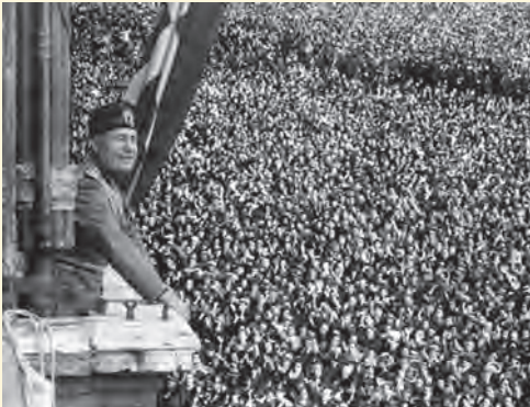
موسولینی هنگام سخنرانی در میان هواداران پرشور خود- وینز ۱۹۳۳ م

یکی از رایج‌ترین شیوه‌های تبلیغات فاشیستی طرح شعارهایی چون «موسولینی همواره درست می‌گوید» به صورت پوستر و چسباندن آن بر در و دیوار در سرتاسر ایتالیا بود (فوگل، تمدن مغرب زمین، ج ۲، ص ۱۲۰۵). در باره نسبت این شعار با مرام و مسلک فاشیستی با یکدیگر مباحثه کنید.