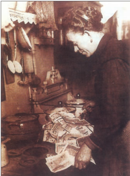
در سال ۱۹۲۳، ارزش مارک آلمان به اندازه‌ای سقوط کرد که از اسکناس به جای سوخت، به‌عنوان کاغذ دیواری و برای پر کردن تشک استفاده می‌شد.

یکی از مسائل مهم جهان و به‌خصوص اروپا در دوران پس از جنگ جهانی اول، بازسازی ویرانی‌های ناشی از جنگ و ایجاد رونق و رفاه اقتصادی بود. برخی از کشورها، مانند انگلستان، به اتکای منابع خود و ثروت مستعمراتشان تا حدودی از عهده‌این کار برآمدند اما بسیاری دیگر با مشکلات شدیدی مانند رکود و تورم روبه‌رو شدند. آلمان از جمله کشورهایی بود که در نخستین سال‌های پس از جنگ جهانی اول شرایط اقتصادی وخیمی داشت؛ زیرا علاوه بر خرابی‌های حاصل از جنگ، مستعمراتش را از دست داده و محکوم به پرداخت غرامت‌های سنگین شده بود.