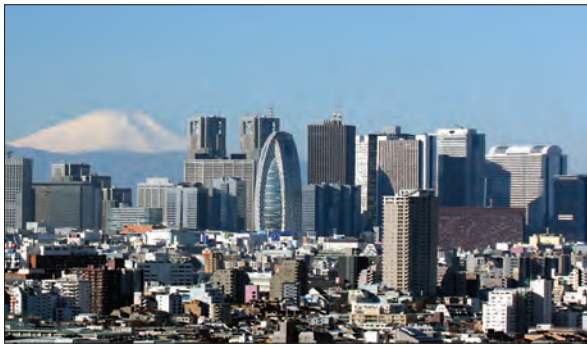
توکیو، قلب مراکز مالی و اقتصادی ژاپن