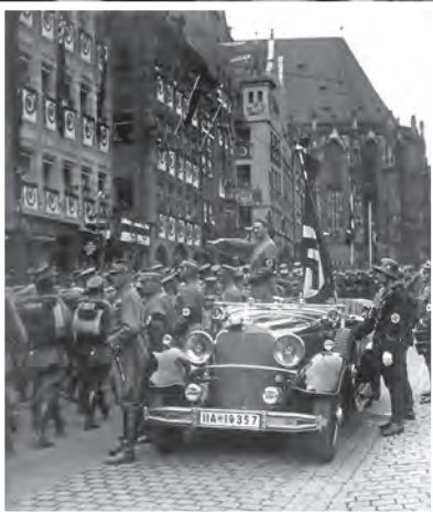
رژه نازی‌ها - ۱۹۳۵ م

هیتلر و نازی‌ها پس از به دست گرفتن زمام امور و لغو قرارداد ورسای، برای متحول کردن اقتصاد آلمان و تحقق وعده‌های خویش برنامه‌های گوناگونی را اجرا کردند. ساخت شبکه وسیعی از جاده‌ها و راه‌آهن، ایجاد مؤسسات عمومی و راه‌اندازی کارخانه‌های بزرگ به خصوص صنایع تسلیحاتی از جمله طرح‌های عمرانی و اقتصادی بود که به اجرا درآمد و به بحران رکود و بیکاری در آلمان پایان داد. در بُعد نظامی نیز هیتلر به سرعت ارتش و تشکیلات نظامی را گسترش داد و به سلاح‌ها و فناوری‌های پیشرفته جنگی مجهز کرد. در بُعد روابط خارجی، نازی‌ها به رهبری هیتلر علاوه بر بستن پیمان‌های دو و چندجانبه با برخی کشورها، برنامه‌های توسعه‌طلبانه سرحدی و سرزمینی خود را به پیش بردند. (مهم‌ترین این برنامه‌ها را در جدول صفحه بعد بخوانید). هیتلر عقیده داشت که آلمان برای به دست آوردن فضای حیاتی، باید سرزمین‌هایی را در اروپا فتح کند.