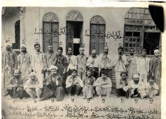
جمعی از مشروطه‌خواهان که پس از به توپ بستن مجلس در باغ شاه غل و زنجیر شدند.

واقعاً، تعدادی از مشروطه‌خواهان از جمله آیت‌الله سیدمحمد طباطبایی و آیت‌الله سیدعبدالله بهبهانی تبعید شدند و گروهی نیز به سفارتخانه‌های کشورهای خارجی پناه بردند (تیر ۱۲۸۷). چند تن از مشروطه‌خواهان پرشور مانند میرزا جهانگیرخان صوراسرافیل، حاجی میرزا نصرالله ملک‌المکلمین و