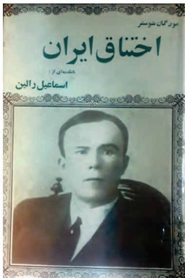
کتاب اختناق ایران نوشته مورگان شوستر

۲- فقدان تشکیلات منظم و منسجم اداری و اقتصادی به حکومت مشروطه اجازه نمی‌داد که حاکمیت ملی را در سرتاسر کشور برقرار کند و برنامه‌های خود را پیش ببرد. هیئت وزیران شکل گرفت اما وزارت‌خانه و تشکیلات منسجمی وجود نداشت. از نظر مالی نیز دولت مشروطه در تنگناهای بسیاری قرار داشت و خزانه آن تقریباً خالی بود. کارگردآوری درآمدهای حکومتی هم مختل بود. نمایندگان دومین دوره مجلس شورای ملی (۱۲۸۸-۱۲۸۹ ش) چاره رفع این مشکلات را در استخدام کارشناسان خارجی دیدند. از این رو، چندین کارشناس امور اداری- مالی به ریاست مورگان شوستر از کشور آمریکا و تعدادی کارشناس نظامی سوئدی برای تأسیس نیروی ژاندارمری به استخدام دولت ایران درآمدند. پس از شروع به کار کارشناسان آمریکایی در ایران، دولت‌های انگلستان و به خصوص روسیه با این اقدام مخالفت کردند. در نتیجه دخالت و تهدید نظامی روسیه، دولت ایران مجبور شد به رغم مخالفت مجلس شورای ملی، کارشناسان آمریکایی را برکنار کند و به کشورشان بفرستد.