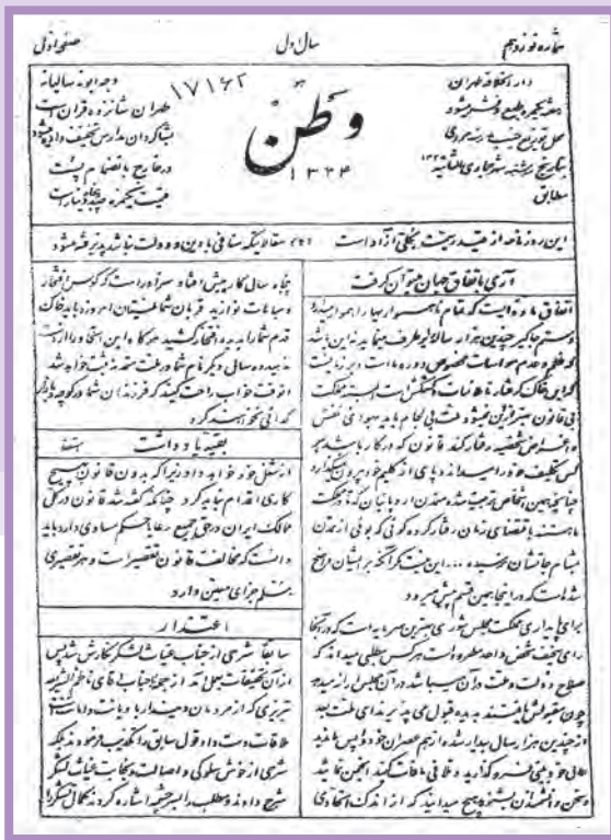
صفحه اول روزنامه وطن

برخی از روزنامه‌نگاران از نقد اشخاص و نهادها فراتر رفتند و به تخریب، توهین و ناسزاگویی روی آوردند. این تندروی‌ها بر روند رویدادها و تحولات بعدی انقلاب مشروطه و تشدید اختلاف‌ها و دشمنی‌های داخلی تأثیر چشمگیری داشت.