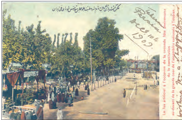
جشن‌های سالگشت پیروزی انقلاب مشروطه