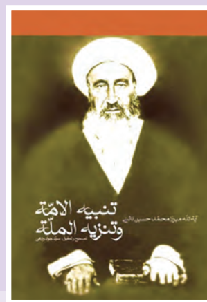
کتاب تنبیه‌الامه و تنزیه‌المله نوشته میرزای نائینی