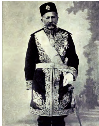
محمد ولی خان تنکابنی (۱۲۲۵-۱۳۰۵ ش)