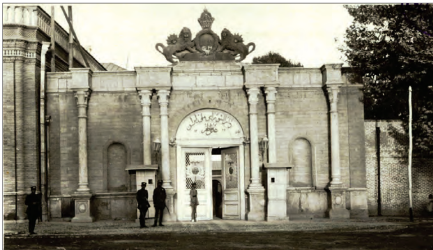
ساختمان مجلس شورای ملی در میدان بهارستان - تهران

انقلاب مشروطه، جنبش سیاسی و اجتماعی گسترده و قدرتمندی بود که در زمان مظفرالدین شاه به وقوع پیوست. آرمان و هدف انقلاب مشروطه این بود که آزادی و برابری را در کشور برقرار سازد و با تدوین و اجرای قانون اساسی و برپایی مجلس شورای ملی، حکومت مستبد، ناکارآمد و ناسالم قاجار را به حکومتی قانونمند و کارآمد تبدیل کند. در واقع، ایرانیان با این انقلاب برای نخستین بار، خواهان تغییر شیوه اداره کشور شدند و در صدد برآمدند که حکومت خودکامه قاجار را به سلطنتی مشروطه، در چارچوب قانون و تحت نظارت نمایندگان خود در مجلس شورای ملی در آورند.