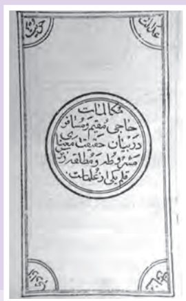
رساله مقیم و مسافر اثر حاج آقا نورالله نجفی اصفهانی