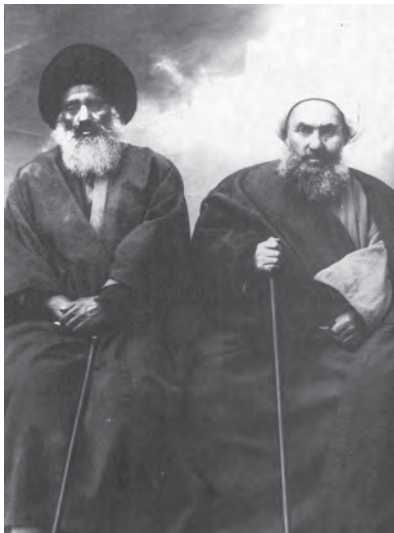
آیت الله شیخ فضل الله نوری و آیت الله سید عبدالله بهبهانی

پس از جبهه گیری شیخ فضل الله نوری در مقابل مشروطه، دو جریان فکری - سیاسی قدرتمند در برابر هم صف آرای کردند. در یک سو شیخ فضل الله نوری و شمار زیادی از روحانیان و طلاب از تهران و سایر شهرهای ایران و عتبات عالیات قرار داشتند که با مشروطه به مخالفت برخاسته بودند. آیت الله سید کاظم طباطبایی یزدی از مراجع ساکن نجف نیز از جمله این مخالفان بود. اعضای این جریان فکری، علاوه بر بست نشینی و برپایی گردهمایی های اعتراضی، کتاب ها و رساله های متعددی در نقد و