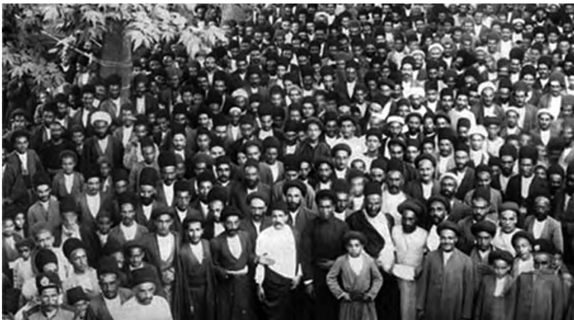
بست‌نشینان مشروطه خواه - سفارتخانه انگلستان - تهران

الف) چند مورد از ویژگی‌های مشترک رویدادهایی را که منجر به انقلاب مشروطه شد، استخراج و فهرست کنید. ب) در خواسته‌های معترضان، از مهاجرت صغرا تا مهاجرت کبرا چه تغییر و تحولی صورت گرفت؟