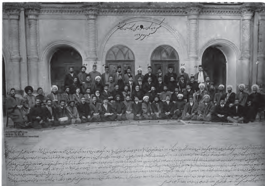
نمایندگان نخستین دوره مجلس شورای ملی

به طرز کار مجلس شورای ملی مربوط می شد. به همین سبب، اصول قانون اساسی کشورهای فرانسه و بلژیک اقتباس شده بود. قانون اساسی مشروطه و مُتمّم آن با اصلاحیه‌هایی جزئی، که در دوران حکومت پهلوی در آن صورت گرفت، تا پیروزی انقلاب اسلامی (۱۳۵۷ش) رسمیت داشت.