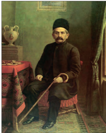
نگاره سردار اسعد بختیاری (۱۲۳۶-۱۲۹۶ ش) اثر کمال الملک

سرانجام نیروهای بختیاری به فرماندهی سردار اسعد و مجاهدان گیلانی با هدایت محمدولی خان تنکابنی و بیرم خان ارمنی در عملیاتی هماهنگ تهران را فتح کردند. با پناهندگی محمدعلی شاه به سفارت روسیه، دوره استبداد صغیر به سر آمد (تیر ۱۲۸۸).