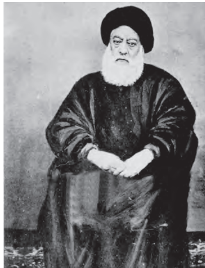
آیت الله سید محمد طباطبایی (۱۲۲۱ - ۱۲۹۹ ش)

و میرزا حسین خلیلی تهرانی) نیز به دفاع از انقلاب و نظام مشروطه برخاستند. هواداران مشروطه هم آثار متعددی در تأیید و وجوب مشروطه و رد دیدگاه مخالفان نوشتند که یکی از شاخص ترین آنها نوشته آیت الله میرزای نائینی است.