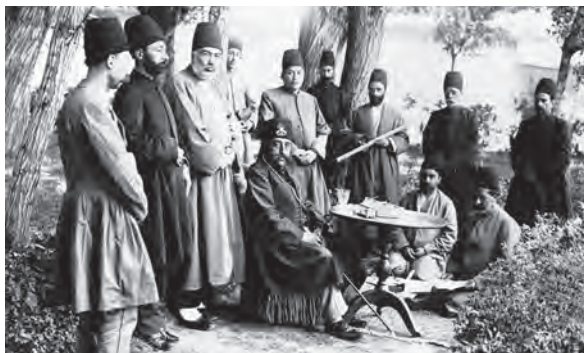
مظفرالدین‌شاه به همراه جمعی از درباریان و ملازمان

در چنین شرایطی بود که منتقدان و مخالفان، فرصت و جرئت یافتند که حکومت قاجار و عملکرد مقام‌های آن را بیش از گذشته