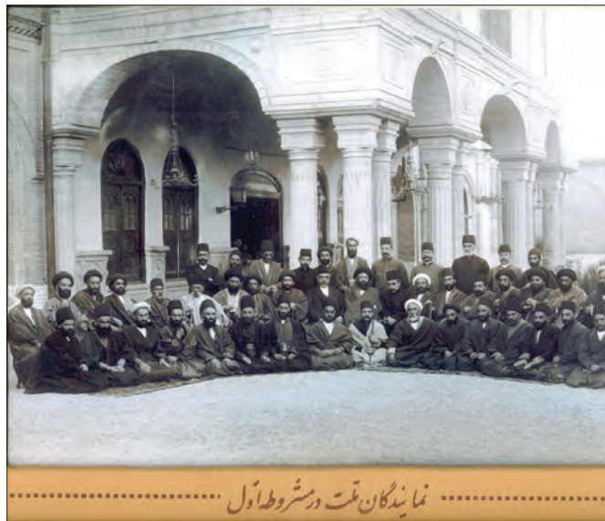
نمایندگان دومین دوره مجلس شورای ملی

ناکارآمد بودن سازمان اداری و نظامی و وجود مشکلات اقتصادی و مالی بسیار موجب آن شد که منتقدان محلی، به ویژه سران ایلات، در مناطق مختلف کشور قدرت خود را گسترش دهند و حاکمیت دولت مرکزی را متزلزل کنند. برخی از آنان حتی با مأموران دولت‌های خارجی مانند انگلستان رابطه برقرار کردند و تحت حمایت آنها قرار گرفتند. ۳- یکی دیگر از عوامل تأثیرگذار بر ناکامی حکومت مشروطه، مداخله و فشار خارجی بود. انقلاب مشروطه ایران در شرایطی