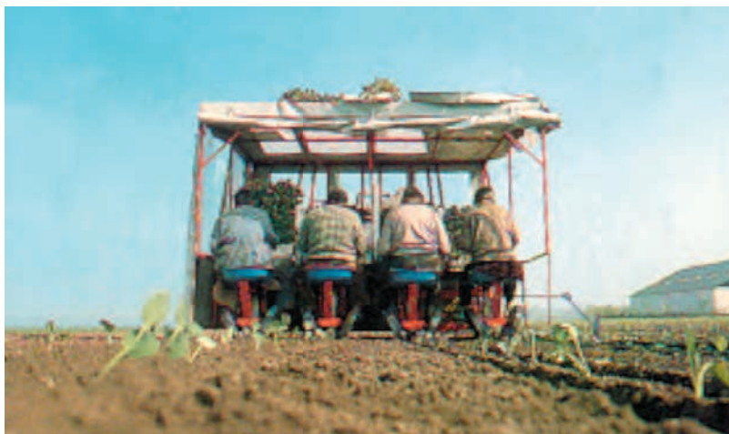
شکل ۹۵-۱- نشاکاری توسط ماشین را نشان می‌دهد.