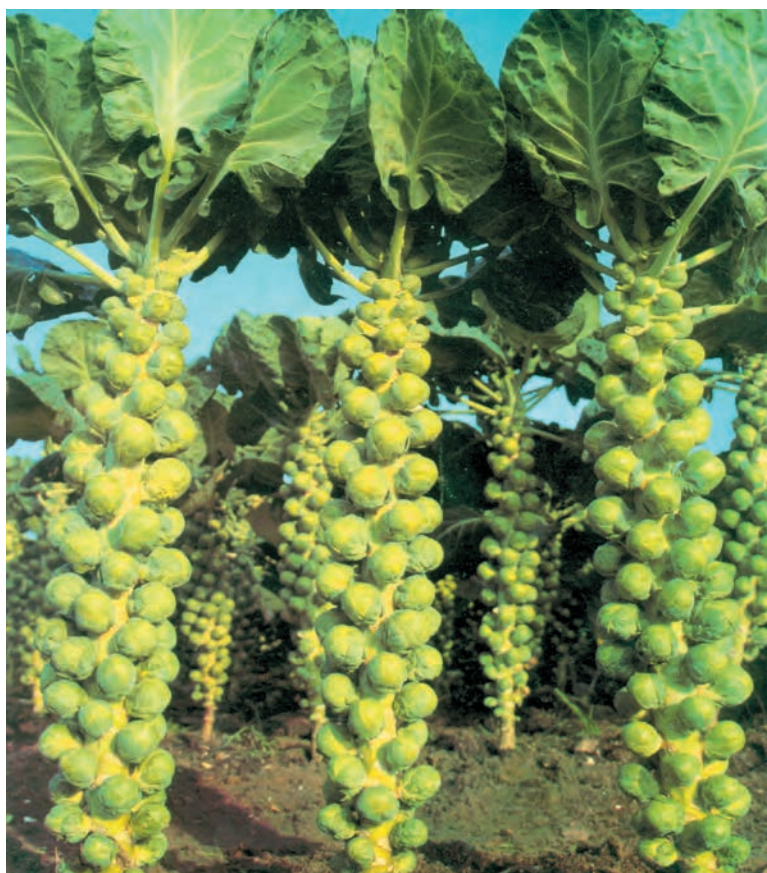
شکل ۸۶-۱- تکمه‌ها را روی گیاه کلم تکمه‌ای نشان می‌دهد.

- گیاهی از خانوادهٔ چلیپاییان ۱ و از جنس براسیکا ۲ و گونه براسیکا اولرسه‌آ ۳ و از واریته ژمنیفر ۴ است (شکلهای ۸۶-۱ و ۸۷-۱).