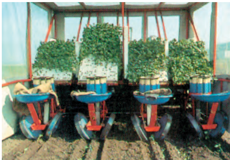
شکل ۹۴-۱ — دستگاه نشاکار

— کاشت در خزانه: اگر در خزانه کشت می‌کنید پس از