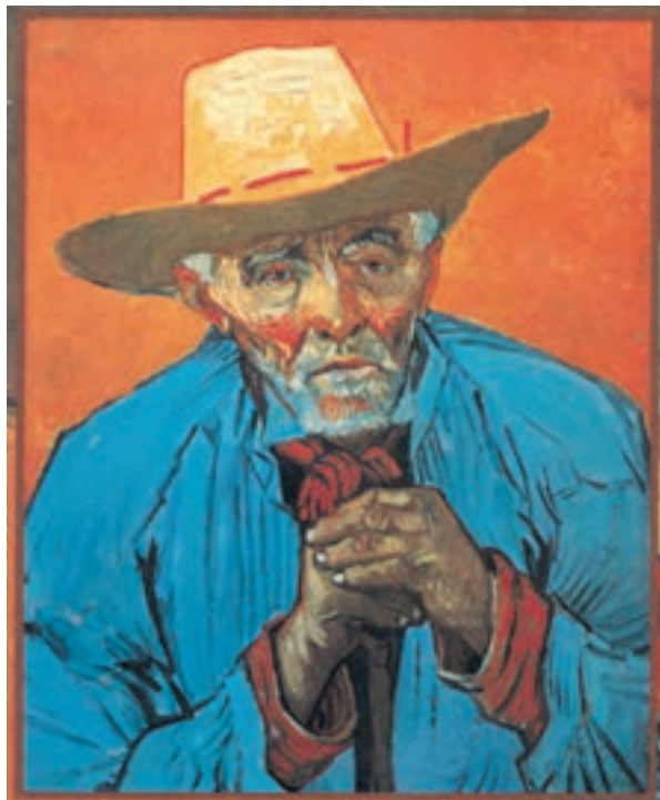
تصویر ۱۲-۳ اثر ونسان ون گوگ، رنگ روغن روی بوم، (۵۶×۶۹ سانتی‌متر)

طرح نهایی خود را به کمک خطوط بر بوم نقاشی اجرا کنید. بهتر است در مرحله نخست سطوح کلی تیره و روشن را از هم مجزا کنید. برای بخشهایی که نور به پیکره تابیده از رنگهای زرد – قرمز و نارنجی استفاده کنید و در سایه‌ها می‌توانید از رنگهای آبی، سبز و بنفش استفاده کنید. در تصاویر (۱۱-۳) و (۱۲-۳) به کارگیری رنگهای اصلی و ثانویه در جهت بیان حالات روحی به خوبی دیده می‌شود.