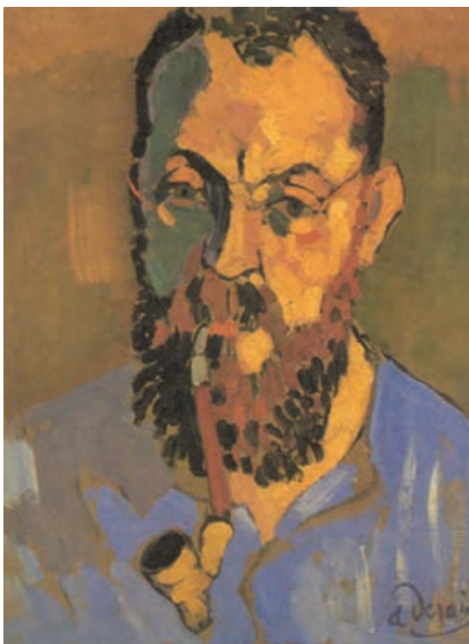
تصویر ۳-۹- اثر آندره دُرن، رنگ روغن روی بوم، (۳۵×۴۶ سانتی‌متر)

دُرن با به کارگیری مجموعه رنگهای اصلی و ثانویه، چهره هانری ماتیس نقاش فرانسوی را در حین کشیدن پیمپ نقاشی کرده است. او ابتدا طرح خود را به سطوح کلی، بر اساس تابش نور از سمت راست تفکیک کرده است. برای بخش نور، از رنگهای زرد، قرمز، نارنجی و قهوه‌ای و برای سایه‌ها، از رنگهای سبز، بنفش و آبی سود جسته است. دُرن با اشاره‌های خفیف مثل نور عینک در سمت چپ چهره و سایه زیر چشم در بخش راست چهره، از دو قسمتی شدن چهره به نور و سایه جلوگیری کرده است. همین‌طور پیمپ که دارای رنگهای نارنجی و قهوه‌ای است در بنفش پیراهن باعث چرخش کلی رنگها و هماهنگی تصویر می‌شود. دُرن، با این که از رنگهای خالص و ثانویه استفاده کرده ولی شکل به کارگیری رنگها و نحوه قلم زدن او، به حجم‌پردازی چهره کمک کرده است. از طرفی این رنگها توانسته‌اند چهره‌ای حساس و نگران را به ما نشان دهند.