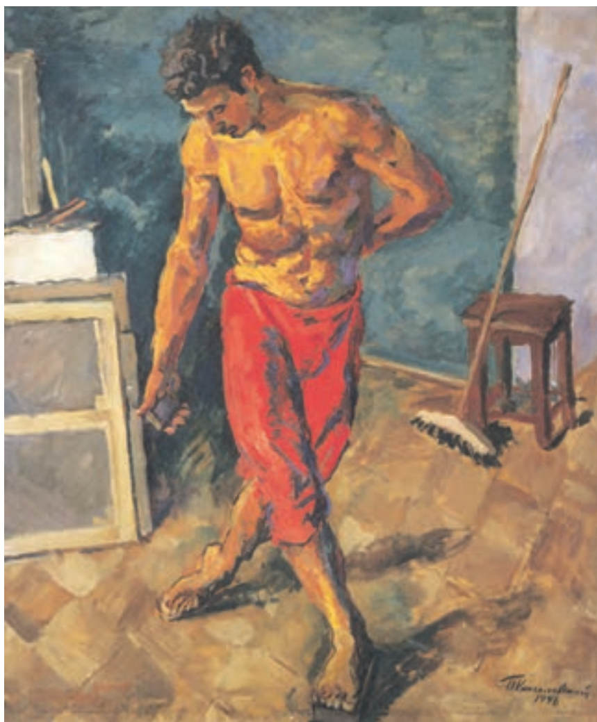
تصویر ۱۹-۳ — اثر پیوتر کانچالوفسکی ۱ ، رنگ روغن روی بوم، (۱۷۱×۱۴۳ سانتی متر)

مطابق آنچه پیش تر گفته شد پیش طرحی از مدل خود که با توجه به نورپردازی و فضا سازی محیط در آن، رنگهای گرم بر آن حاکمیت دارند، تهیه کنید. برای مثال می توانید مدل خود را به کمک نور مصنوعی که غالباً رنگهای گرم تولید می کنند نورپردازی نمایید و لباس و رنگ اشیای پس زمینه را مطابق خواست خود تغییر دهید. بازتابهای نور حاصل از شعله شمع و آتش نیز رنگهای گرم ایجاد می کنند. اینک، به کمک مجموعه رنگهای گرم دایره رنگ و ترکیبات آن می توانید طرح خود را بازسازی کنید. از سطوح کلی نور و سایه و تیره و روشن رنگ بهره بگیرید و رفته رفته سطوح بزرگ را به کمک رنگهایی با سطوح کوچکتر، از یکدیگر تفکیک کنید به گونه ای که رفته رفته حجم اشیای شما آشکار شود. در اینجا نیز در ابتدا اگر محدوده کوچکتری از رنگهای گرم را انتخاب کنید و پس از دست یافتن به مهارت بیشتر رفته رفته رنگهای دیگر را به آن بیفزاید نتیجه بهتری حاصل خواهد شد (تصویر ۱۹-۳).