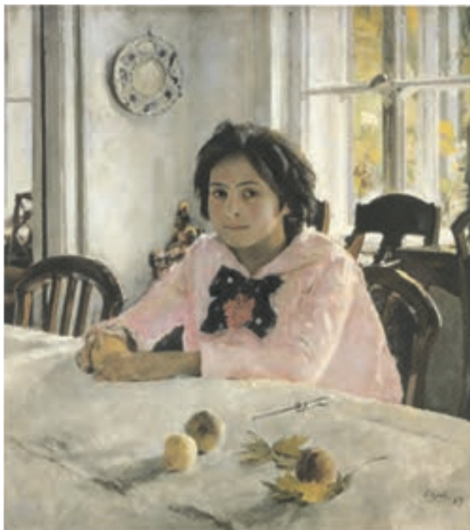
تصویر ۳-۲۵- اثر والتین سرف، رنگ روغن روی بوم، (۸۵×۹۱ سانتی‌متر)