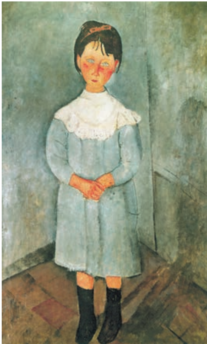
تصویر ۲۲-۳ اثر آمادئو مدیلیانی، رنگ روغن روی بوم، (۱۱۷×۷۲/۳۹ سانتی‌متر)

نقاش، طراحی خود را از دختر بچه با خطوط ظریف انجام داده است، دخترک، با سر کج و دستهای درهم، در کنج اتاق ایستاده است. او سپس بخش عمده نقاشی را با خاکستریهای رنگی مایل به آبی، سبز و بنفش پوشانده و کف اتاق قهوه‌ای و بنفش و دستها و صورت را زرد و نارنجی رنگ آمیزی کرده است.