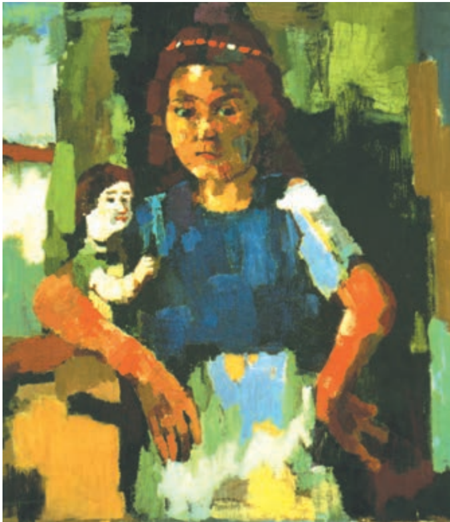
تصویر ۱۰-۳- اثر اُسکار کوشکا، رنگ روغن روی بوم

اُسکار کوشکا فقط به چهره نپرداخته، بلکه نیم تنه‌ای از یک دختر بچه با عروسکش را در کنار پنجره تصویر کرده است و نور را از سمت چپ به آن تابانده است، کوشکا نیز با وجود ساده کردن سطوح به کمک رنگ توانسته است حجم و فضایی را که دخترک ایستاده نشان دهد. گردش سبزه‌ها و همین‌طور رنگهای سفید، زرد، نارنجی و قهوه‌ای و سیاهها در تمام اثر، باعث احساس تعادل رنگی در چشم بیننده می‌شود.