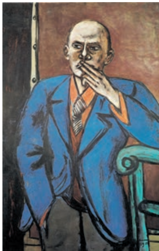
تصویر ۱۱-۳ اثر ماکس بکمان، رنگ روغن روی بوم، (۹۱/۴۴×۱۴۰ سانتی‌متر)