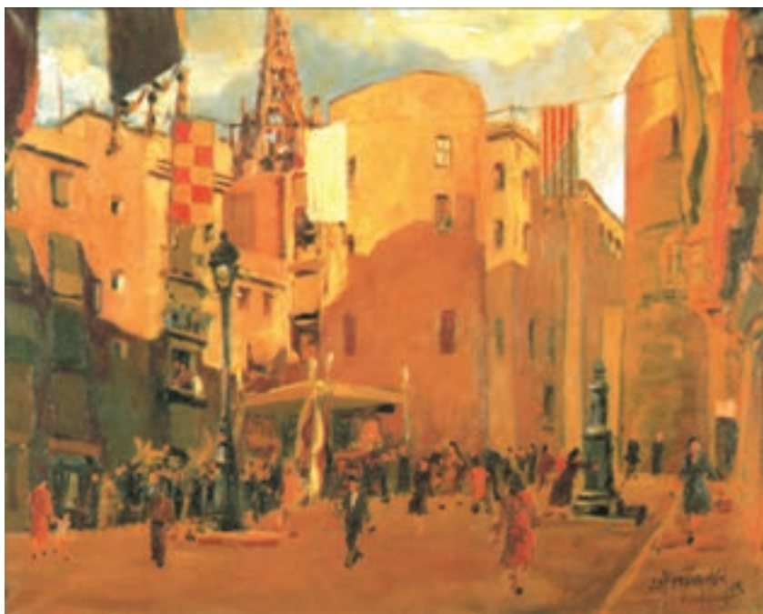
تصویر ۲۴-۲- اثر خوزه پارامون، رنگ روغن روی بوم، حاکمیت رنگ گرم

به تصویر (۲۴-۲) نگاه کنید. نقاش در قسمت پایین سمت چپ، مجموعه‌ای از رنگها را برای نمایش تیرگی و سایه به کار برده که از ترکیبهای سبز و بنفش و قرمز به دست آمده است ولی غالب رنگهای نقاشی، تمایل به گرمی دارند. تصویر (۲۵-۲) مجموعه رنگهای گرم به کار رفته در نقاشی را نشان می‌دهد.