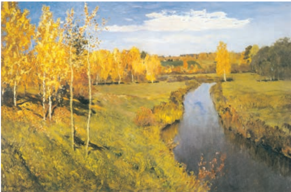
تصویر ۲۶-۲ اثر ایزاک لویتان، رنگ روغن روی بوم، (۸۲×۱۲۶ سانتی‌متر)

در تصویر (۲-۲۶) پاییز طلایی اثر ایزاک لویتان ۱ ، با وجود رنگهای آبی، حاکمیت با رنگهای گرم و به خصوص زرد است. تصویر (۲-۲۷) نیز حاکمیت رنگ گرم را نشان می‌دهد.