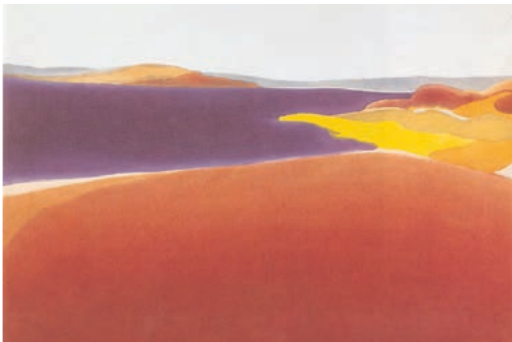
تصویر ۲۷-۲- اثر الیزابت آزُون ۱ ، اکریلیک روی بوم، (۱۰۲/۶×۱۰۱/۶ سانتی متر)