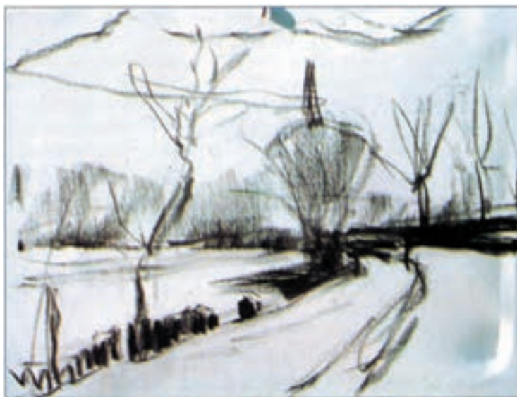
تصویر ۳۵-۲ اثر خوزه پارامون

از موضوع خود، یک پیش طرح ساده با رعایت اصول ترکیب بندی، تهیه کنید. تا حد امکان از توجه به جزئیات در طرح اولیه خود بپرهیزید. تصویر (۲-۳۵) مثال بسیار خوبی برای یک طرح اولیه از طبیعت است.