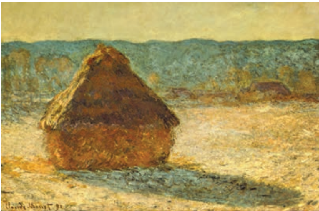
تصویر ۲-۲۲- اثر کلود مُنه، رنگ روغن روی بوم، (۶۵×۸۹ سانتی‌متر)

البته، همان‌طور که اشاره شد در بعضی از ساعات روز نیز رنگهای سرد و یا گرم غلبه می‌یابند. مُنه نقاش امپرسیونیست، در برخی از آثار خود از یک موضوع با زاویه واحد در ساعات مختلف روز نقاشی کشیده و با دقت خاصی، رنگهای هر ساعت را مورد توجه قرار داده است. او سایه‌ها را نه با خاکستری و سیاه بلکه با کمک مکملهای رنگی نشان داده است (تصاویر ۲-۲۲ و ۲-۲۳).