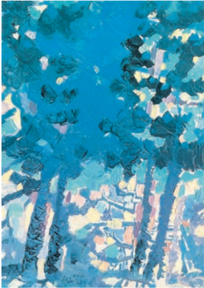
تصویر ۳۱-۲- اثر احمد اسفندیاری، 'رنگ روغن روی بوم'، (۵۰×۷۰ سانتی متر)