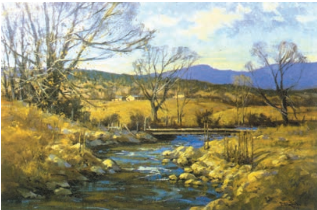
تصویر ۳۳-۲- اثر استریسیک ۱ ، رنگ روغن روی بوم، (۳۰×۴۱ سانتی متر)