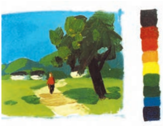
تصویر ۱۵-۲- رنگهای اصلی و ثانویه - سرد

در کار ملاحظه می‌کنید. نقاش، به سادگی به کمک درجات تیرگی و روشنی رنگ، سطوح عناصر تصویر نقاشی خود را از یکدیگر مجزا کرده است. شما درخت و کوهها و حتی پیکر انسان را در کار، با تفکیک ساده سطوح تیره روشن برای ایجاد حجم و نور و سایه می‌بینید.