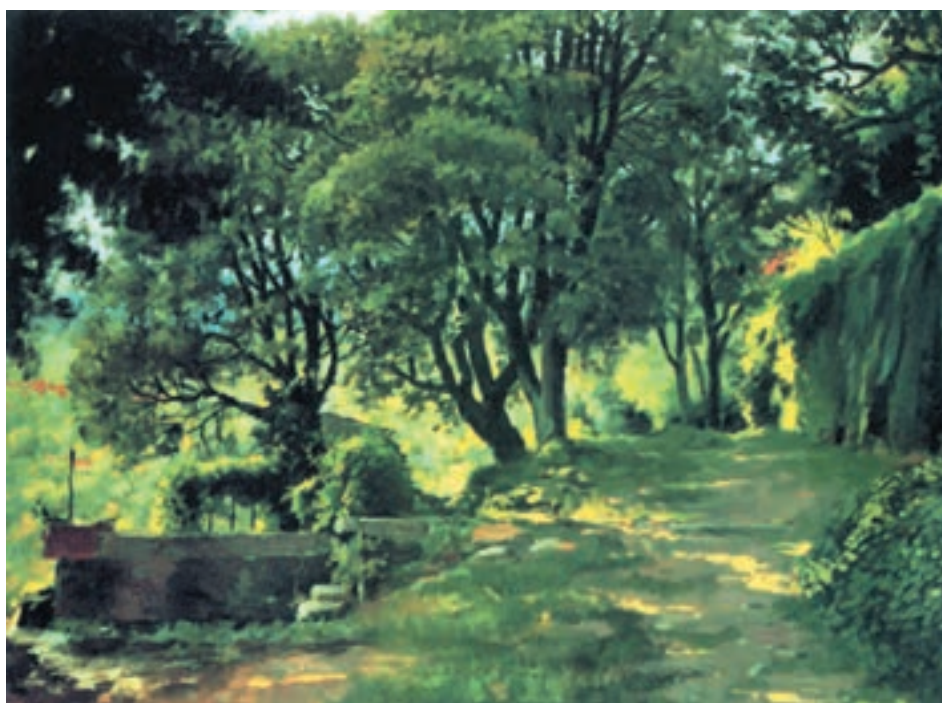
تصویر ۲۸-۲- اثر خوزه پارامون، رنگ روغن روی بوم، حاکمیت رنگ سرد

شما می‌توانید همانند تمرین قبل عمل کنید. منتهی این بار از مجموعه رنگهای خالص سرد در کنار رنگهای ترکیبی سرد بهره بگیرید. حتی مناطق گرم شما در نقاشی نیز با اندکی رنگ سرد ترکیب می‌شود (تصاویر ۲-۲۸ و ۲-۲۹).