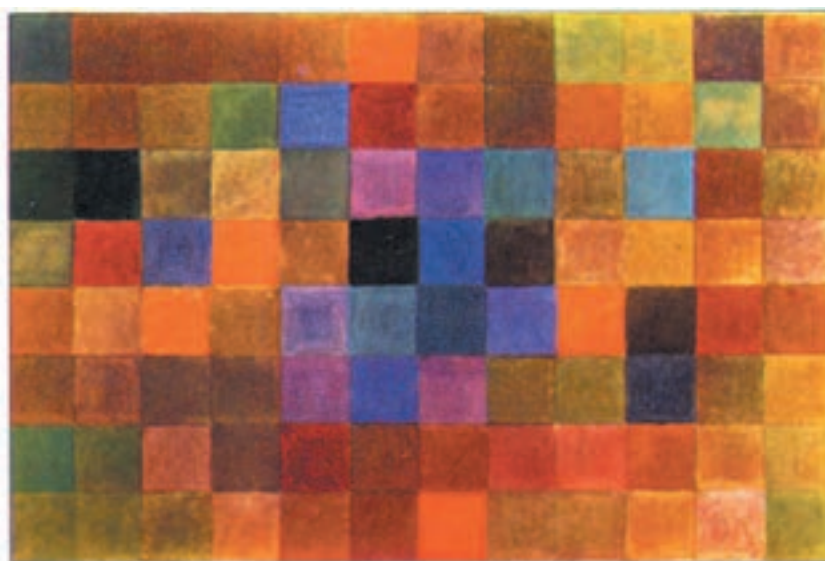
تصویر ۲-۲۰- پاییز