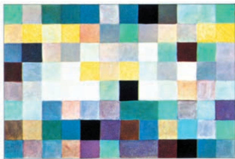
تصویر ۲-۲۱- زمستان