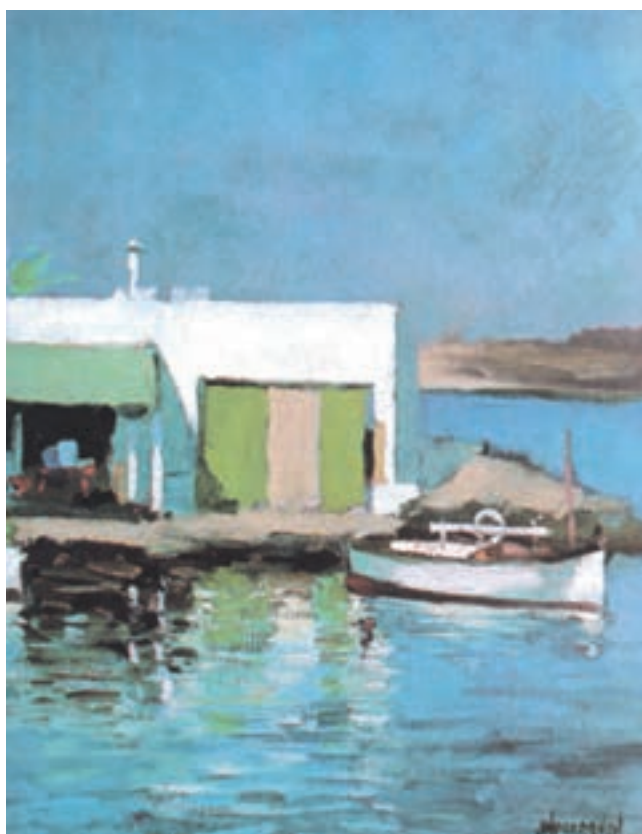
تصویر ۳۴-۲- اثر خوزه پارامون، رنگ روغن روی بوم