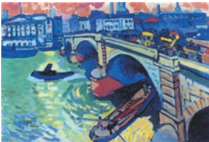
تصویر ۱۶-۲- اثر آندره دُرن، رنگ روغن روی بوم، (۶۶×۹۹ سانتی‌متر)

در تصویر (۱۶-۲) پل لندن اثر دُرن ۱ را با به‌کارگیری رنگهای اصلی و ثانویه به وضوح می‌بینید. نقاش به زیبایی، سطح تابلو را از عقب به جلو، به سطوح اصلی تقسیم‌بندی نموده و به کمک خط افق در نیمه بالایی تابلو، آسمان را از سطوح خانه‌ها جدا کرده است. او سپس، عناصر ساختمان را قرار داده و بعد از آن، رودخانه و پل و در نهایت، قایقها را طراحی کرده است. نقاش، از رنگهای آبی و سبز و بنفش در عناصر ساختمانی استفاده کرده و گاه، رنگهایش را به کمک سفید روشن نموده است. رنگ آب در نگاه اول سبز به نظر می‌رسد، اما نقاش، انعکاس نورهای خورشید را که در آسمان دور دست با نارنجی و زرد همراه است در پیش‌زمینه کار با ضربه قلمهای کوچک به روی رنگ سبز رودخانه، به زیبایی به کار برده است. او در سایه‌ها غالباً از آبی و بنفش استفاده کرده و بدین ترتیب، هماهنگی لازم را میان رنگهای سراسری تابلو برقرار نموده است. تصویر (۱۷-۲) نیز نمونه مفید دیگری برای این تمرین است.