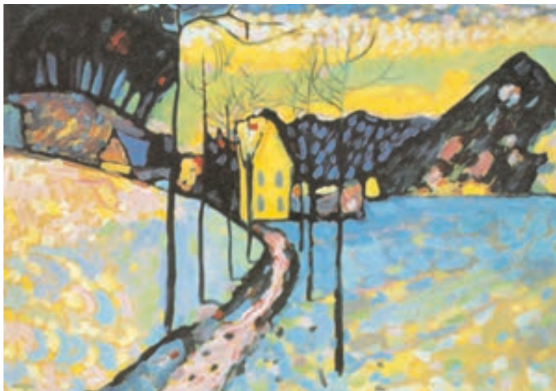
تصویر ۱۷-۲- اثر واسیلی کاندینسکی ۱ ، رنگ روغن روی چوب، (۷۱/۵×۹۷/۵ سانتی متر)