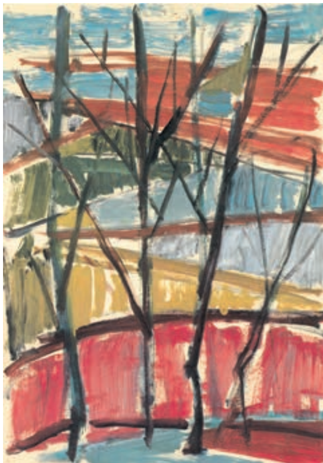
تصویر ۴۰-۲ اثر شکوه ریاضی ۱ ، رنگ روغن روی کاغذ، (۳۵×۵۰ سانتی متر)