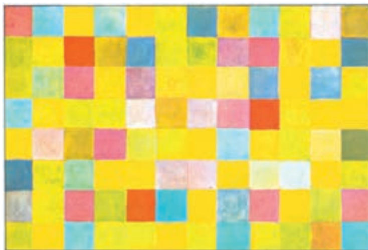
تصویر ۱۸-۲- بهار