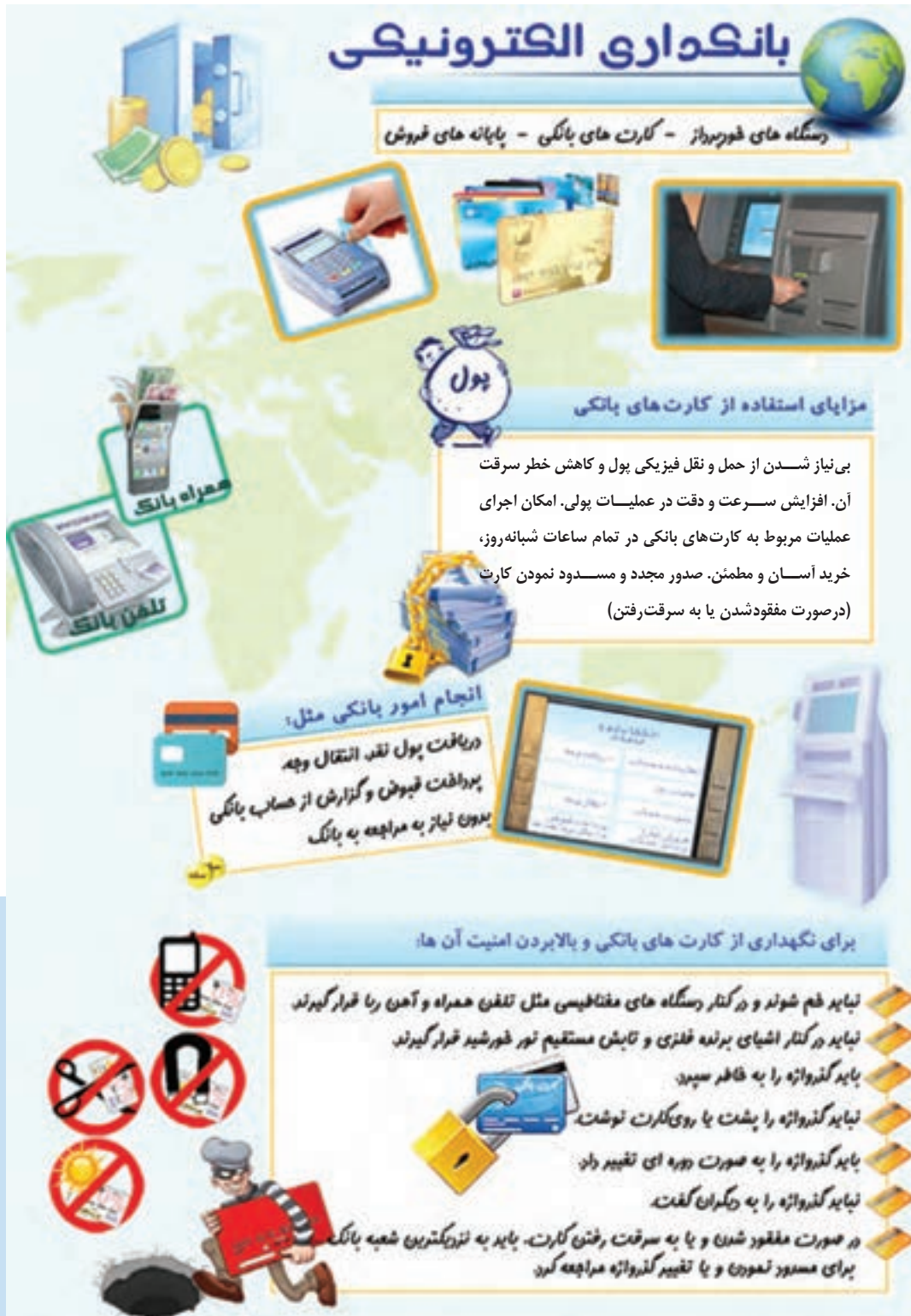
شکل ۱-۲- بانکداری الکترونیکی