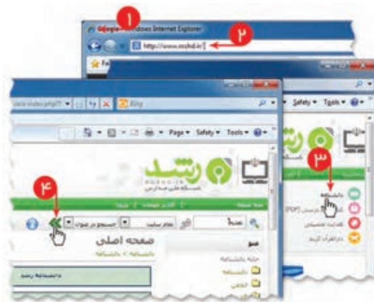
شکل ۷-۲- جست و جوی مطلب در وبگاه شبکه رشد

برای درک اهمیت تغذیه در دوران نوجوانی می‌توانید مطالب مفیدی از وبگاه شبکه رشد جمع‌آوری کنید. برای انجام این کار فیلم «جست‌وجو در وبگاه رشد» را مشاهده کنید.