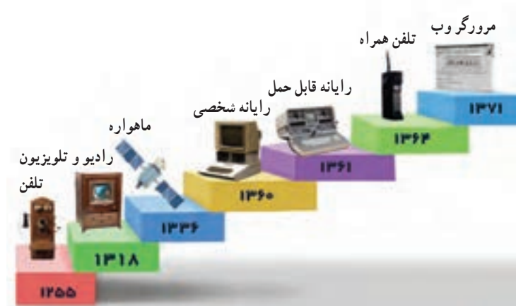
شکل ۲-۲- سیر تحول و تکامل فناوری اطلاعات و ارتباطات

فناوری اطلاعات و ارتباطات در گذر زمان تغییرات گسترده‌ای داشته است. شکل ۲-۲ برخی از تغییرات مهم را نشان می‌دهد.