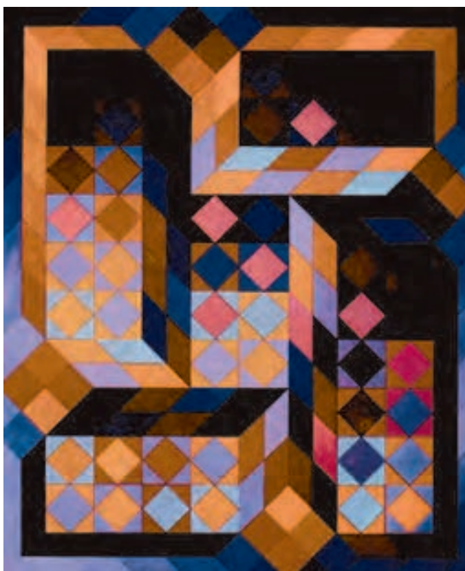
شکل ۸-۵- ویکتور وازارلی، ترکیب سه بُعدی. ترسیم شکل چهارگوش از زوایای مختلف در فضای بصری اثر ایجاد عمق کرده است.