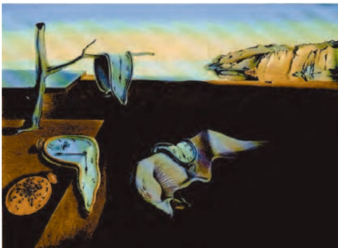
شکل ۱۴-۵- سالوادور دالی- پایداری حافظه، ۱۹۳۱ م. رنگ روغنی روی بوم، (۲۴/۱ × ۳۳ سانتی متر): در آثار نقاشان سوررئالیست ایجاد فضای وهمی بر اساس خواب ها و تصورات ضمیر ناخودآگاه صورت می گیرد.