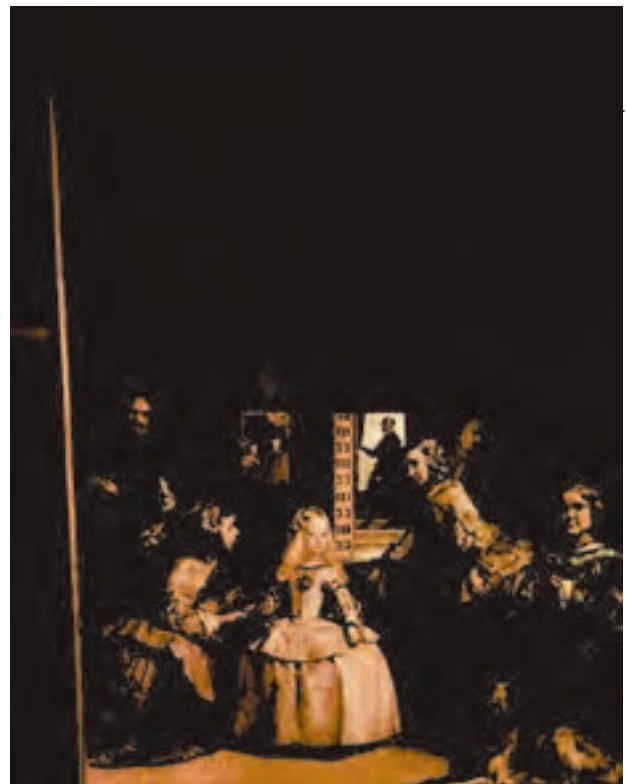
شکل ۳-۵- دیگو ولاسکز - ندیمه‌ها، ایجاد عمق فضایی با استفاده از تغییر وضوح