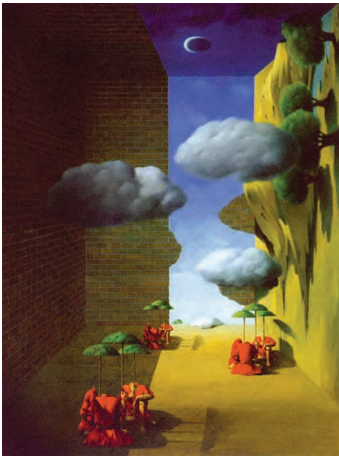
شکل ۱۵-۵- صادقی، علی اکبر؛ مأخذ: کتاب نمایشگاه، نگاه معنوی، ایجاد فضایی وهمی در اثر تلفیق فضاها و عناصر نامأنوس با یکدیگر