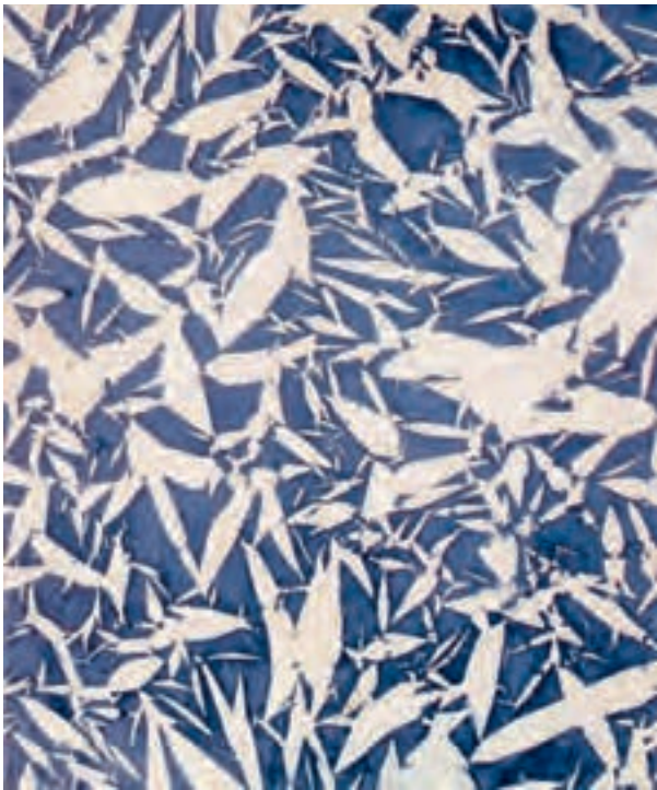
شکل ۴-۵- سیمون هانتایی، ترکیب؛ تغییر اندازه شکل‌های مشابه منجر به ایجاد عمق فضا در تصویر دو بُعدی شده است.

۳- تغییر وضوح: معمولاً هر چه اشیاء از ما دورتر می‌شوند وضوح خود را بیشتر از دست می‌دهند و ما دیگر آن‌ها را به روشنی مشاهده نمی‌کنیم. در این صورت عمق فضایی با تغییر وضوح از اشکال واضح به اشکال ناواضح تعیین می‌شود (شکل ۳-۵).