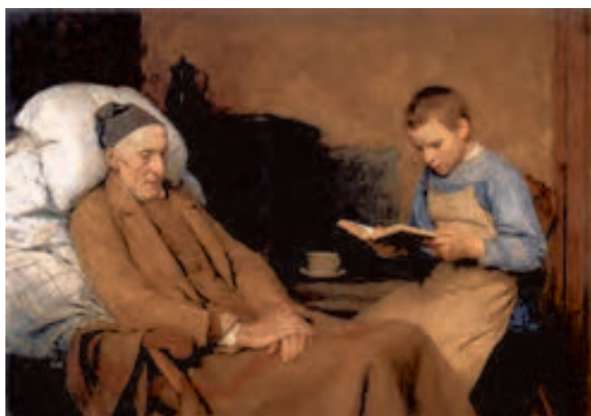
شکل ۲-۵- آلبرت آنکر، پیرمرد بیمار، ۱۸۹۳ م.، رنگ روغنی روی بوم، (۹۲ × ۶۳ سانتی متر)؛ ایجاد عمق فضایی با استفاده از تغییر درجه خلوص و تیرگی رنگ

۲- تغییر رنگ و تیرگی: در این روش برای نمایش دوری و نزدیکی اشکال و اشیاء از تغییر رنگ آن‌ها در فاصله دور نسبت به رنگ همان اشیاء در فاصله‌ی نزدیک و تغییر تیرگی-روشنی استفاده می‌شود. به این ترتیب که شدت و درجه‌ی خلوص رنگ در فاصله‌ی دور کاهش یافته و به خاکستری می‌گراید. به همین نسبت شدت تیرگی شکل‌ها و رنگ‌ها در فاصله‌های دور کاهش می‌یابد (شکل ۲-۵).