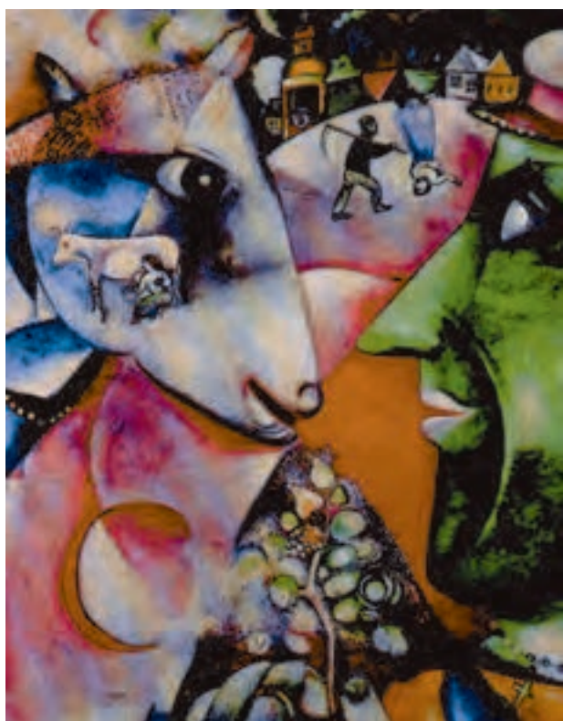
شکل ۹-۵- مارک شاکال - من و دهکده ام، ۱۹۱۱م. رنگ روغنی روی بوم (۱۵۱/۴ × ۱۹۲/۱ سانتی متر)؛ نمایش همزمان مکان‌های مختلف و اتفاقاتی که به طور موازی رخ می‌دهد فضایی گسترده‌تر از فضای واقع‌نما ایجاد می‌کند.

ج) فضای همزمان (تلفیقی): در برخی از آثار نمایش فضای تجسمی به صورت تلفیقی از فضا سازی واقع‌نما و دو بُعد نما صورت می‌گیرد. در این روش هنرمند بدون رعایت قواعد واقع‌نمایی در کل اثر، ساختار ترکیب خود را از مکان‌های مختلف به صورت موازی و به‌طور همزمان شکل می‌دهد. در عین حال سعی می‌کند با نمایش همزمان رویدادها در مکان‌های مختلف تلفیقی از فضا های داخلی و بیرونی به وجود آورد. به این ترتیب فضای تجسمی گسترش می‌یابد. در آثار نقاشی قدیم ایران این نحو از نمایش فضا به ایجاد یک فضای تجسمی گسترده برای روایت‌گری موضوعات داستانی کمک می‌کند. در هنر مدرن نیز نقاشان کوبیست کوشیدند با به نمایش گذاشتن اشیاء و مکان‌ها از چند زاویه دید مختلف زمان را در آثار خود به نمایش بگذارند. اما آن‌ها به این نگرش و شکستن شکل‌های واقع‌نما برای گریز از واقع‌نمایی، موضوع و روایت‌گری را تا حد زیادی در آثار نقاشان از میان بردند (شکل‌های ۵-۹ تا ۵-۱۱).