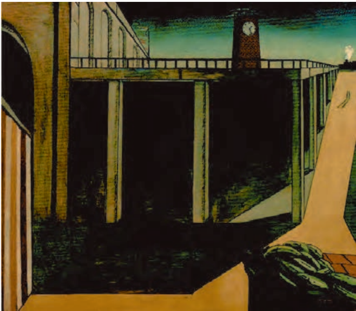
شکل ۱۲-۵- جورجو دکریکو، ایستگاه راه‌آهن مون پاراناس، ۱۹۱۴م. رنگ روغنی روی بوم، (۱۸۴/۵ × ۱۴۰ سانتی‌متر)؛ ایجاد فضای وهمی با استفاده از تمهیدات بصری مثل اغراق در نمایش عمق فضای بصری و نشان دادن ارتباط‌های نامأنوس میان اشیا در آثار دکریکو دیده می‌شود.

بسیار دیده می‌شود. نمایش این فضاها که جنبه‌ای خیالی و ذهنی دارد اگرچه توسط قوه‌ی خیال قابل تجسم است، اما در واقعیت و به‌طور طبیعی نمی‌تواند اتفاق بیفتد یا وجود داشته باشد. مثل ساعت‌هایی که ذوب شده و لخت هستند یا قطاری که از یک مکان خیالی و ناشناخته می‌گذرد، یا شیر و موجود درنده‌ای که بر خلاف طبیعت خود هیچ وحشت و اضطرابی ایجاد نمی‌کند (شکل‌های ۱۲-۵ تا ۱۵-۵).