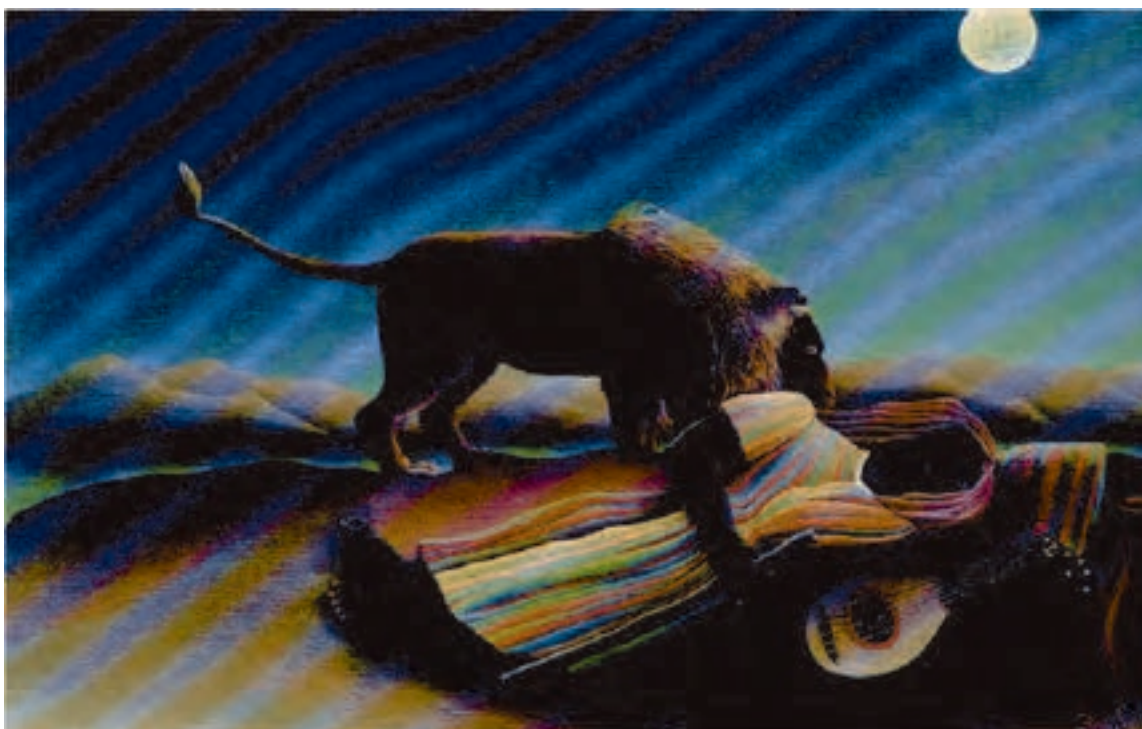
شکل ۱۳-۵- هانری روسو، کولی خفته، — ۱۸۹۷ م. رنگ روغنی روی بوم، (۲۰۰/۷ × ۱۲۹/۵ سانتی متر): در آثار هانری روسو نیز عموماً فضای وهمی بر اساس روابط نامأنوس میان عناصر جهان واقعیت شکل می گیرد.