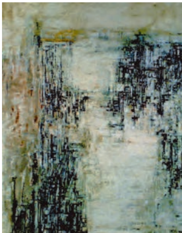
شکل ۵-۷- ماریا هلنا ویرا دوسیلوا، کارخانه برق، ۱۹۲۰م؛ تغییر وضوح و بافت شکل‌ها جهت ایجاد عمق فضایی