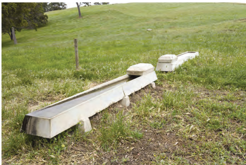
توزیع آبشخور در چراگاه