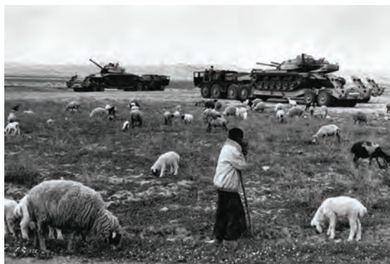
چرای گوسفند و بز در زمان دفاع مقدس

حرکت دسته‌جمعی گله گوسفند و بز در مناطق خاکی یا جاده‌های خاکی باعث ایجاد گرد و غبار و سرفه شدید دام می‌شود. بنابراین دام‌ها را از مناطقی حرکت دهید که فاقد گرد و غبار باشد یا آنها را در دسته‌های کوچک هدایت کنید، زیرا تنفس گرد و غبار سبب بیماری‌های تنفسی در انسان و دام می‌شود.