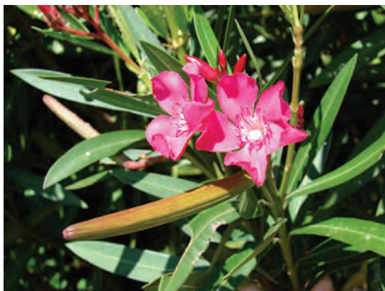
گیاه خرزهره: تمامی قسمت‌های آن ریشه تا گلبرگ برای انسان، گوسفند و بز بسیار سمی و کشنده است.

۴ چنانچه مقداری پودر استخوان به خوراک گوسفند و بز اضافه شود. تلفات ناشی از مسمومیت گیاهان سمی کاهش قابل توجه‌ای خواهد یافت.