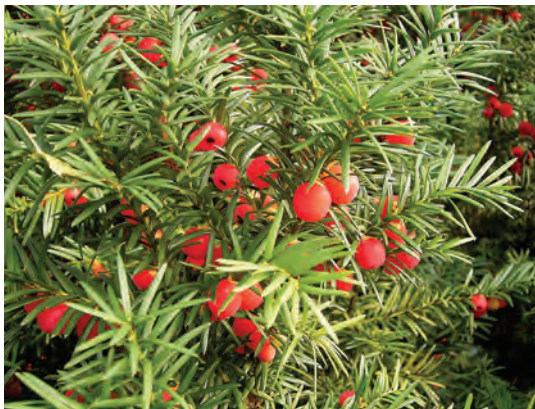
گیاه سرخدار: کشنده‌ترین گیاه سمی برای گوسفند است.

علوفه مراتع در محدوده مراکز صنعتی و به‌ویژه کارخانه‌های پالایش مواد شیمیایی ممکن است آلوده به فاضلاب مواد سمی باشد و موجب مسمومیت در گوسفند و بز شود.