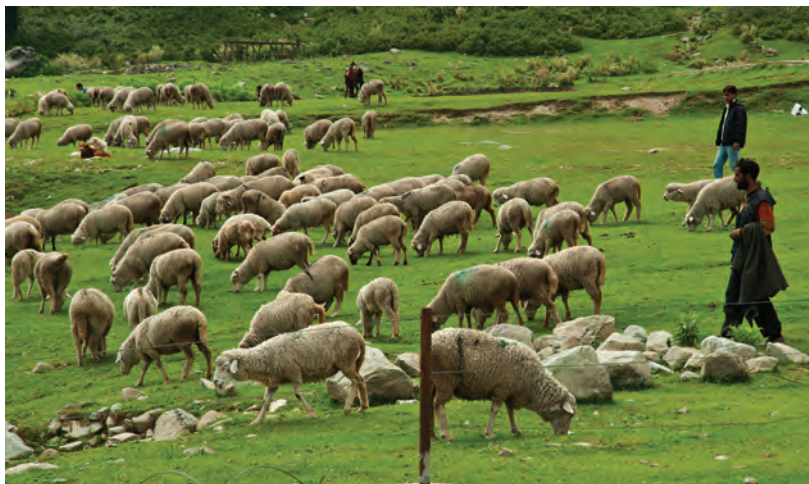
چرای گوسفند در مرتع

توزیع دام در چراگاه با توجه به پراکنش مناسب جایگاه‌های استراحت دام، محل قرار گرفتن آبشخورها و مانند آن قابل اجراست، زیرا حضور دام در اطراف آبشخور بسیار زیاد است و باعث نابودی مرتع اطراف آن می‌شود؛ لذا لازم است فواصل بین سایه‌بان‌های محل استراحت دام و آبشخور حداقل باشد تا دام برای رسیدن به آبشخور یک مسیر طولانی را طی نکند و باعث آسیب و فشار در بخش‌های دیگر مرتع نشود.