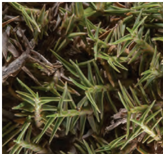
گیاه آلروپوس لیتورالیس