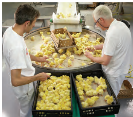
۲. انتقال جوجه‌ها به کارتن‌ها با استفاده از نوار نقاله

در فصول گرم سال در صورتی که درجه حرارت بالای ۲۱ درجه سانتی‌گراد باشد در کارتن‌ها ۸۰ قطعه جوجه و در صورتی که حرارت از ۲۱ درجه سانتی‌گراد پایین‌تر باشد ۱۰۰ قطعه جوجه را در