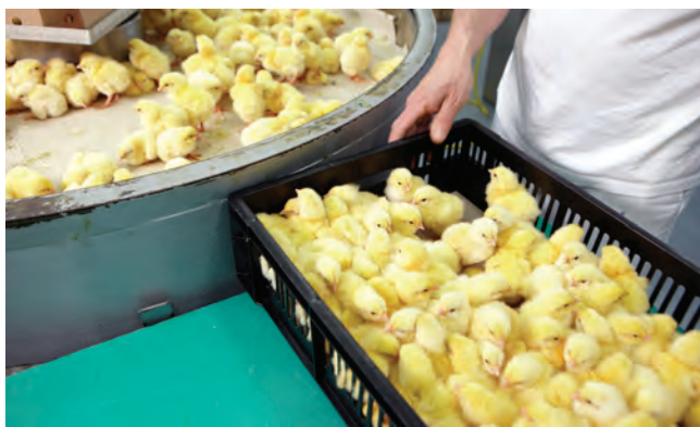
۱. انتقال جوجه‌ها به کارتن‌ها به صورت دستی