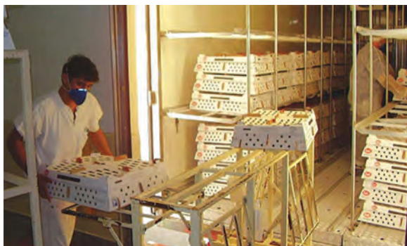
نحوه چیدن کارتن‌ها در ماشین حمل