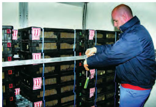
مهار شدن سبد جوجه‌ها در ماشین‌های حمل