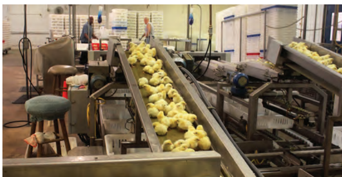
انتقال جوجه‌ها برای درجه‌بندی