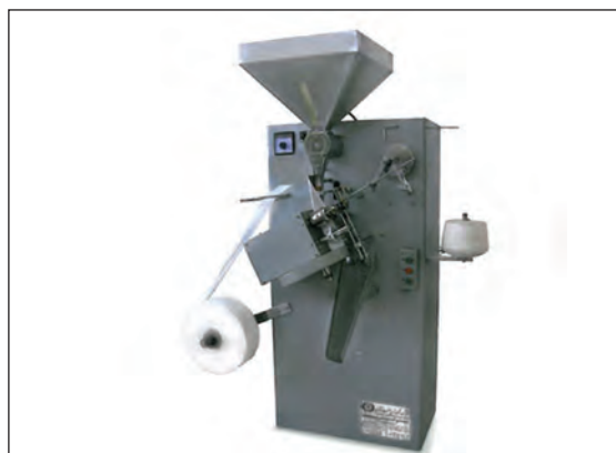
شکل ۵-۷- دستگاه بسته‌بندی چای کیسه‌ای

چند نوع آفت و جانور انباری را نام برده و بیماری‌های منتقل شده توسط آنها را بیان کنید.