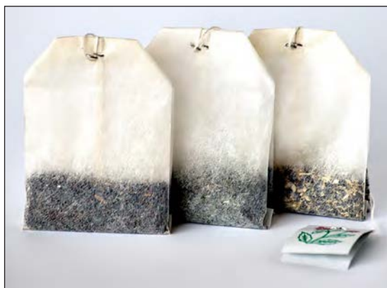
شکل ۵-۶- دمنوش کیسه‌ای