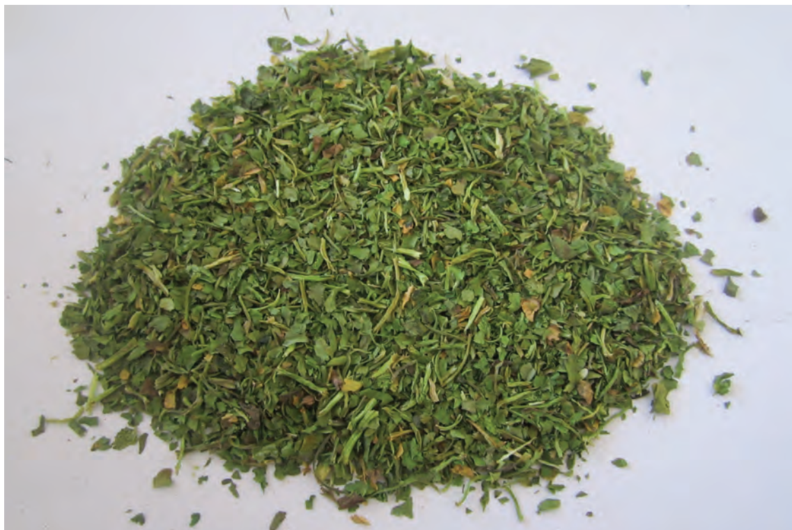
شکل ۵-۵- بررسی چشمی دمنوش‌های گیاهی