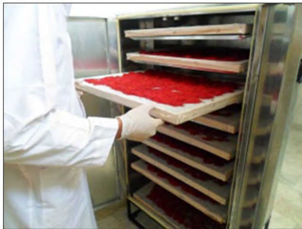
شکل ۵-۴- دستگاه خشک کن

در این مرحله، کنترل دما و میزان هوای ورودی و نیز ضخامت محصول دارای اهمیت است.