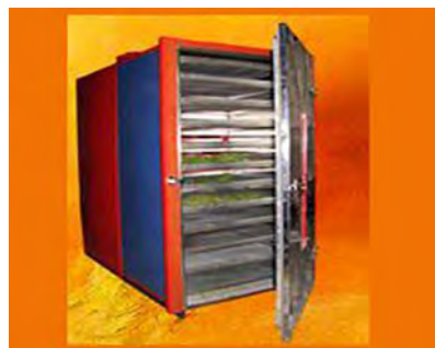
شکل ۱۱-۲- دستگاه خشک کن کابینتی