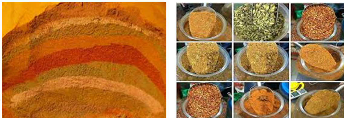
شکل ۲-۵- اختلاط ادویه‌ها

دو مورد از ادویه‌های ترکیبی فوق را انتخاب نموده و تحقیق کنید از چه اجزایی تشکیل شده‌اند؟