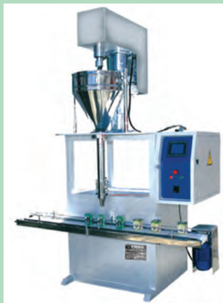
شکل ۲-۶- دستگاه بسته بندی ادویه