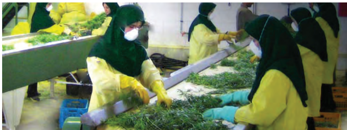
شکل ۲-۱۲- درجه بندی سبزی