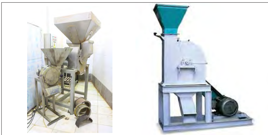
شکل ۲-۴ آسیاب ادویه

اصول درستکاری و امانت‌داری ایجاب می‌کند که به واسطه قیمت بالای ادویه‌ها تا حد امکان در حذف کامل ناخالصی‌ها تلاش شود.