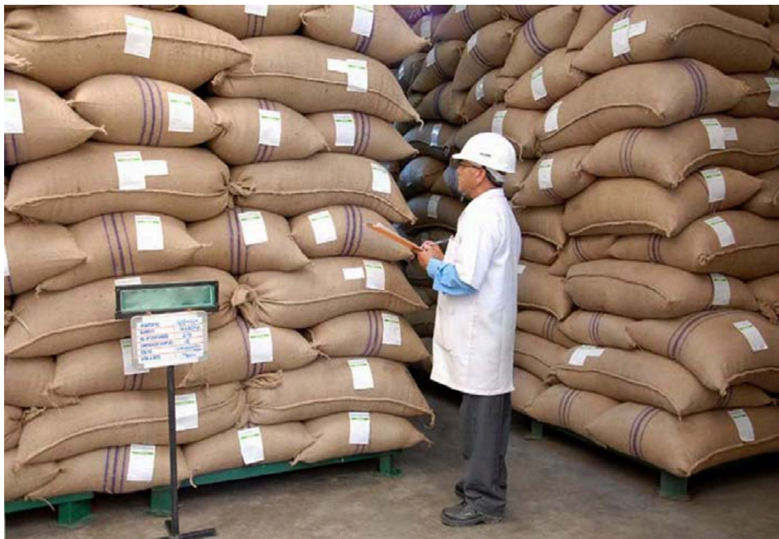
شکل ۲-۲- انبار نگهداری مواد اولیه

آزمون‌های فیزیکی: ویژگی‌های ظاهری ادویه‌ها براساس جدول زیر مورد ارزیابی قرار می‌گیرند.