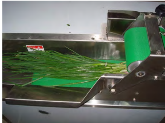
شکل ۲-۱۰- دستگاه خردکن سبزی