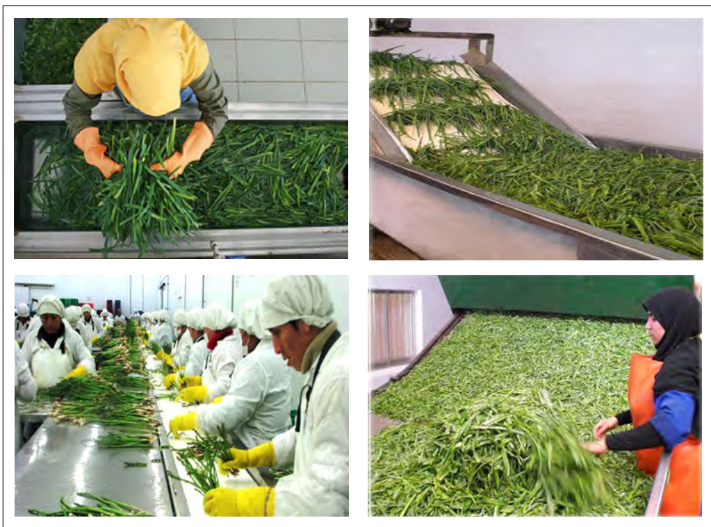
شکل ۹-۲- مراحل تمیز کردن سبزی

استفاده از آب فشان‌هایی که آب را در حجم کم و با فشار زیاد می‌پاشند؛ علاوه بر کاهش مصرف آب، سبب شست‌وشوی کارآمدتر می‌شود.