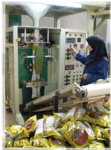
شکل ۲-۱۳- دستگاه بسته بندی سبزی