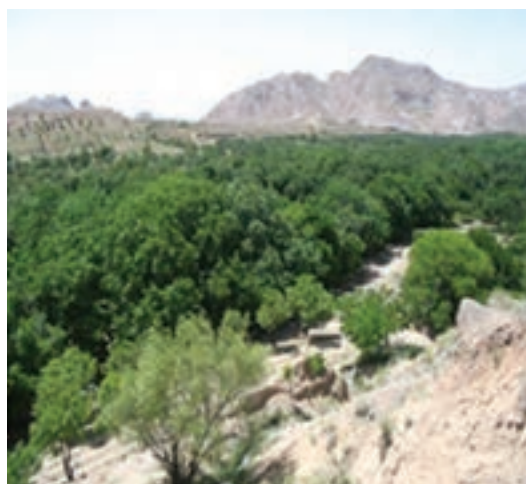
شکل ۲۰-۱۲- دره ییلاقی کریمو و مصعبی سرایان