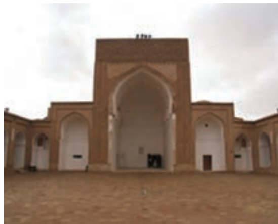
شکل ۳۴-۱۲- مسجد جامع فردوس

● منطقه نمونه گردشگری بوذرجمهر قاین : منطقه نمونه گردشگری بوذرجمهر با وسعتی حدود ۵۰۹ هکتار در ضلع شرقی شهر قاین واقع شده است که پیوند تنگاتنگی با پایتخت زعفران جهان و کانون شهری دیرینه و پایدار سرزمین قهستان و فرهنگ و تمدن کهن دارد.