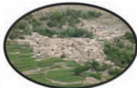
شکل ۱۵-۱۲- روستای آرک شهر خوسف

این منطقه در شهرستان درمیان در ۷۰ کیلومتر محور بیرجند - درمیان - زیرکوه واقع شده است و یکی از قدیمی ترین نقاط استان خراسان جنوبی محسوب می شود. اهمیت آن بیشتر از لحاظ جاذبه های تاریخی و فرهنگی است؛ هرچند دارای مناطق ییلاقی با درختان و باغات سرسبز می باشد و روستاهای هدف گردشگری درمیان و فورگ در مسیر جاده اسدیه به سریشنه و بیرجند واقع شده است.