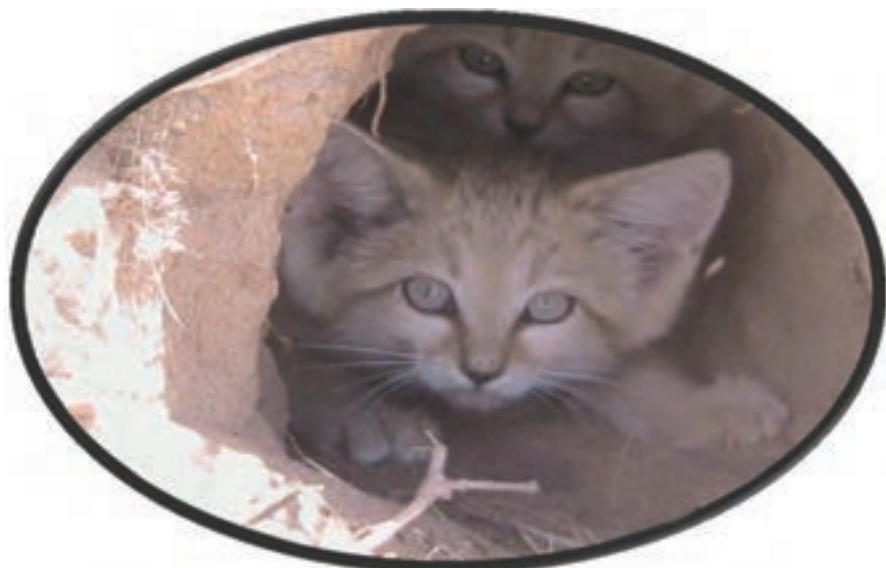
شکل ۲۵-۱۲- گریه شنی در حال انقراض شهرستان زیرکوه

● روستاهای هدف گردشگری چنشت و ماخونیک در سریشیه: روستای هدف گردشگری چنشت در ۳۵ کیلومتری شهر مود واقع شده است و از نظر جاذبه‌های طبیعی و تاریخی - فرهنگی اهمیت خاصی دارد اما روستای ماخونیک در محور سریشیه به دُرح قرار دارد. و بیشتر از اهمیت تاریخی برخوردار است.