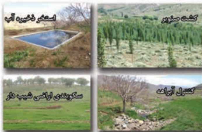
شکل ۵-۶- مهم ترین دستاوردهای بخش منابع طبیعی