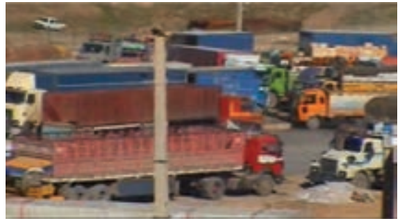
شکل ۶-۱- بازارچه مرزی پرویزخان

در دهه اول پس از انقلاب اسلامی، سرعت توسعه در بخش‌های زیربنایی و عمرانی استان کرمانشاه مانند دیگر استان‌های واقع در غرب کشورمان، به دلیل موقعیت مرزی و تأثیر مستقیم از جنگ تحمیلی، روند کندی داشت. اما در دهه‌های بعدی روند حرکت سرعت بیشتری یافته است. نمود این تحولات در استان را می‌توان در بخش‌های مختلف اقتصادی و زیربنایی مشاهده کرد. در این درس به‌طور گذرا مهم‌ترین این دستاوردها در بخش‌های مختلف بررسی می‌شود: