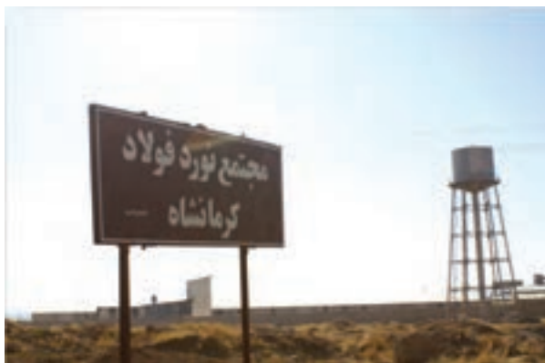
شکل ۷-۶- مجتمع نورد فولاد کرمانشاه