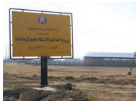
شکل ۶-۶- پالایشگاه نفت آنارک کرمانشاه