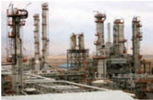
شکل ۶-۲- مجتمع پتروشیمی کرمانشاه