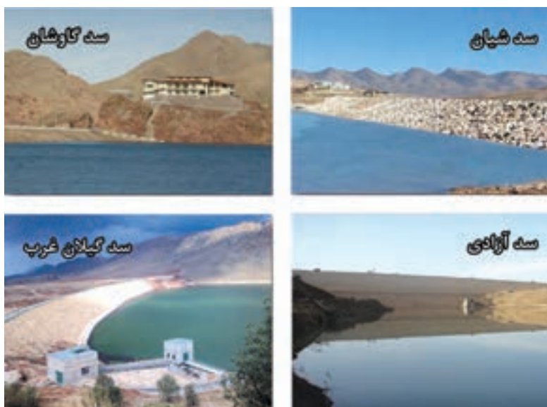
شکل ۳-۶- نمایی از برخی از سدهای استان کرمانشاه