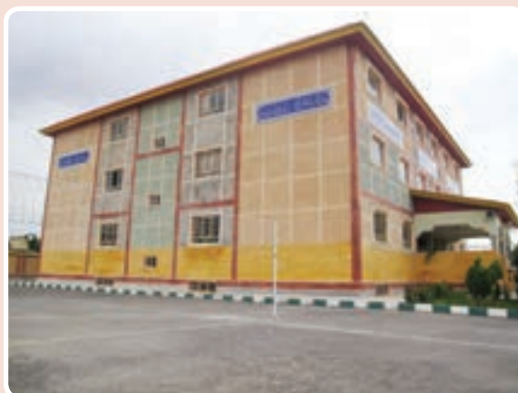
شکل ۱۲-۱۴- مدارس

جدول ۱۳-۱۴- تعداد دانش‌آموزان و کارکنان آموزشی کلیه مقاطع تحصیلی ۹۲-۱۳۹۱