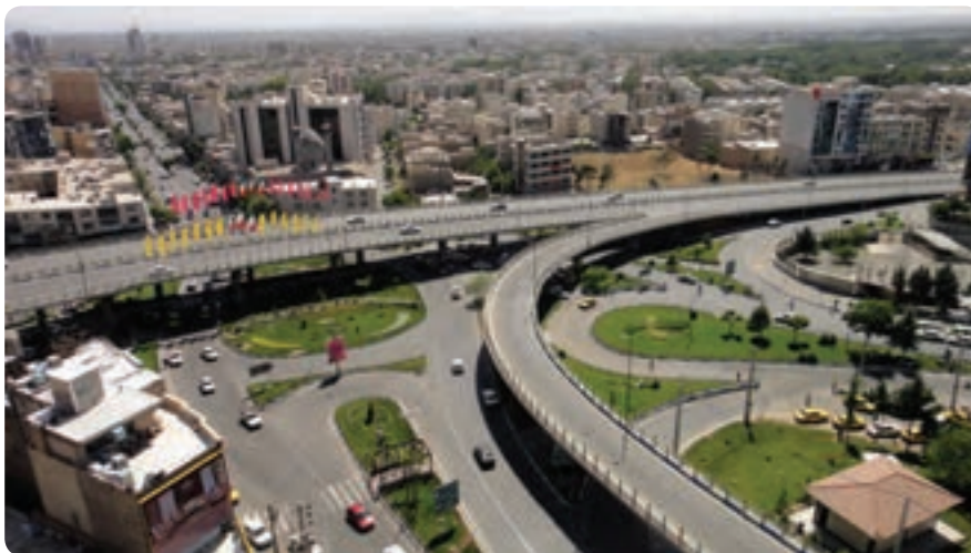
شکل ۴-۱۴- پل‌های روگذر آزادگان نمونه‌ای از فعالیت‌های عمرانی استان

فعالیت‌های عمرانی استان به سه بخش تقسیم می‌شوند: ۱- عمران شهری ۲- عمران روستایی ۳- راه و ترابری و حمل و نقل. ۱- عمران شهری: فعالیت‌ها و دستاوردهای عمرانی بسیاری (در زمینه تهیه طرح‌های تفضیلی و هادی، خدمات شهری، افزایش و اصلاح راه‌های ارتباط درون شهری و سایر تأسیسات زیربنایی) موجب پیشرفت و توسعه شهرهای استان شده است.