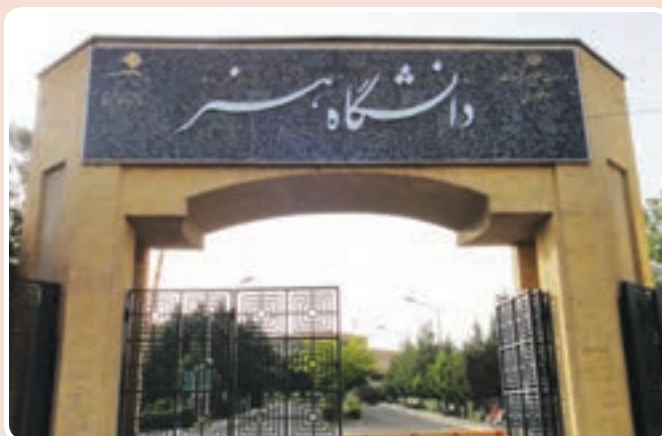
شکل ۱۴-۱۴- دانشگاه هنر - کرج

۳- مراکز فرهنگی: کانون‌های آموزش قرآن، کانون‌های پرورش فکری کودکان و نوجوانان، فرهنگ سراها و کتابخانه‌ها به ویژه کتابخانه نابینایان حاصل تلاش مسئولان در جهت گسترش مراکز فرهنگی است. تأسیس رادیو البرز - خبرگزاری‌ها، چاپخانه‌ها، سینماها، انتشار مطبوعات محلی، برپایی نمایشگاه‌ها و... نیز از اقدامات فرهنگی استان محسوب می‌شوند.