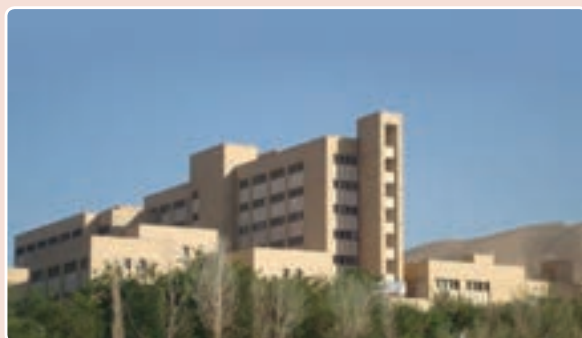
شکل ۱۶-۱۴- بیمارستان تخصصی البرز