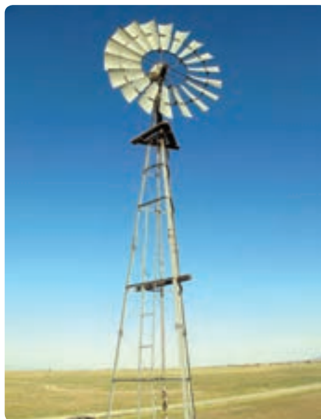
شکل ۱۸-۱۴ استفاده از انرژی‌های نو