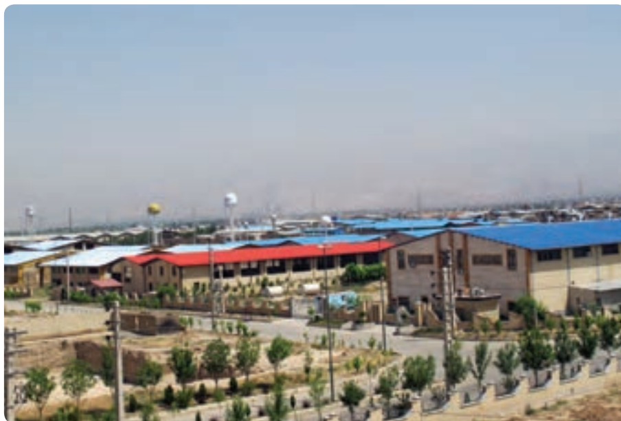
شکل ۲-۱۴- شهر صنعتی نظرآباد

استان البرز پس از پیروزی انقلاب بیش از پیش چهره صنعتی به خود گرفت و شهرک‌های صنعتی و واحدهای تولیدی بسیاری در آن احداث شد. در سال‌های اخیر به دنبال ممنوعیت تأسیس کارگاه‌های صنعتی در تهران، بخش‌هایی از استان برای احداث شهرک‌های صنعتی مورد توجه قرار گرفت که بسیاری از آن‌ها به مرحله بهره‌برداری رسیده است و تعدادی دیگر در حال تکمیل است. اشتغال‌زایی و افزایش تولیدات داخلی از نتایج ایجاد این شهرک‌های صنعتی می‌باشد.