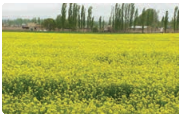
شکل ۱۴-۱- تغییر شیوه‌های سنتی و تبدیل آن به کشت‌های جدید