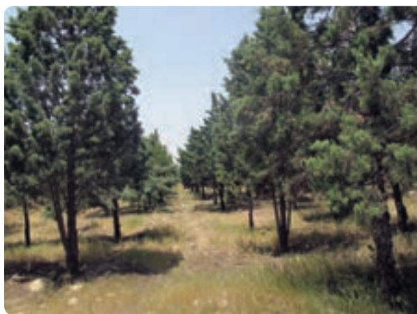
شکل ۱۹-۱۴ مهار آب‌های سطحی و جنگل‌های دست کاشت