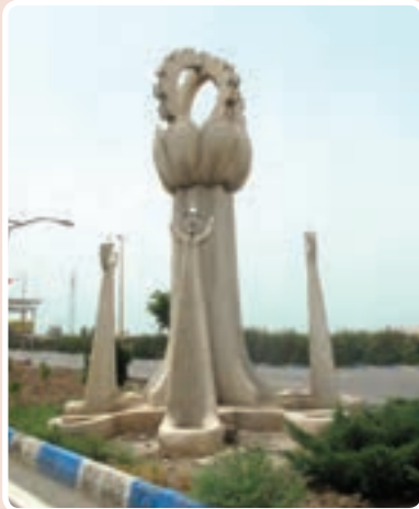
شکل ۳-۱۴- ورودی شهرک صنعتی اشتهارد

شهرک صنعتی اشتهارد: این شهرک به علت دسترسی به راه‌های ارتباطی و زمین‌های بایر و وسیع در مسیر جاده اشتهارد- بومین زهرا مکان‌یابی شد و در حال حاضر با داشتن ۵۲۵ واحد صنعتی فعال (فلزی- غذایی- شیمیایی و...) از اصلی‌ترین مناطق صنعتی کشور محسوب می‌شود.