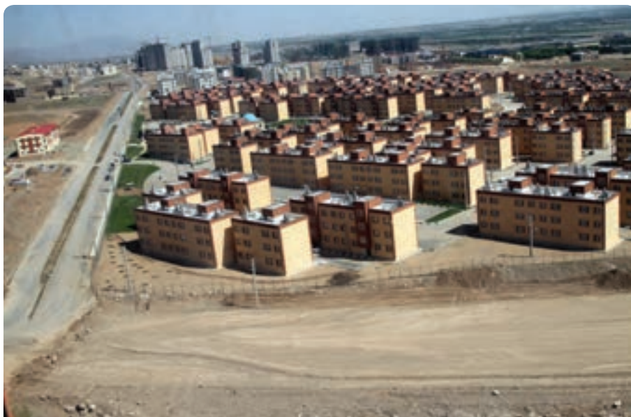
شکل ۱- ۱۵- مسکن مهر