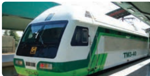
شکل ۸-۱۴- نمونه‌هایی از فعالیت‌های ساخت و ساز در مترو