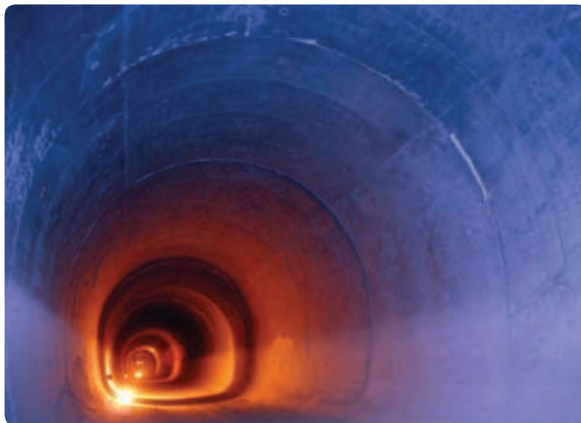
شکل ۲- ۱۵- توسعه مترو راه حلی برای ترافیک و حمل و نقل عمومی

برای کنترل و ساماندهی مهاجرت به استان و افزایش اشتغال، چه اقداماتی می‌توان انجام داد؟