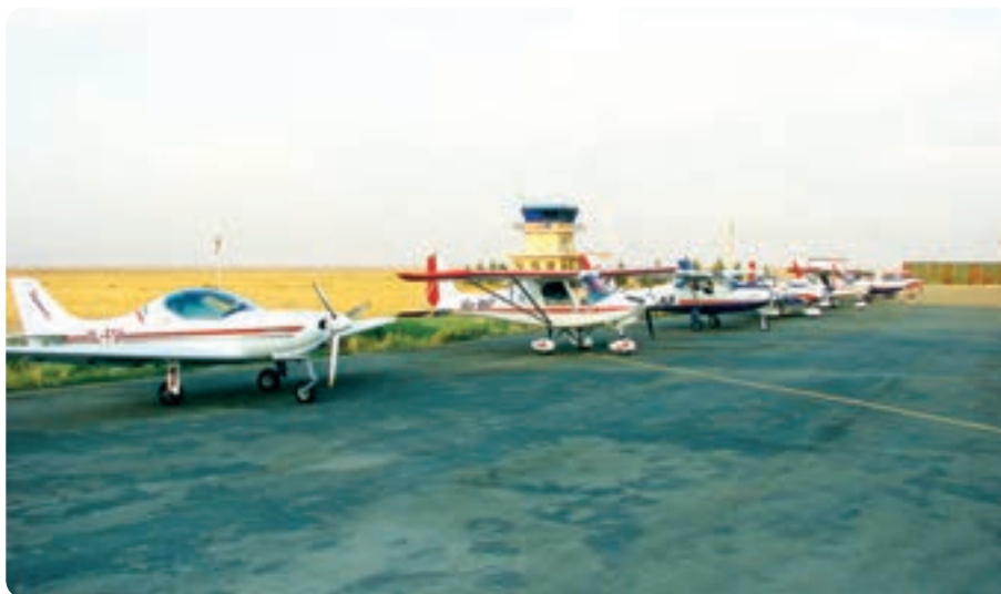
شکل ۱۱-۱۴- فرودگاه آزادی - نظرآباد

✱ فرودگاه آزادی: این مجتمع فرودگاهی سال ۱۳۷۹ در شرق روستای صالحیه شهرستان نظرآباد افتتاح شد. مهم‌ترین اهداف احداث این فرودگاه تربیت نیروی انسانی در زمینه طراحی و ساخت هواپیماهای کوچک و آموزش هوانوردی است.