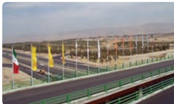
شکل ۷-۱۴- راه‌های استان