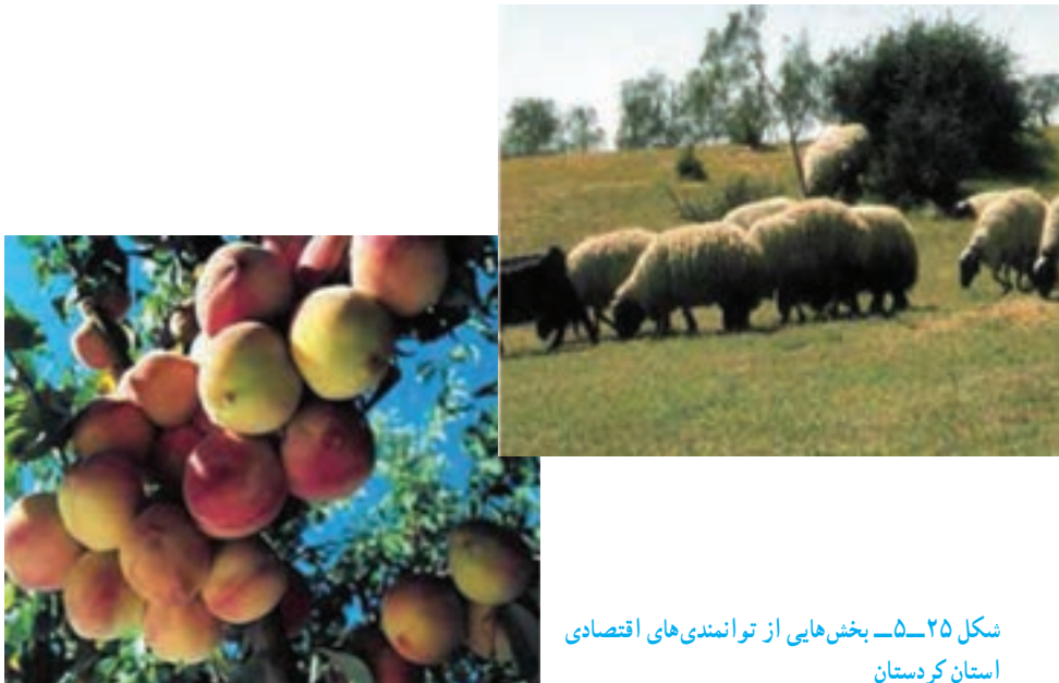
شکل ۲۵-۵. بخش‌هایی از توانمندی‌های اقتصادی استان کردستان

* به شکل‌های زیر نگاه کنید و بگویید که مهم‌ترین توانمندی‌های اقتصادی استان ما چیست؟