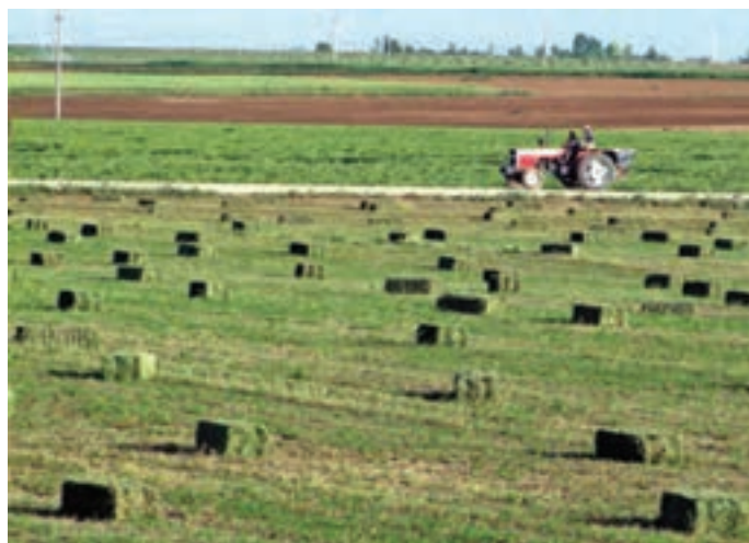
شکل ۳۰-۵ تولید علوفه یکی از توان‌های بخش کشاورزی استان

فرآورده‌های دامی استان: فرآورده‌های دامی مانند: گوشت قرمز، شیر، پنیر، و محصولات فرعی نظیر چرم و پوست، موهر و گُرک از جمله محصولات مهم استان به شمار می‌روند. گُرک بز مرخز کردستان بسیار مرغوب است و در تولید انواع لباس و صنایع دیگر از آن استفاده می‌شود. بز مرخز که خاستگاه آن استان کردستان است، شهرت جهانی دارد. یکی دیگر از دام‌های اصیل استان کردستان، اسب کُردی است.