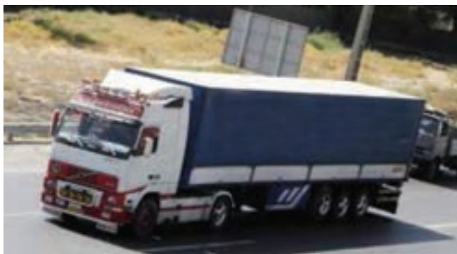
شکل ۳۷-۵ حمل و نقل جاده‌ای یکی از توانمندی‌های استان

● حمل و نقل: موقعیت مناسب جغرافیایی ناشی از استقرار بر محور شمال غربی - جنوب غربی کشور و هم مرزی با کشور عراق و امکان توسعه مبادلات با این کشور، شرایط مناسبی را برای گسترش حمل و نقل و استفاده از آن به عنوان یکی از مزیت‌های استان کردستان فراهم کرده است. استان کردستان به عنوان حلقه اتصال جنوب و جنوب غربی ایران با مناطق شمال غرب کشور شناخته می‌شود. طول راه‌های اصلی استان ۳۲۰ کیلومتر و طول راه‌های فرعی آسفالت‌ه ۱۲۴۷ کیلومتر است.