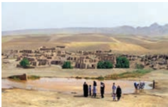
شکل ۵-۶- چشمه آب معدنی باباگرگر و بقعه امامزاده سیدجلال الدین در جوار آن