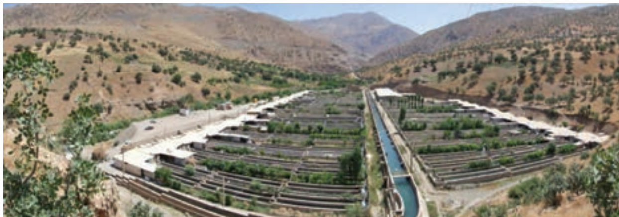
شکل ۳۱-۵ مجتمع پرورش ماهی سردآبی پالنگان