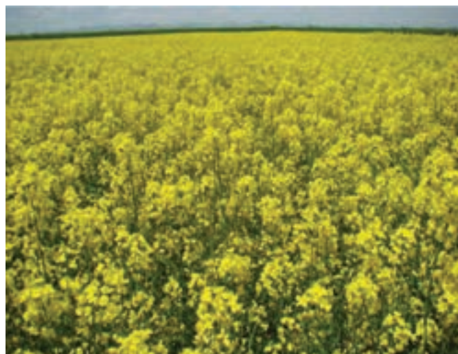
شکل ۲۸-۵- مزرعه کلزا