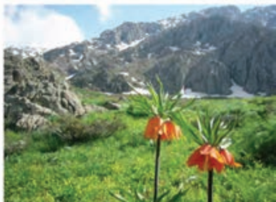
شکل ۵-۳- برخی از جاذبه‌های طبیعی استان

استان کردستان از جاذبه‌های طبیعی فراوانی برخوردار است که هر کدام به تناسب فصول مختلف سال جلوه‌های زیبای خود را در مقابل دیدگان گردشگران می‌گشایند. هریک از شهرستان‌ها و مناطق استان از چند جاذبه طبیعی زیبا مانند آبشار، سراب، غار و ... برخوردار است که در این جا به برخی از مهم‌ترین آن‌ها اشاره می‌شود.