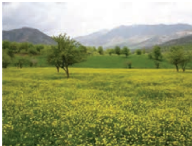
شکل ۹-۵- نمایی از طبیعت شهرستان بانه