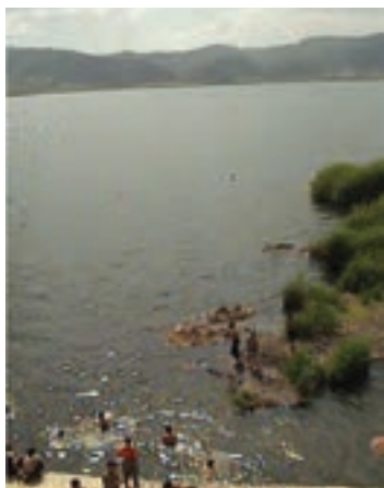
شکل ۴-۵- دریاچه زریبار مریوان

● دریاچه زریبار : این دریاچه که مهم‌ترین جاذبه طبیعی گردشگری استان کردستان است، در غرب شهر مریوان واقع شده و شرق و غرب آن را دو رشته کوه پوشیده از جنگل‌های بلوط در بر گرفته است. در شمال و جنوب آن نیز، دشت‌های سرسبز بیلو و مریوان واقع شده‌اند. این دریاچه در هر فصل، چشم‌اندازهای زیبایی به نمایش می‌گذارد و شرایط مناسبی را برای گردش و تفریح در طبیعت پیرامون آن، قایقرانی، ماهی‌گیری، شنا، شکار و ... در اختیار گردشگران قرار می‌دهد. یکی از جالب‌ترین چشم‌انداز گردشگری زریبار، یخبندان سطح دریاچه در فصل زمستان است که امکان تفریح، گشت و گذار و اسکی بر روی آن را برای علاقه‌مندان فراهم می‌آورد.