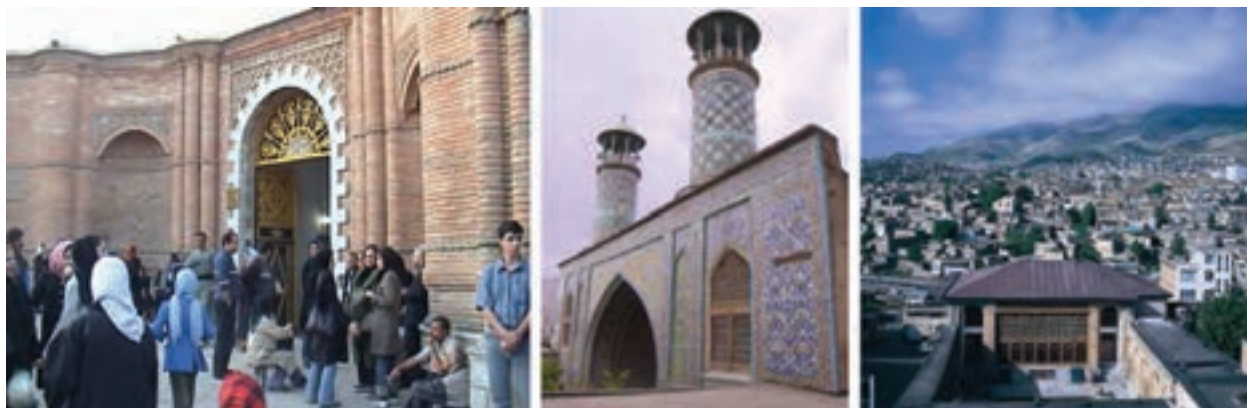
شکل ۱۰-۵- بخشی از آثار و جاذبه‌های تاریخی و فرهنگی - مذهبی استان

* آیا می‌دانید که استان کردستان یکی از کانون‌های فرهنگ و تاریخ کشور ماست و دارای آثار فراوانی در این زمینه است؟