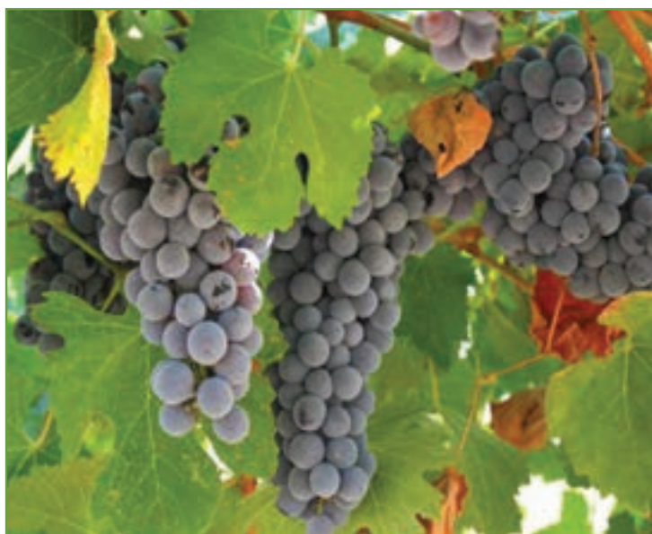
شکل ۲۹-۵- توت فرنگی و انگور دیم از محصولات عمده کشاورزی استان

● دامپروری : دامپروری از فعالیت‌های بسیار کهن در استان کردستان محسوب می‌شود که از دیر باز بسیاری از ساکنان روستاها و حتی شهرها بدان مشغول بوده‌اند. با توجه به وجود ۱۷۲۰۰۰۰ هکتار جنگل و مرتع در استان کردستان، این استان یکی از مناطق عمده دامپروری کشور است. استان ما دارای ۳/۵ میلیون واحد دامی، معادل ۴/۹ درصد دام‌های کشور است. در این استان،