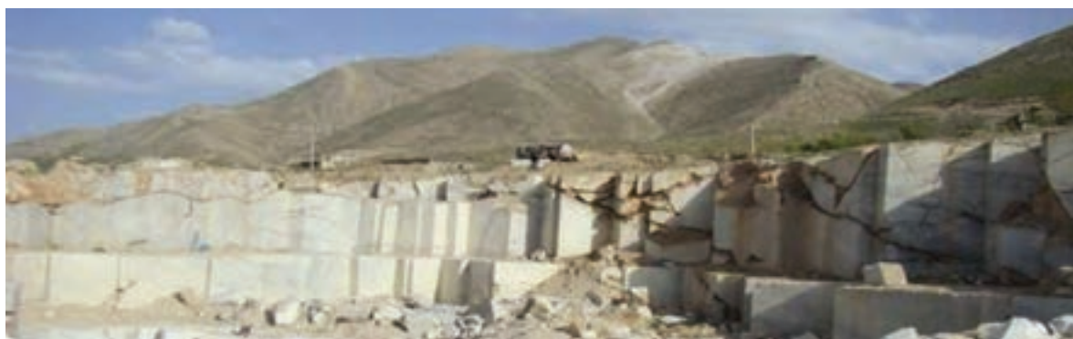
شکل ۳۶-۵ ذخایر معدنی یکی از توانمندی‌های استان

استان کردستان با ۱۹۹ معدن فعال، ذخیره قطعی ۳۸۶ میلیون تن و استخراج سالیانه ۴/۵ میلیون تن مواد معدنی یکی از قطب‌های معدنی کشور محسوب می‌شود. این استان از نظر تنوع و میزان کانسارهای معدنی بسیار غنی است؛ به طوری که ذخیره و منابع معدنی شناسایی شده و در حال بهره‌برداری استان، بسیار فراوان است و موارد مهم آن عبارت‌اند از: سنگ آهن، طلا، سیلیس، فلدسپات، خاک صنعتی، میکا، انواع سنگ‌های تزئینی، سنگ آهک، نمک، پوکه معدنی، سنگ گچ و ... .