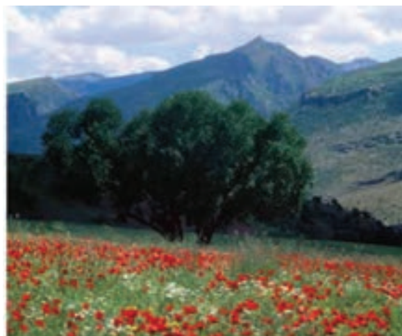
شکل ۵-۷- چشم اندازهای طبیعی و فرهنگی هه‌ورامان