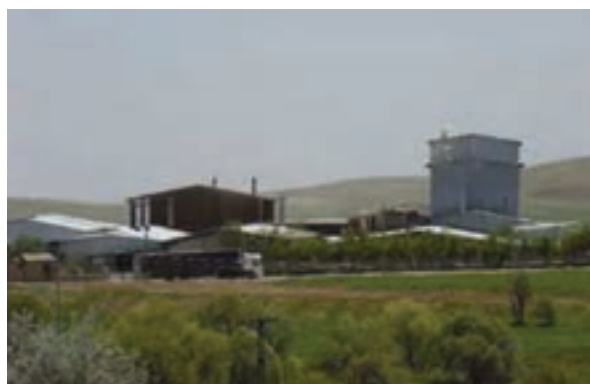
شکل ۳۴-۵ کارخانجات کاشی کسری