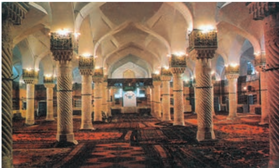
شکل ۲۲-۵- شبستان مسجد جامع سنندج