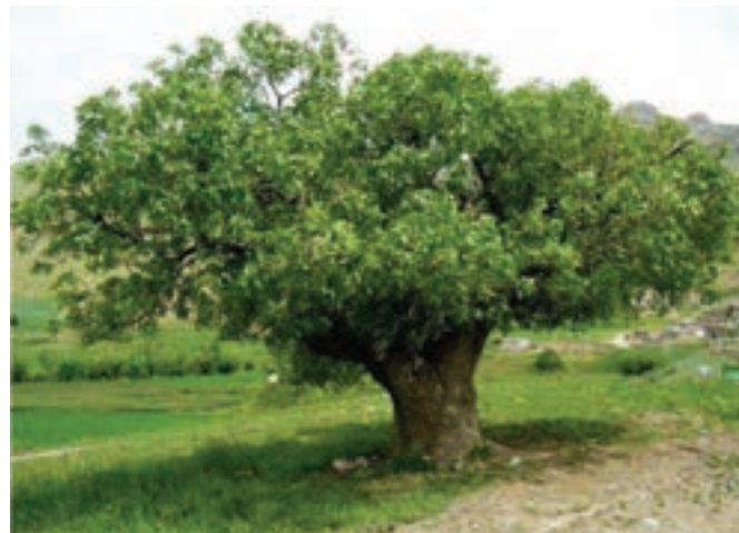
شکل ۲۷-۵- درخت بنه

قابلیت توسعه باغداری از دیگر توانمندی‌های بخش کشاورزی استان ماست. از میان محصولات کشاورزی و باغی کردستان ۱۰ محصول به ترتیب اولویت در زمینه میزان تولید، سرمایه‌گذاری و صادرات از سایر محصولات برجسته‌ترند که عبارت‌اند از: توت‌فرنگی، گردو، انگور، زردآلو، هلو، شلیل، سیب، بادام، به، گیلان و آلبالو. در استان کردستان گیاهان دارویی و صنعتی و میوه‌های نسبتاً منحصر به فرد (توت‌فرنگی و انگور دیم) تولید می‌شود، به طوری که استان ما بالاترین میزان برداشت توت‌فرنگی در سطح کشور را دارد. گذشته از آن با توجه به برخورداری استان کردستان از شرایط مناسب کشت چغندر قند، دانه‌های روغنی و درختان بنه، هم‌چنین فراوانی بوته‌گون، شیرین بیان و تنوع سایر گیاهان دارویی، می‌توان به ایجاد صنایع تبدیلی مرتبط با این محصولات اقدام کرد.