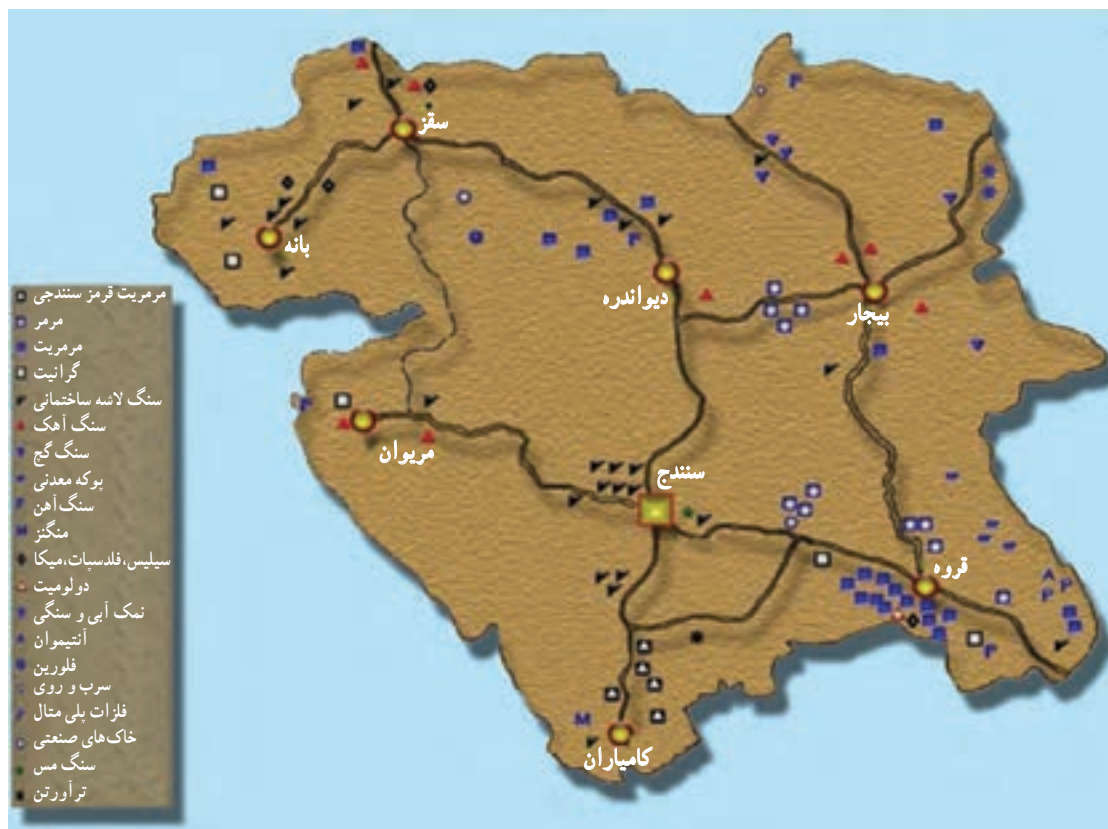
شکل ۳۵-۵ نقشه پراکندگی معادن مهم استان

استان کردستان با ۱۹۹ معدن فعال، ذخیره قطعی ۳۸۶ میلیون تن و استخراج سالیانه ۴/۵ میلیون تن مواد معدنی یکی از قطب‌های معدنی کشور محسوب می‌شود. این استان از نظر تنوع و میزان کانسارهای معدنی بسیار غنی است؛ به طوری که ذخیره و منابع معدنی شناسایی شده و در حال بهره‌برداری استان، بسیار فراوان است و موارد مهم آن عبارت‌اند از: سنگ آهن، طلا، سیلیس، فلدسپات، خاک صنعتی، میکا، انواع سنگ‌های تزئینی، سنگ آهک، نمک، پوکه معدنی، سنگ گچ و ... .