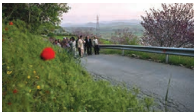
شکل ۵-۵- بازدید رهبر معظم انقلاب اسلامی از پارک کوهستانی آبیدر سنندج

● دریاچه زریبار : این دریاچه که مهم‌ترین جاذبه طبیعی گردشگری استان کردستان است، در غرب شهر مریوان واقع شده و شرق و غرب آن را دو رشته کوه پوشیده از جنگل‌های بلوط در بر گرفته است. در شمال و جنوب آن نیز، دشت‌های سرسبز بیلو و مریوان واقع شده‌اند. این دریاچه در هر فصل، چشم‌اندازهای زیبایی به نمایش می‌گذارد و شرایط مناسبی را برای گردش و تفریح در طبیعت پیرامون آن، قایقرانی، ماهی‌گیری، شنا، شکار و ... در اختیار گردشگران قرار می‌دهد. یکی از جالب‌ترین چشم‌انداز گردشگری زریبار، یخبندان سطح دریاچه در فصل زمستان است که امکان تفریح، گشت و گذار و اسکی بر روی آن را برای علاقه‌مندان فراهم می‌آورد.