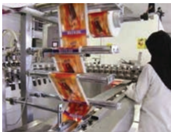
شکل ۳۲-۵ گوشه‌هایی از فعالیت‌های صنعتی در استان