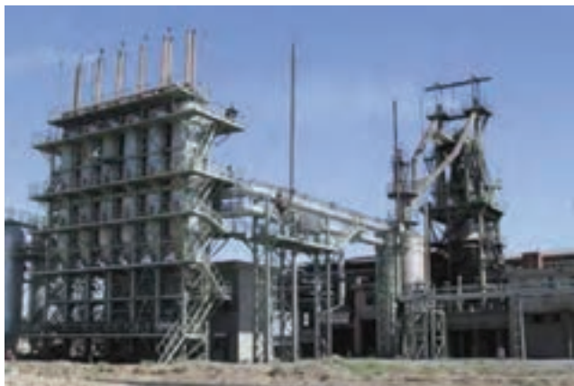
شکل ۳۳-۵ شرکت فولاد زاگرس