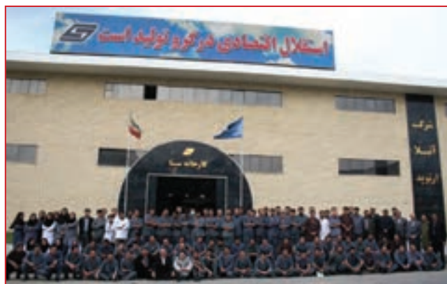
شکل ۳۸-۵- شرکت تولید تجهیزات پزشکی آتیلا ارتوپد

● شرکت تولیدی آتیلا ارتوپد: مجتمع صنایع تولید تجهیزات پزشکی شرکت آتیلا ارتوپد واقع در شهرک صنعتی شماره ۳ سنندج با برخورداری از دانش روز و به کارگیری فن‌آوری بسیار پیشرفته، برای اولین بار در کشور، لوازم جراحی تخصصی و فوق تخصصی ارتوپدی و ستون فقرات را تولید می‌کند. محصولات این شرکت که مطابق با بالاترین استانداردهای بین‌المللی توسط جوانان تحصیل کرده و متخصص استان تولید می‌شود در درمان ده‌ها هزار بیمار کشورمان از جمله بیماران مبتلا به بیماری‌های صعب‌العلاج با نتایج بسیار مطلوب مورد استفاده قرار می‌گیرد. این مجتمع تولیدی منحصر به فرد در کشور، حاصل بهره‌برداری از سه طرح از طرح‌های نه‌گانه شرکت آتیلا ارتوپد در استان کردستان است. هم‌اکنون طرح چهارم شرکت جهت تولید مفصل مصنوعی لگن در شهرک صنعتی شماره یک سنندج در حال احداث است. بدین ترتیب با راه‌اندازی طرح‌های شرکت آتیلا ارتوپد، استان کردستان در راستای اهداف و راهبردهای توسعه در بخش صنعت و معدن به قطب صنایع و تجهیزات پزشکی کشور با اشتغال‌زایی قابل توجه‌ای تبدیل خواهد شد.