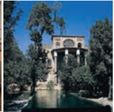
شکل ۲۰-۵- روستای تاریخی پالنگان