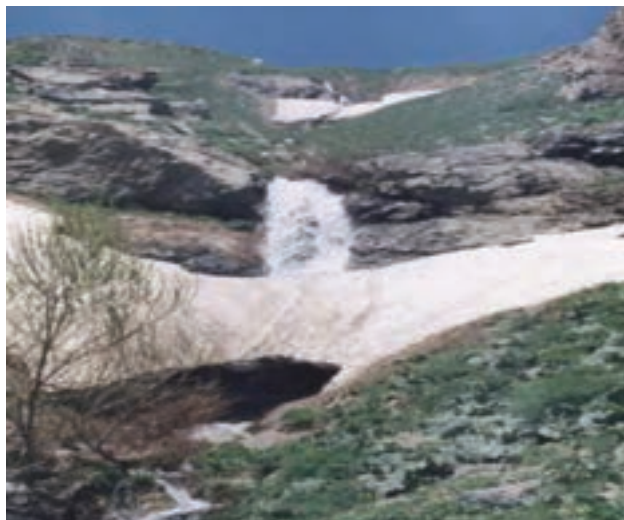
شکل ۸-۵- چشم انداز طبیعی جل چه مه