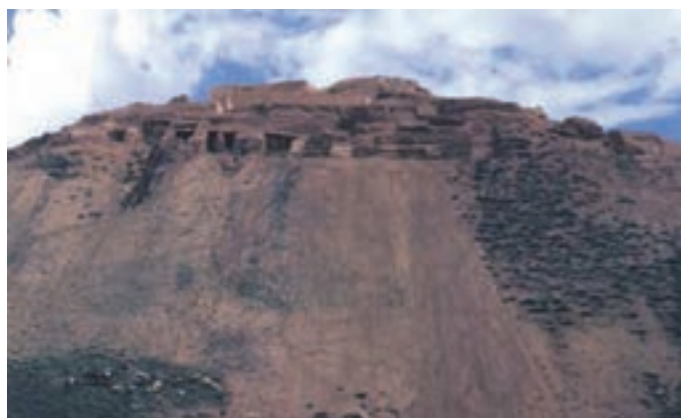
شکل ۱۱-۵- قلعه باستانی زیویه

● قلعه باستانی زیویه : این قلعه در ۴۵ کیلومتری شرق سقز و در شمال روستای زیویه واقع شده است. قلعه زیویه هم از نظر معماری و هم از نظر آثار هنری یکی از شاخص‌ترین مکان‌های تاریخ ایران باستان محسوب می‌شود و مربوط به اقوام مان‌نایی و ماد است که ۲۷۰۰ سال پیش در شمال غرب ایران حکومت می‌کرده‌اند. اشیای به دست آمده در این قلعه از چیره‌دستی استادان مان‌نایی حکایت دارد که از لحاظ مطالعه، سرآغاز و منشأ هنر ایران در دوران هخامنشیان است.