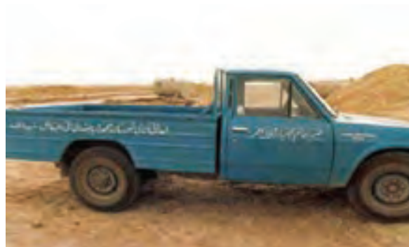
شکل ۱۱-۴ اهدایی اهالی شهرستان بجنورد به جبهه (مؤسسه خیریه خاتم الانبیاء و هلال احمر)

در ۹ نقطه از شهرستان‌های استان، پیکر پاک ۳۱ شهید گمنام دفن شده که در هر یک بنای یادبودی ایجاد شده است.