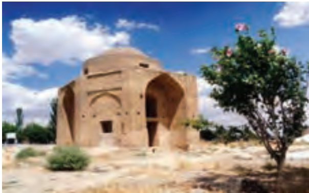
شکل ۴-۶ چهار طاقی تیموری در روستای زیارت شیروان

دوره سامانیان در خراسان را می‌توان دوران طلایی این خطه نام نهاد. حمله چنگیز به شمال خراسان با تخریب‌های زیادی مواجه بود ولی دوره ایلخانان که جانشینان چنگیز بودند، یکی از شکوفاترین دوره‌هاست. خراسان شمالی مرکز ولیعهد نشین دوره ایلخانان بوده است. در این دوره پس از ایجاد ثبات سیاسی - اجتماعی، در شهرهایی چون اسفراین و جاجرم برای نخستین بار در این منطقه اقدام به ضرب سکه شد. خراسان شمالی در دوره تیموریان نقش برجسته‌ای را ایفا نموده است. به نقل از شیخ عارف آذری طی سال‌های ۸۰۰ تا ۸۵۲ ه. ق. اسفراین مرکز حکومت اُلغ بیک بن شاهرخ بوده است.