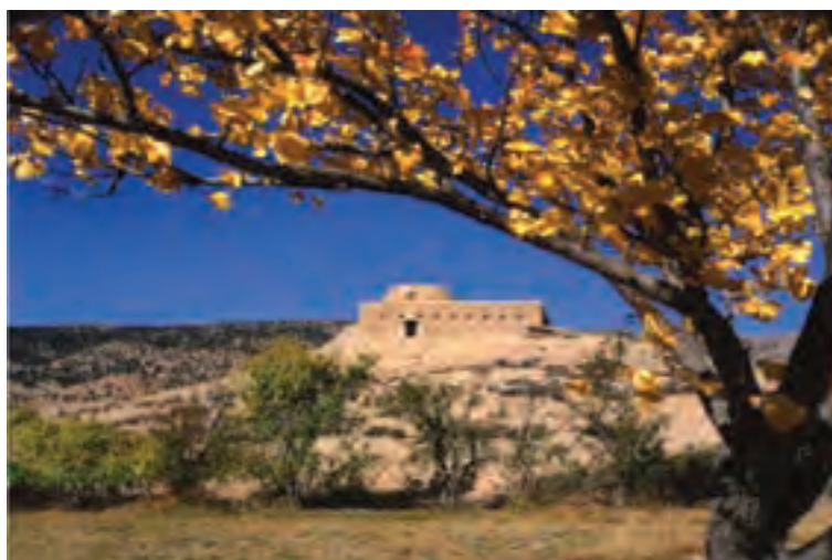
شکل ۴-۴- آتشکده اسپاخو (دوره ساسانی)

از دوره ساسانیان در استان آثار قابل توجهی وجود ندارد و تنها اثر باقیمانده از این دوره آتشکده اسپاخو است.