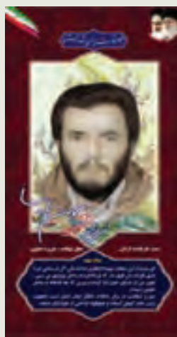
سردار شهید : بهمن پارسا فرمانده گردان