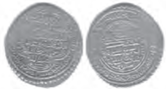
شکل ۴-۵ نمونه سکه الجایتو ضرب سال ۷۱۱ ه. ق. در ضرابخانه اسفراین