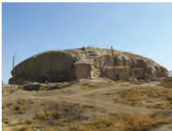
شکل ۱-۴- تپهٔ باستانی قلعهٔ خان در سملقان