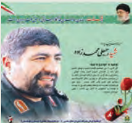
سردار شهید: رجبعلی محمدزاده فرمانده سپاه سلمان سیستان و بلوچستان