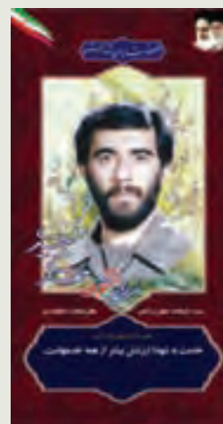
سردار شهید : حاج مهدی وحیدی فرمانده محور لشکر ۵ نصر