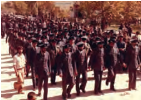
شکل ۷-۴- تصاویری از فعالیت‌ها و راهپیمایی‌های قبل از انقلاب اسلامی در استان