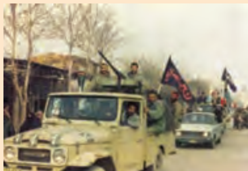
شکل ۸-۴ اعزام نیرو و تجهیزات به جبهه‌های جنگ (بجنورد ۱۳۶۴)