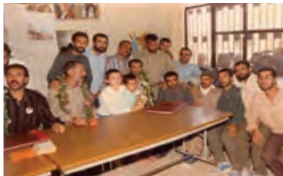
شکل ۱۲-۴ بازگشت آزادگان استان به میهن اسلامی (بجنورد - ۱۳۶۹)