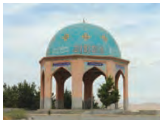
شکل ۱۳-۴ حرم شهدای گمنام - شهر بجنورد