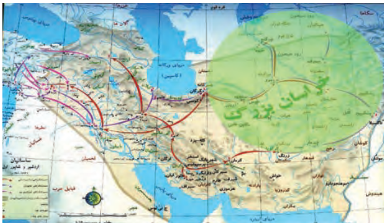
شکل ۳-۴- حدود پارتیا (خراسان بزرگ) در دوران باستان

از دوره ساسانیان در استان آثار قابل توجهی وجود ندارد و تنها اثر باقیمانده از این دوره آتشکده اسپاخو است.