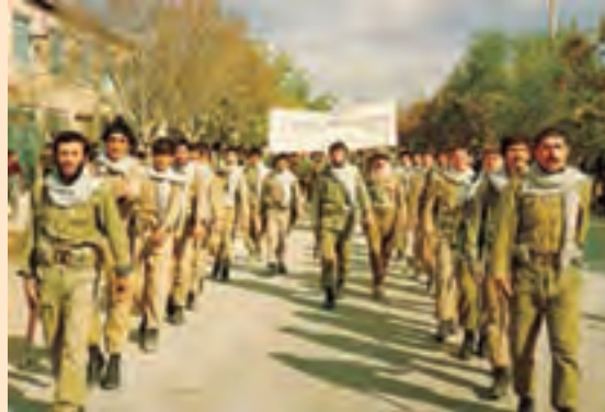
شکل ۱۰-۴ بسیج مستضعفین (شهرستان بجنورد)

در جدول زیر نام و مشخصات تعدادی از عملیات‌هایی که رزمندگان استان در آن حضور داشته‌اند، آورده شده است. با کمک بزرگ‌ترها و دبیر خود جاهای خالی جدول را کامل کنید :