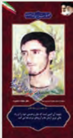
سردار شهید : وهب اصغری راد فرمانده مخابرات تیپ ویژه شهدا