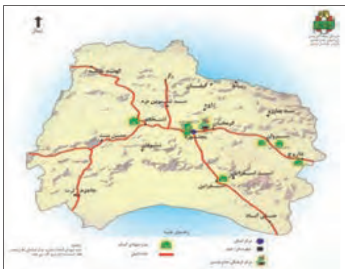
شکل ۱۴-۴ موقعیت حرم شهدای گمنام در استان

در ۹ نقطه از شهرستان‌های استان، پیکر پاک ۳۱ شهید گمنام دفن شده که در هر یک بنای یادبودی ایجاد شده است.