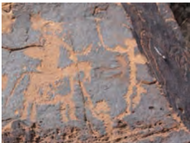
شکل ۲-۴- نمونه‌ای از سنگ نگاره‌های روستای جُربت

براساس یافته‌های باستان‌شناسان که مبتنی بر کارهای میدانی و آزمایشگاهی دقیق است، زمان آغاز سکونت انسان در استان به دورهٔ نوسنگی با سفال در حدود ۸۰۰۰ سال پیش می‌رسد. از شواهد دورهٔ نوسنگی با سفال می‌توان به تپهٔ قلعهٔ خان در سملقان و تپهٔ پهلوان در ۴ کیلومتری جنوب غرب شهر جاجرم اشاره نمود. در استان شواهدی از مرحلهٔ زندگی غارنشینی پیدا نشده است و آثار موجود در سایت‌های نوسنگی نشان از انسان‌هایی را دارد که به دلیل شرایط طبیعی مناسب، کشاورزی می‌کرده‌اند.