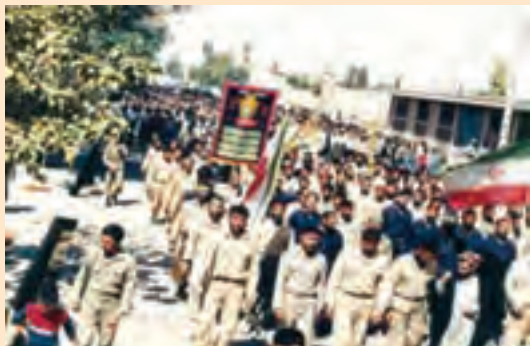
شکل ۹-۴ اعزام نیرو به جبهه‌های جنگ (شهرستان شیروان)