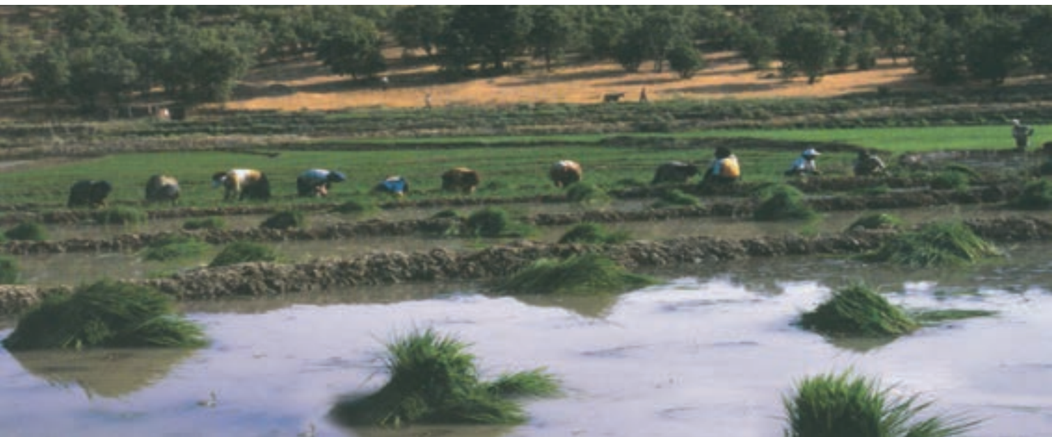
شکل ۲-۶ - شهرستان دنا، روستای کریک