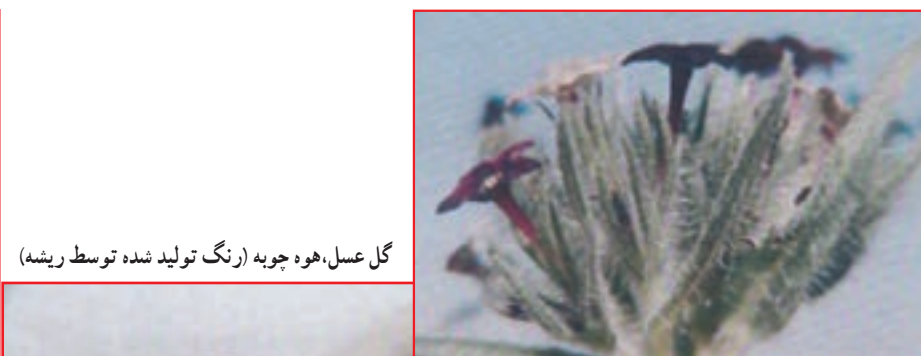
گل عسل، هوه چوبه (رنگ تولید شده توسط ریشه)