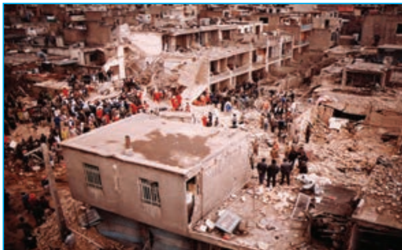
شکل ۲۹-۴- بمباران دبیرستان دخترانه زینبیه شهر میانه در جنگ تحمیلی عراق علیه ایران