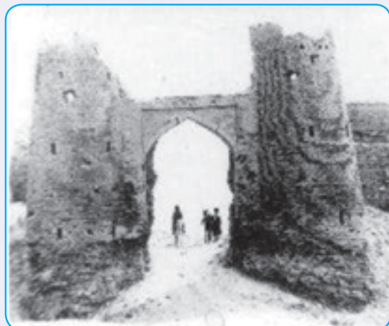
شکل ۱۴-۴. نمایی از ربع رشیدی اولین دانشگاه ایران در دوره مغول