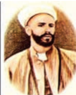
شیخ محمد خیابانی