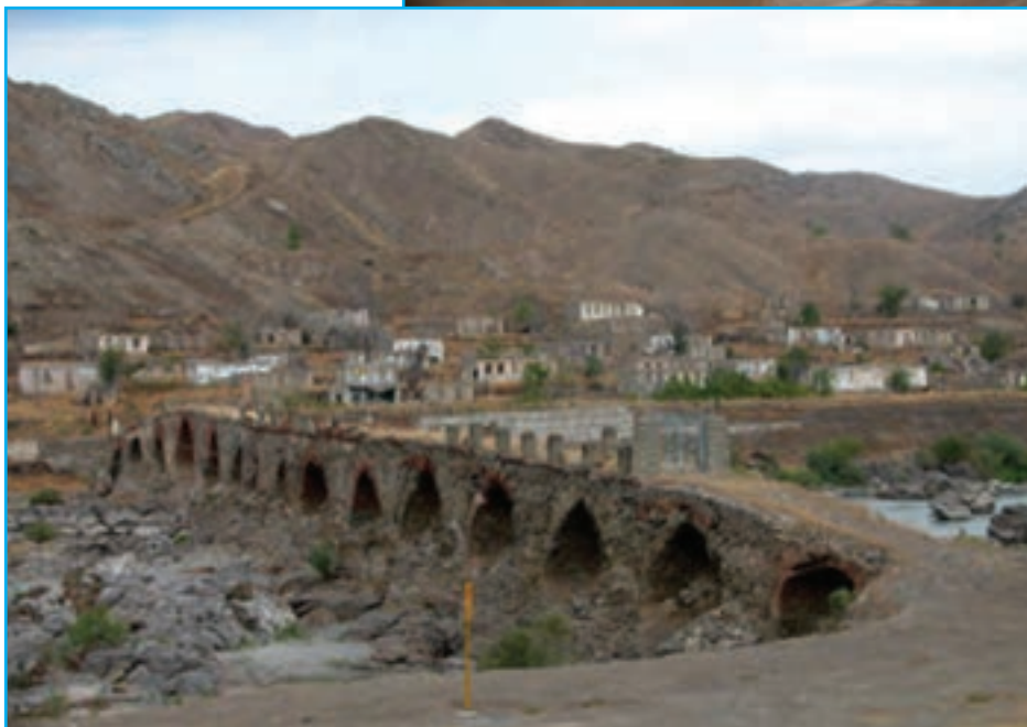
شکل ۸-۴ — پل بزرگ خدا آفرین — اثری متعلق به دوران معاصر