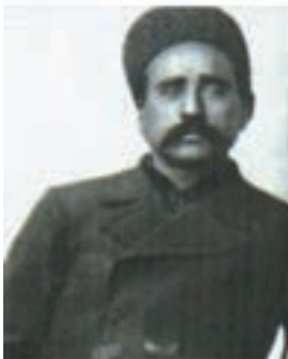
ستارخان سردار ملی