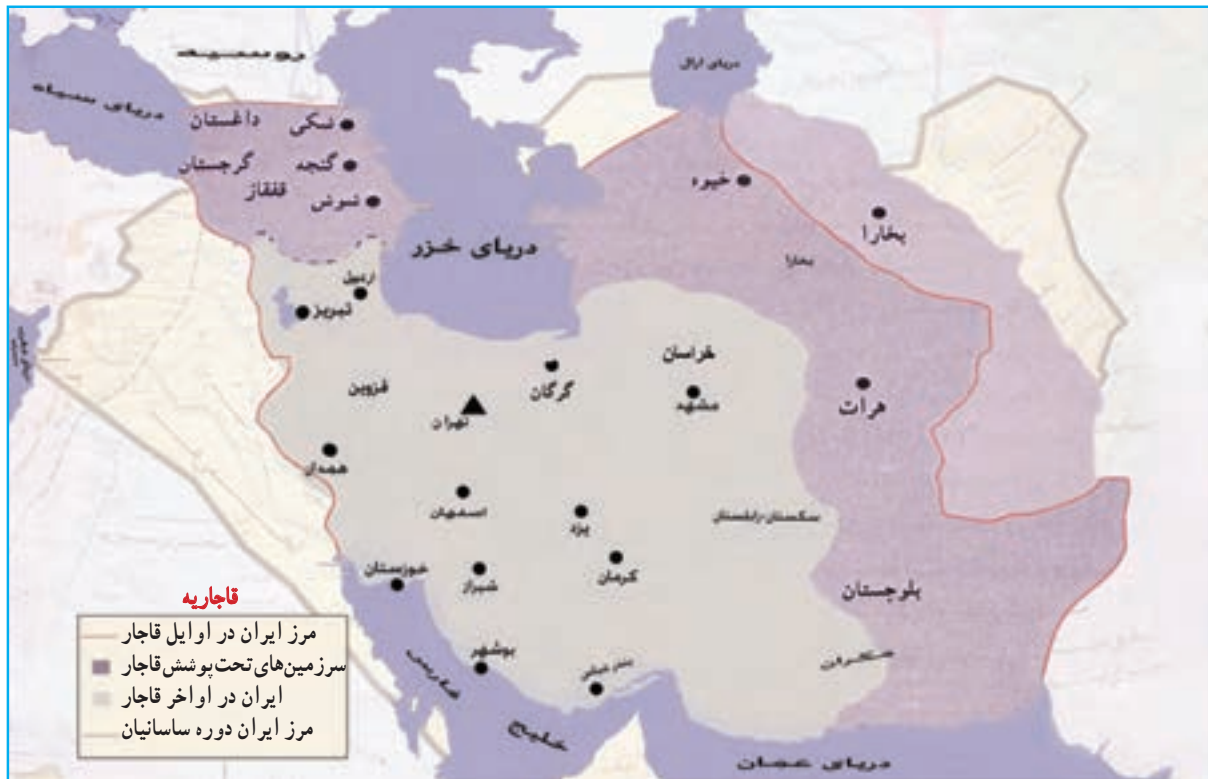
شکل ۲۱-۴ نقشه ایران در اوایل قاجاریه که در آن آذربایجان مرکز فرماندهی جنگ‌های ایران و روس بود