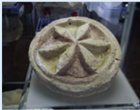
شکل ۶-۴- گچ‌بری‌های نقش خورشید و شیر آثاری متعلق به دوره اشکانی (قلمه ضحاک - اشکانی - هشتروند)