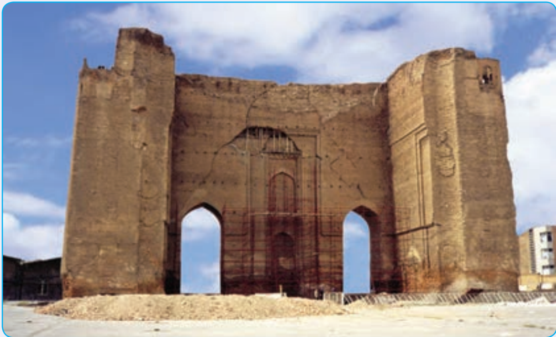
شکل ۱۳-۴. ارگ علিশاه از آثار دوره مغول

ربع رشیدی به عنوان بزرگ ترین دانشگاه جهان اسلام در قرون ۷-۸ هـ. ق شناخته می شد.