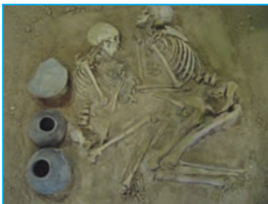
شکل ۲-۴- آثار مکشوفه هزاره اول ق.م در محل محوطه مسجد کبود

در جواب این سؤال که آذربایجان کی و چگونه محل سکونت شد و ساکنان اولیه آن از کدام اقوام بوده‌اند، اطلاع دقیقی در دست نیست. برخی از دانشمندان، با توجه به اشکال سفالینه‌های به دست آمده، در کاوش‌های باستان‌شناسی ساکنان اولیه آذربایجان را مردمی دامدار و از نژاد مدیترانه‌ای می‌دانند. در آغاز هزاره اول ق.م. دره آجی چای و ناحیه کنونی تبریز متعلق به قوم متمدن دالیان بوده است. کاوش‌های باستان‌شناسی در این منطقه کم انجام گرفته و مدارک قابل استناد در این زمینه بسیار ناچیز است. تپه‌های فراوان مکشوفه و غیر مکشوفه باستانی، سنگ نگاره‌های متعلق به پادشاهان اورارتی و وجود قبرستان‌های کلان‌سنگی در نقاط مختلف استان که به قبرهای «گور» معروف‌اند، بیانگر سکونت طولانی انسان در این استان است. از سویی آذربایجان در طول تاریخ، دالان جابه‌جایی اقوام از شرق به غرب و بالعکس بوده و نقش عمده‌ای در تبادلات فرهنگی اقوام گوناگون داشته است. در نتیجه کاوش‌های باستان‌شناسی سال‌های اخیر آثار فراوانی در جنوب شرقی استان به دست آمده که متعلق به عهد حجر قدیم است و قدمت تمدن آذربایجان را به هزاره چهارم ق.م می‌رساند.