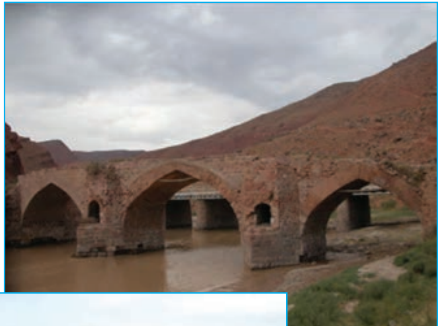
شکل ۷-۴ — پل ونیار — شهرستان تبریز اثری متعلق به دوران معاصر

کشته شد، والی آذربایجان بود. در عهد بنی عباس نیز ابو جعفر منصور دوانیقی دومین خلیفه عباسی و یحیی بن خالد برمکی وزیر معروف ایرانی، از والیان معروف آذربایجان بودند. در سال ۱۹۲ فرقه خرم‌دینان در این ناحیه علیه خلفای غاصب و ستمگر عباسی به رهبری جاویدان بن سهلک سر به شورش برداشتند. این قیام بعد از مرگ او به رهبری بابک خرم‌دین ادامه یافت. عاقبت این قیام در دوره خلافت معتصم هشتمین خلیفه ستمگر عباسی به وسیلهٔ افشین سردار دیگر ایرانی که در خدمت عباسیان بود، سرکوب شد. بابک اسیر گردید و در سال ۲۲۳ هـ. ق در بغداد به دار آویخته شد. در زیر نمونه‌هایی از بناهای تاریخی متعلق به دوره اسلامی آمده است.