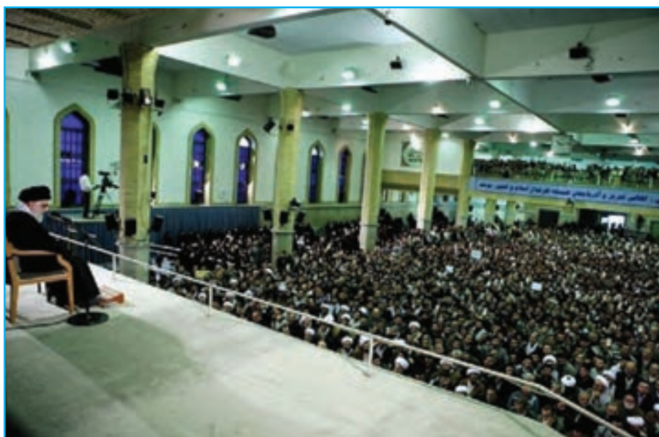
شکل ۲۳-۴ دیدار جمعی از مردم استان با رهبر معظم انقلاب اسلامی در سالروز ۲۹ بهمن، قیام مردم تبریز

مردم آذربایجان شرقی، بارها مخالفت خود را با برنامه‌های ضداسلامی دولت پهلوی‌ها چه در موضوع تغییر لباس و کشف حجاب و چه در اجرای برنامه «اصلاحات ارضی» ابراز نمودند و از حریم اسلام و روحانیت دفاع کردند. اعتراض آنها در قیام پانزده خرداد ۱۳۴۲ ه.ش به رهبری امام خمینی (ره) بعد از انقلاب مشروطه و نهضت ملی شدن نفت، قدرت ایمان و عزم ملی مردم آذربایجان را به نمایش گذاشت. قیام توفنده مردم تبریز در ۲۹ بهمن سال ۱۳۵۶ ه.ش که به مناسبت گرامیداشت چهلمین روز شهادت شهدای ۱۹ دی ماه ۵۶ شهر قم اتفاق افتاد، لزره بر بنیاد دولت پهلوی انداخت و این اعتراض بذر انقلاب را در سراسر کشور پاشید.