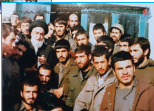
شکل ۲۶-۴- صحنه‌هایی از اعزام رزمندگان آذربایجان شرقی به جبهه‌ها در دوران دفاع مقدس