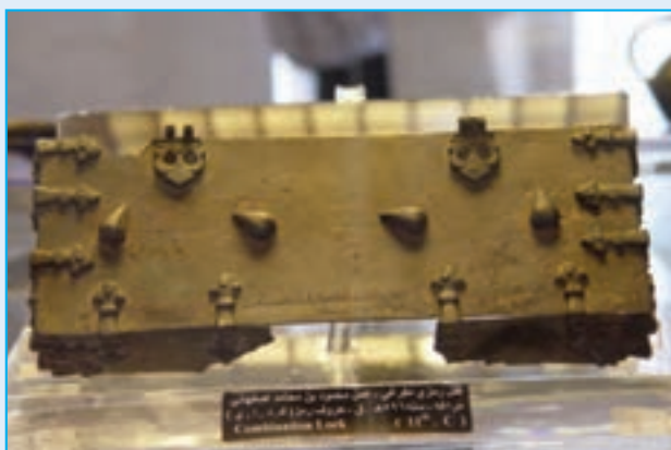
شکل ۴-۲- قفل رمزخوان انری متعلق به قرن ششم ه.ق - عجب‌شیر

۱- دوره مادها: مادها قوم کوچ رو و رمه‌گردان آریایی نژاد بودند که از هزاره دوم قبل از میلاد به فلات ایران مهاجرت کرده‌اند و در شمال غرب این فلات ساکن شده‌اند. مادها به پرورش اسب معروف بودند. به گفته هرودت مورخ یونانی (قرن پنجم ق.م) مادها متشکل از شش قبیله بودند که در نواحی لرستان، کردستان، همدان و آذربایجان پراکنده شده بودند. بعد از اتحاد با دولت «ماننا» دولت آشور را شکست دادند و نخستین دولت آریایی را به رهبری «دیا کو» (۷۰۱ یا ۷۰۸-۶۵۵) ایجاد کردند و به این خاطر آذربایجان را کشور «ماد» می‌گفتند.