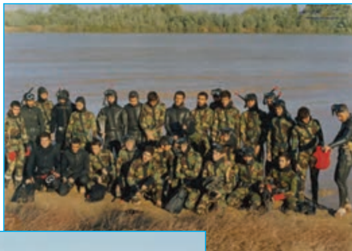
شکل ۳۰-۴- رزمندگان استان در ساحل اروندرود