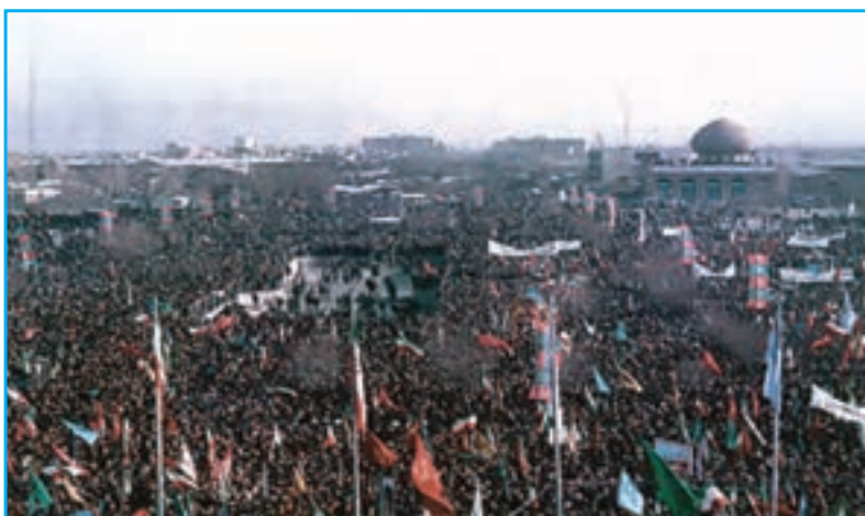
شکل ۲۸-۴- صحنه‌ای از اعزام رزمندگان به جبهه‌ها در دوران دفاع مقدس

اگر حمزه سیدالشهداء در جنگ‌های صدر اسلام، مدافع اسلام و آرمان‌های رسول خدا بود، تا پای جان از اسلام دفاع نمود و در جنگ احد عاشقانه به شهادت رسید، لشکر ۲۱ حمزه آذربایجان نیز همراه با افراد غیور و شجاع و خلبانان تیزپرواز پایگاه دوم شکاری تبریز، از آغاز جنگ تحمیلی و دفاع مقدس، در جبهه‌های حق علیه باطل با دشمن بعثی نبرد کردند. امیران و فرماندهان رشید و از جان گذشته و غیور مردان این لشکر سرافراز آذربایجان با جان فشانی‌ها و حماسه‌سازی‌های خود چهره ایران و ایرانی را در پیشگاه تاریخ و اجداد سلحشور خود سفید کردند. حملات خلبانان متهور پایگاه دوم شکاری آذربایجان به عمق خاک و استحکامات دشمن و بمباران مراکز حیاتی، نظامی و صنعتی عراق، فرماندهان آن کشور که خواب تصرف تهران را دیده بودند به زانو درآوردند. لشکر سرافراز ۲۱ حمزه و پایگاه دوم شکاری تبریز با پایداری خود در مقابل دشمن خسارات و تلفات سنگینی بر آنها وارد کردند. این پایگاه افسران و سربازان و امرای شهیدی چون سرلشکر شهید فکوری را تقدیم اسلام و ایران نمودند. نامشان جاودانه تاریخ پرافتخار گلگون کفن ارتش ایران اسلامی باد.