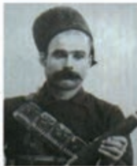
باقرخان سالار ملی