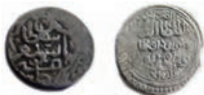
شکل ۱۶-۴- سکه‌های متعلق به دوران آق قویونلوها

اوزون حسن بنیان گذار دولت آق قویونلوها بود. او تبریز را پایتخت خود قرار داد و قلمرو خود را تا بغداد و هرات توسعه داد. بعد از مرگ او فرزندش سلطان یعقوب به سلطنت رسید اما او در جوانی از دنیا رفت و با مرگ یعقوب دولت آق قویونلوها در آذربایجان فروپاشید. مدرسه دینی «نصریه» و مسجد «حسن پادشاه» واقع در خیابان دارایی جدید تبریز از آثار آنها است.