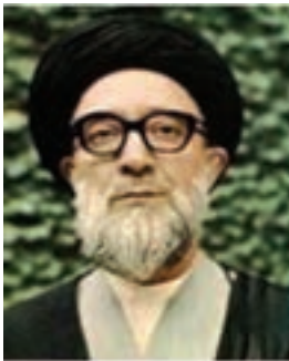
شهید قاضی طباطبایی