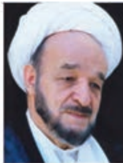
علامه محمد تقی جعفری