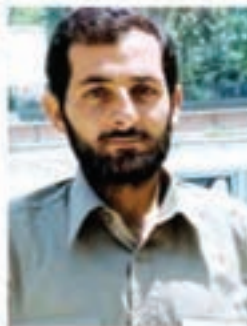
شهید مهدی باکری