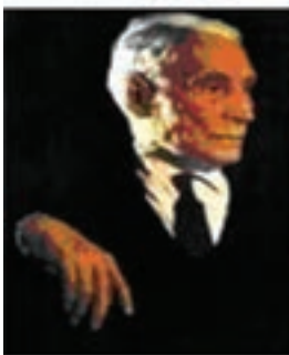
جبار باغچه بان