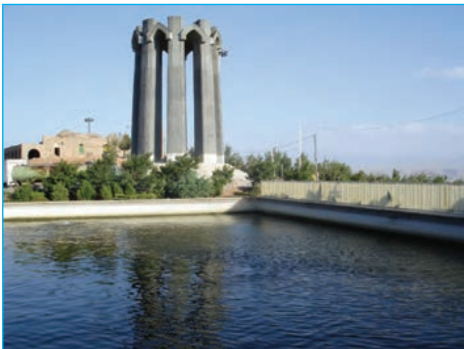
شکل ۲۷-۴. یادبود شهدای گمنام واقع در کنار امام‌زاده عون‌بن علی تبریز

ملت آذربایجان همواره در طول تاریخ با فداکاری‌ها و نثار خون خویش مدافع ایران و اسلام بوده‌اند و در جنگ تحمیلی در هشت سال دفاع مقدس نقش مهمی را ایفا نمودند. لشکر سرافراز ۳۱ عاشورا از رزمندگان دلاور و سرداران رشید آذربایجان تشکیل شده بود که در طول جنگ تحمیلی لرزه بر اندام دشمن بعثی و پشتیبانان جهان‌خوار آنها می‌انداختند. حماسه آفرینی‌های رزمندگان و سرداران لشکر ۳۱ عاشورا در جنگ تحمیلی «تیترا» اول روزنامه‌ها و سرفصل اخبار رادیوهای بیگانه بود. حملات اعجاب انگیز و خط شکنی‌های متهورانه رزمندگان آن لشکر سرافراز، موجب تعجب ناظران سیاسی و مفسران نظامی اروپا و آمریکا می‌شد. سرداران بزرگی چون شهید مهندس مهدی باکری و برادرش شهید مهندس حمید باکری، شهید علی تجلایی، شهید مرتضی باغچیان و شهید حسن شفیع زاده از نامی‌ترین و پرافتخارترین سرداران این استان بودند که حیات پراج خود را عاشقانه در طبق اخلاص نهاده و تقدیم انقلاب و اسلام و ایران نمودند و اوراق زرین دیگری بر کتاب افتخارات ملت آذربایجان، افزودند. روانشان شاد و یادشان جاودانه باد.