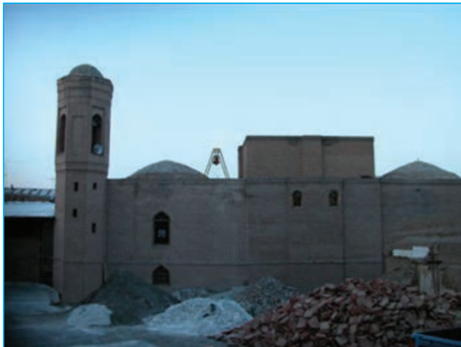
شکل ۹-۴. مسجد جامع مرند دوره اتابکان قرن ۶ ه. ق