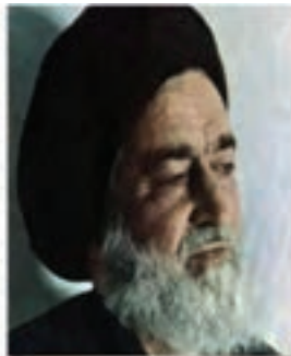
شهید آیت الله سید اسدالله مدنی