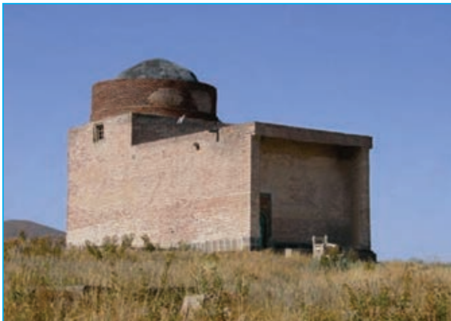
شکل ۱۲-۴- مقبره شیخ اسحق هریس - دوره صفوی ۹۹۰ هـ.ق