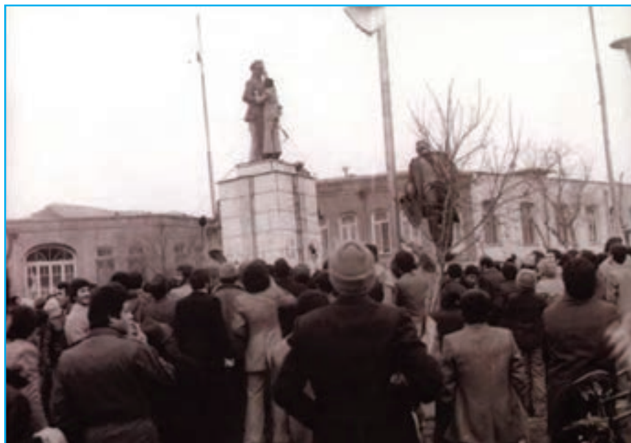
شکل ۲۴-۴- تخریب مجسمه شاه توسط مردم غیور تبریز در ۲۶ دی ماه ۱۳۵۷- روز فرار شاه (میدان ساعت تبریز)

تلاش انقلابی مردم آذربایجان بعد از پیروزی انقلاب اسلامی تا به امروز گواه روشن، بر حمایت بی دریغ مردم آذربایجان از آرمان‌های مقدس انقلاب اسلامی ایران به رهبری حضرت امام (ره) و آیت‌الله خامنه‌ای است. در جریان هشت سال دفاع مقدس، جوانان غیور و باایمان آذری حمایت بی چون و چرای خود را از اسلام و انقلاب به نمایش گذاشتند. اقدامات ایثارگرانه مردم آذربایجان