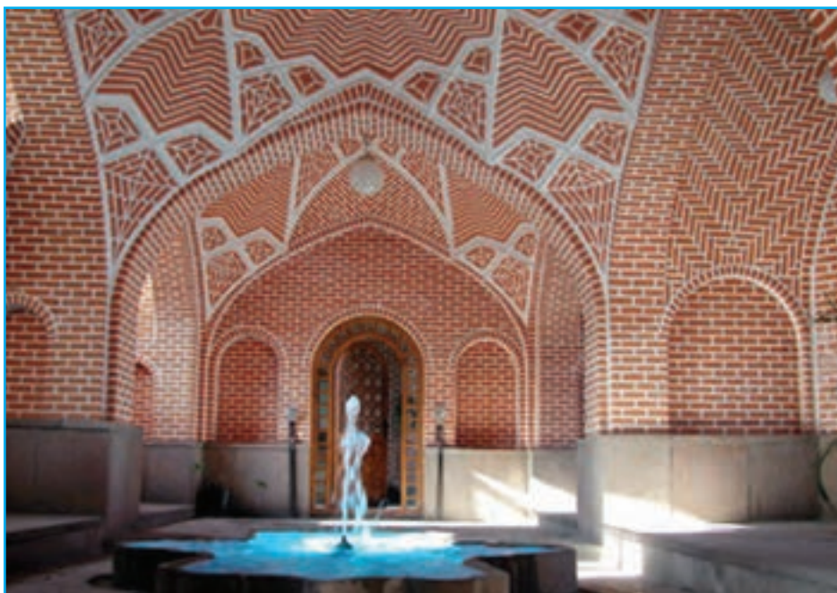
شکل ۱۰-۴. خانه بهنام (دانشکده معماری) - دوره قاجار