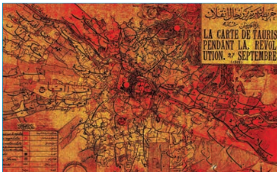
شکل ۲۲-۴- نقشه قدیمی تبریز در سال ۱۲۸۶ هجری شمسی

با دشمن تا آخرین نفس تأکید می کردند و عباس میرزا را به ادامه آن و عدم قبول شرایط روس ها تشویق می کردند. در این میان رفتار پیرزنی از زنان آذربایجانی از همه افتخارآمیزتر بود. این زن سالخورده با شنیدن خبر متارکه جنگ، از قیمت ریسمان دست تاب، مقداری لوازم جنگ و خواروبار برای سربازان تهیه کرده و به مقر فرماندهی عباس میرزا آورده بود تا در تجهیز سربازان وطن در مقابل دشمن سهمی داشته باشد.