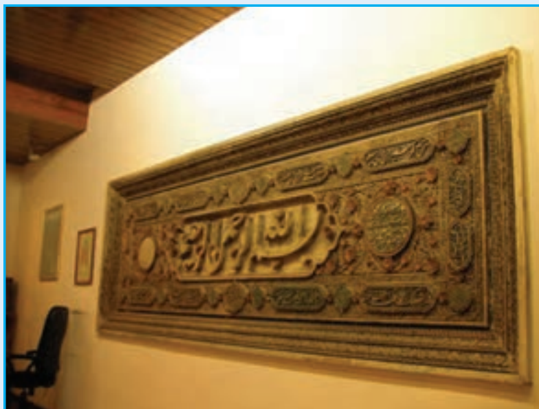
شکل ۱۸-۴- سنگ «بسم الله» - قرن دهم هجری

۶- دوره قاجاریه : در زمان سلطنت فتحعلی شاه قاجار، آذربایجان به دلیل همسایگی با دو کشور بزرگ روسیه و عثمانی، از اهمیت فراوانی برخوردار بود. به همین جهت شهر تبریز ولیعهد نشین شد. این سنت تا انقراض