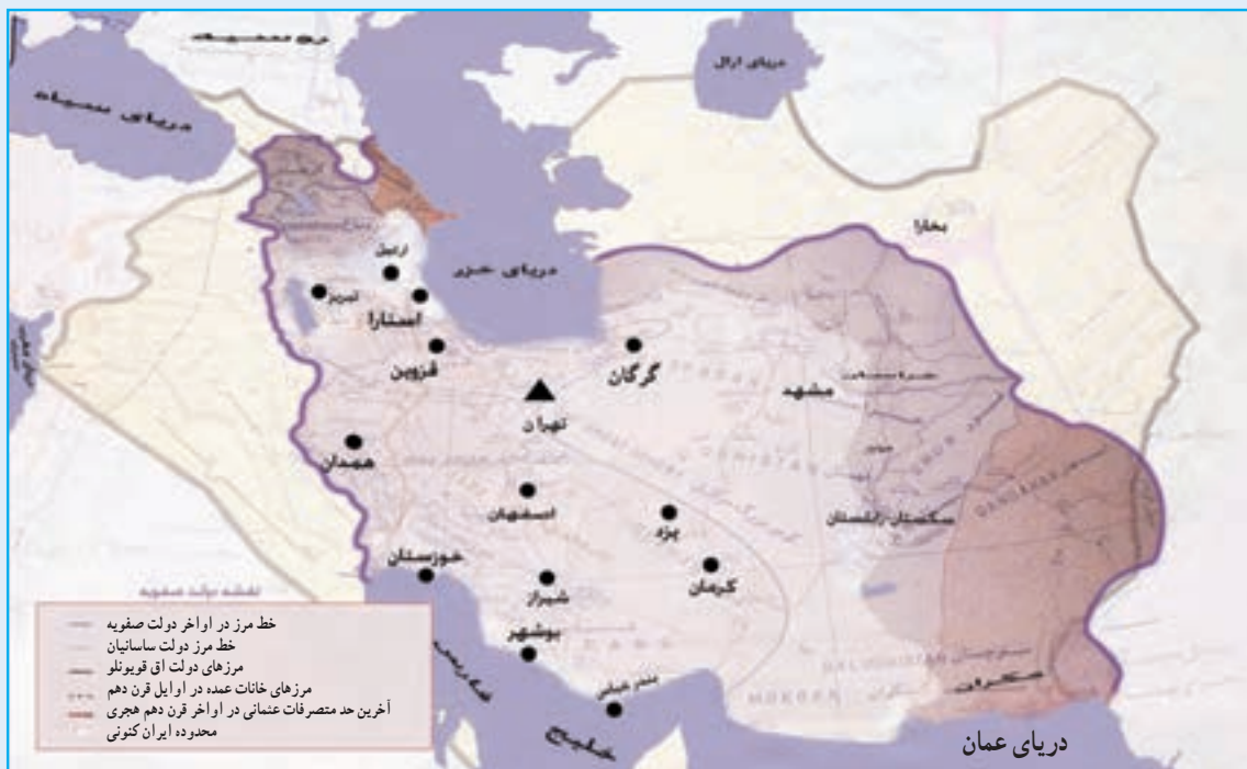
شکل ۲۰-۴. نقشه ایران در دوره صفویه که در آن تبریز به عنوان اولین پایتخت جهان تشیع محسوب می‌شد.

قاجاریه در سال ۱۳۰۴ ه. ش ادامه داشت. در جنگ‌های ایران و روسیه، (۱۲۱۸-۱۲۴۳ ه. ق) آذربایجان اهمیت سیاسی و نظامی فراوانی داشت. مردم آذربایجان با دادن کشته‌های زیاد از این آب و خاک دفاع کردند و در جریان جنگ‌های دوره اول و دوم ایران و روسیه علاوه بر شهرنشینان و روستاییان، عشایر آذربایجان نیز نقش عمده‌ای داشتند. این ایالت بعد از شکست قشون ایران، از قوای روسیه در سال ۱۲۴۳ ه. ق به وسیله نیروهای روسی اشغال شد و بعد از پذیرش عهدنامه ترکمن‌چای و از دست دادن مناطق شمالی رود ارس، از قوای بیگانه تخلیه گردید. در نهضت تنباکو اعتراض از آذربایجان و شهر تبریز آغاز شد و در جریان انقلاب مشروطه در سال ۱۳۲۴ ه. ق آذربایجان از ایالات پرچمدار آزادی بود و تبریز از شهرهای پیشگام در انقلاب و مرکز فعالیت آزادی‌خواهان مشروطه طلب محسوب می‌شد. پس از مرگ مظفرالدین شاه و اعلان سلطنت محمد علی‌شاه، تبریزی‌ها، با توجه به شناختی که در دوران ولیعهدی از او داشتند، به سلطنت وی روی خوش نشان ندادند. لذا پس از به توپ بستن مجلس اول در سال ۱۳۲۶ ه. ق به وسیله محمد علی‌شاه و آغاز دوره استبداد صغیر، تبریز مرکز مقاومت ملی علیه شاه مستبد شد. ستارخان و باقرخان دو تن از سرداران غیور آذربایجان، با کمک مردم و علمای آزادی‌خواه آذربایجان مدت ۱۱ ماه در مقابل نیروهای دولتی مقاومت کردند و با برکناری پادشاه مستبد از سلطنت در سال ۱۳۲۷ ه. ق دوباره نظام مشروطه را برقرار نمودند.