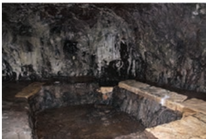
شکل ۱۲-۴ - حمام سنگی خلخال

سابقه مدینیت در خلخال، واقع در بخش جنوبی استان به هزاره دوم قبل از میلاد باز می گردد. در قرن های دوم و سوم هجری در کتب جغرافیایی آن دوره مورخان و جغرافی دانان درباره خلخال مطالبی آورده اند.