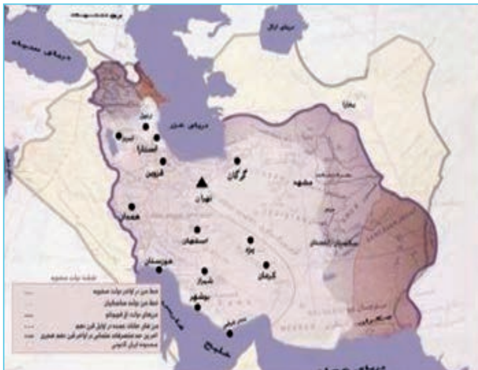
شکل ۴-۶- نقشه ایران در دوره صفویه که در آن ایران به‌عنوان خاستگاه مذهب تشیع در جهان مطرح شد.

شاه اسماعیل نواده شیخ صفی برای تشکیل حکومت واحد ایرانی از اردبیل قیام کرد و همه ولایات را مطیع خود ساخت. شورش‌ها را خواباند و ملوک الطوایفی را از بین برد. نخستین اقدام او رسمی کردن مذهب شیعه در ایران بود. بنابراین، اردبیل خاستگاه مذهب شیعه و تشکیل دولت ملی در ایران به شمار می‌رود.