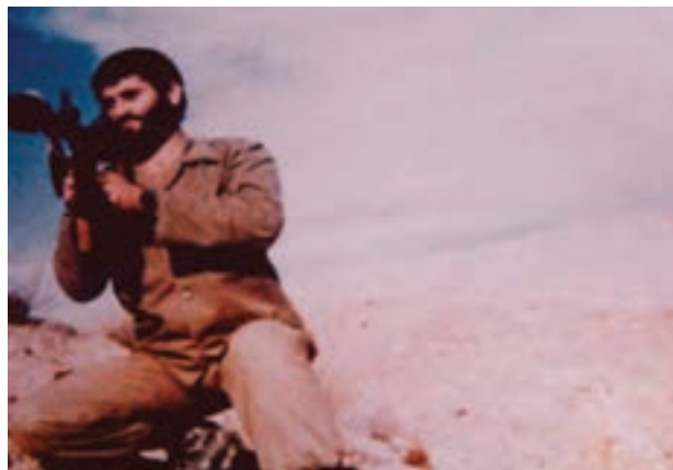
شکل ۲۲-۴- شهید بنام علی محمدزاده