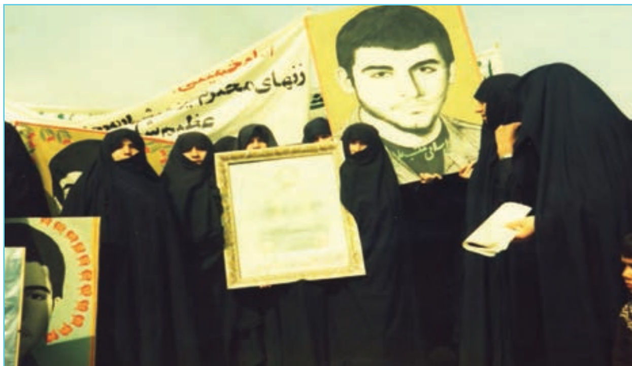
شکل ۱۳-۴ حضور زنان استان در عرصه های مختلف دفاع مقدس

مردم مسلمان و انقلابی این استان از دوره صفویه که مذهب تشیع از اردبیل رسمیت یافت، همواره ولایت مدار و در عرصه های مختلف تحت تأثیر مکتب حسینی در برابر هر گونه ظلم و ستم خارجی و داخلی ایستاده اند و با نثار خون خویش در حوادثی مانند جنگ چالدران، جنگ های ایران و روسیه، اشغال آذربایجان در جریان جنگ جهانی اول و دوم و مبارزه با فرقه جدایی طلب دموکرات از هویت دینی و ملی خود دفاع کرده اند. در دوره حکومت پهلوی نیز در کنار روحانیت و دیگر انقلابیون به مخالفت با اقدامات استبدادی و ضد مذهبی رژیم پرداختند. اعتراض آیت الله سید یونس اردبیلی به کشف حجاب دوره رضاشاه نمونه بارز این ادعاست. استان اردبیل با تقدیم شهدای گرانقدری در دوران انقلاب و دفاع مقدس نقش بزرگی در وقوع و استمرار انقلاب اسلامی ایفا کرده است.