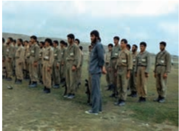
شکل ۱۹-۴- شهید شاپور برزگر (نفر اول)