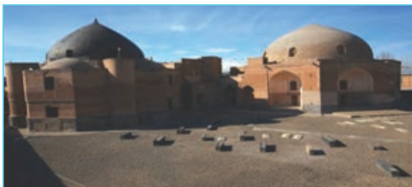
شکل ۴-۵- خانقاه شیخ صفی‌الدین در اردبیل

در دوره ایلخانان به دلیل رشد و گسترش تصوف، خانقاه‌های زیادی در نواحی مختلف ایران بنا شدند که مهم‌ترین آنها خانقاه شیخ صفی‌الدین در اردبیل بود. بزرگی مقام شیخ صفی‌الدین در عرفان باعث شد که اردبیل کعبه آمال و قبله صوفیان شود. علاوه بر مردم، حاکمان و بزرگان نیز احترام خاصی به شیخ صفی‌الدین و فرزندان آنها می‌گذاشتند، به طوری که معروف است امیر تیمور لنگ در ملاقات با شیخ خواجه علی در اردبیل هزاران اسیر عثمانی را به درخواست ایشان آزاد کرد.