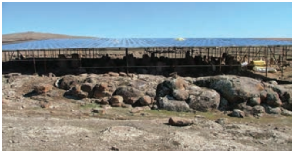
شکل ۱-۴- شهر یری در مشکین شهر مربوط به دوره پیش از تاریخ

با توجه به مدارک موجود باستان‌شناسی، می‌توان گفت منطقه اردبیل حداقل از هزاره ششم قبل از میلاد مسکون بوده است؛ چرا که سراسر منطقه از تپه‌های باستانی یا به عبارت دیگر مناطق استقرار که روزگاری دژ یا شهرک یا روستا بودند پوشیده شده است مانند شهر یری در مشکین شهر، قلعه اولتان در پارس آباد و بوینی یوغون (دژ بهمن) در نیر.