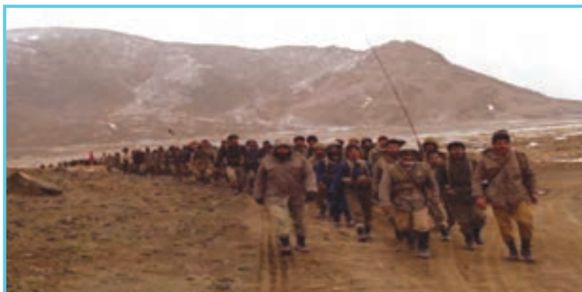
شکل ۴-۱۴- رزمندگان اسلام در جبهه

در طول ۸ سال دفاع مقدس مردم غیرتمند اردبیل در تمامی مراحل جنگ حضور فعال داشتند. از ابتدا تا پایان دفاع مقدس با اعزام ده‌ها هزار نیرو به جبهه‌های نبرد و شرکت در عملیات‌های مختلف حضور مؤثر داشتند. سپاه اردبیل از فعال‌ترین یگان‌ها در طول هشت سال دفاع مقدس بود که در حدود ۳۵۰۰۰ نفر نیرو به جبهه اعزام کرد. دومین یگان