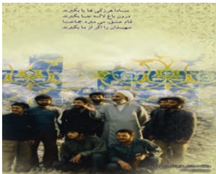
شکل ۱۵-۴ دیدار رزمندگان اردبیل با آیت الله مروج امام جمعه فقید اردبیل

نام یک یا چند شهید دفاع مقدس را در محل زندگی‌تان (روستا - شهر) شناسایی کنید و دربارهٔ چگونگی شهادت آنها تحقیق کرده و گزارشی از آن در کلاس ارائه دهید.