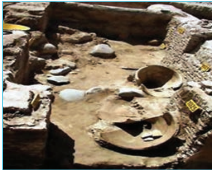
شکل ۳-۴ آثار به جا مانده در اردبیل از دوره پارت‌ها

یاقوت حموی در معجم البلدان بنای این شهر را به فیروز ساسانی که در سال‌های ۴۸۳-۴۵۹ میلادی سلطنت می‌کرد نسبت داده و آن را فیروزگرد نامیده است. وی در کتاب خود اردبیل را مشهورترین شهر آذربایجان خوانده و گفته است که پیش از اسلام کرسی ناحیه بوده و در جای دیگر گویند اردبیل از بناهای فیروز موسوم به باذان فیروز بوده است. این مطالب نشان می‌دهند که اردبیل یکی از شهرهای قدیمی ایران است و قبل از اسلام قرن‌های متمادی کرسی آذربایجان و قسمت مهمی از آن بوده است، ولی حوادث تاریخی به خصوص حملات طوایف و زلزله‌های سخت بارها آن را ویران کرده و آثاری را که امروز می‌توانست مدارک گویایی برای تاریخ آن حدود باشد به تاراج مهاجمان داده یا زیر خاک مدفون ساخته است.