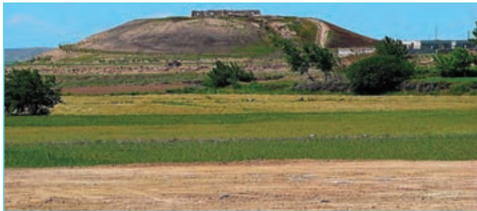
شکل ۹-۴- تپه نادری در اصلاندوز

اردبیل در دوره صفوی از لحاظ سیاسی و اقتصادی سرآمد شهرهای ایران بود. در آغاز دوره قاجار عباس میرزا نایب السلطنه فتحعلی شاه قاجار مرکز ستاد سپاهیان خود را در اردبیل قرار داد و به کمک افسران فرانسوی قلعه‌ای در برابر هجوم قوای روسیه بنا کرد که بعدها تبدیل به زندان شد. / یا شما نام آن قلعه را می‌دانید؟ در جنگ ایران و روسیه در ۱۲۱۸ هـ. ق قوای روس به اردبیل حمله کرد و تا تنظیم عهدنامه ترکمنچای این شهر در اشغال بیگانه بود. در زمان اشغال همه اشیای قیمتی و بی‌همتای مقبره شیخ صفی‌الدین و زینت آلات دیگر مقبره‌ها و کتاب‌های مهم کتابخانه اردبیل که شاه عباس وقف کرده بود و از کتاب‌های خطی نفیس و بی‌نظیر و بی‌همتا بود غارت شد. پس از ولیعهد نشین شدن تبریز در دوره قاجار اردبیل از رونق افتاد، ولی مردم استان اردبیل در تحولات مهم بعدی از جمله مشروطیت و حوادث بعد از شهریور ۱۳۲۰ هـ. ش، ملی شدن صنعت نفت، وقوع انقلاب اسلامی، دوران جنگ و سازندگی همپای مردم آذربایجان و ایران اسلامی در حفظ هویت ایرانی - اسلامی تلاش زیادی کرده‌اند. مغان بخش شمالی استان که سابقاً موغا یا مغان نام داشته با داشتن مناطقی مانند باجروان، ورنان، برزند و اولتان و... سابقه تاریخی بسیار طولانی دارد.