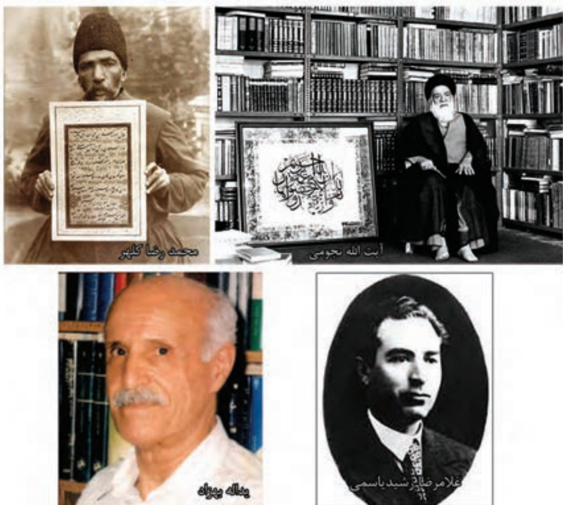
شکل ۴-۶- تصاویری از مشاهیر استان کرمانشاه

از سایر مشاهیر استان کرمانشاه نیز می توان به آیت الله هادی جلیلی، رحیم معینی، علی محمد افغان، ابوالقاسم الهامی و... اشاره کرد.