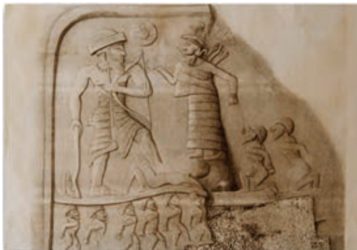
شکل ۳-۴- نقش آنوبانی نی - سرپل زهاب

از نخستین اقوام ساکن در منطقه کرمانشاه کنونی که نام آن‌ها در تاریخ ذکر شده، می‌توان اقوام گوتی، کاسی و لولوبی را نام برد. در این میان لولوبی‌ها یکی از قدیمی‌ترین سنگ نگاره‌های شناخته شده ایران (نقش آنوبانی نی) را پدید آوردند (شکل ۳-۴).