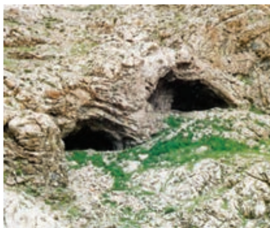
شکل ۱-۴ غار دواشکفت یکی از کهن‌ترین سکونتگاه‌های بشر در منطقه کرمانشاه در دامنه کوه تاق بستان

به نظر شما آیا رابطه‌ای بین گذشته تاریخی هر منطقه و جغرافیای طبیعی آن وجود دارد؟ با ذکر مثال برای گفته‌های خود دلیل بیاورید.