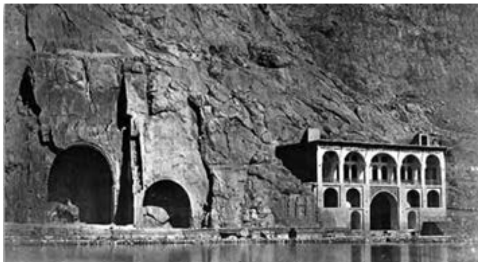
شکل ۴-۴- نمای از تاق بستان قدیم

راه مهم بابل - هگمتانه - مناطق داخلی ایران)، همچنان جایگاه ممتاز خود را حفظ کرد. تأییدکننده این موضوع، قرار گرفتن مهمترین و مفصل ترین سند مکتوب بازمانده از هخامنشیان، یعنی کتیبه داریوش اول، در بیستون است. در دوره سلوکیان نظر به طبیعت مساعد کرمانشاه، این ناحیه مورد توجه ویژه یونانیان قرار گرفت. به خصوص نواحی ماهیدشت و دینور که به لحاظ شرایط طبیعی برای تربیت اسب بسیار مناسب بود. با ظهور سلسله اشکانی، کرمانشاه همچنان مورد توجه قرار داشت و به همین دلیل منطقه کرمانشاه به لحاظ آثار به جا مانده از دوره اشکانی موقعیتی منحصر به فرد در ایران دارد. نقش برجسته بلاش در بیستون یکی از آثار به جا مانده در منطقه کرمانشاه است. دودمان ساسانی که جانشین خاندان اشکانی شده بودند نیز توجه ویژه ای به کرمانشاه داشتند، به طوری که در این دوران اصولاً ناحیه کرمانشاه، ملک شخصی پادشاهان ساسانی محسوب می شد و پادشاهان این سلسله جهت پرهیز از گرمای طاقت فرسای پایتخت (تیسفون) و نیز به لحاظ آب و هوا و طبیعت مطلوب کرمانشاه، همچنین نزدیکی آن به تیسفون، بخشی از دوره گرم سال را در ییلاق های منطقه کرمانشاه می گذراندند. تاق بستان یادگار خسرو اول در این منطقه قرار دارد. گسترش شهرسازی یکی از سیاست های پادشاهان ساسانی در غرب بود که بنیاد شهرهای حلوان (سرپل زهاب) و قرمیسین یا کرمانشاه را نهاده و بر اعتبار استان کرمانشاه بیش از پیش افزود. شاهان ساسانی با ایجاد پل هایی بر روی رودخانه ها و بناهایی که رفاه عموم مردم را تأمین می کرد، رونق اقتصادی بیشتری را برای مردم این دیار به ارمغان آورده بودند. از نظر وجود آثار مربوط به دوران باستان در ایران زمین، تنها استان فارس و تا حدودی خوزستان با استان کرمانشاه قابل مقایسه است.