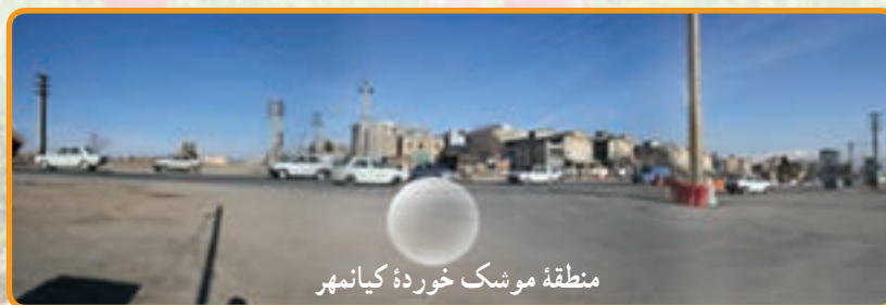
منطقه موشک خورده کیانمهر

شکل ۱۱-۲ مناطق موشک خورده کرج در دوران دفاع مقدس