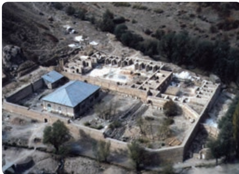
شکل ۷-۱۰ کاخ شهرستانک