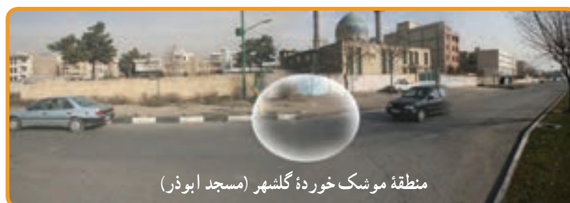
منطقه موشک خورده گلشهر (مسجد ابوذر)