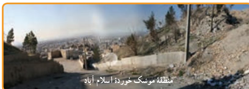
منطقه موشک خورده اسلام آباد

حمله موشکی عراق به شهرها : هنگامی که مقاومت و پیروزی رزمندگان اسلام در جبهه‌های جنگ نیروهای بعثی عراق را زمین‌گیر کرد، ارتش بعثی عراق به دستور صدام برای شکستن مقاومت رزمندگان حمله موشکی به شهرهای بی‌دفاع را در اواخر سال ۱۳۶۶ آغاز کرد. در این عملیات ناجوانمردانه شهر کرج نیز چهار بار مورد حمله موشکی قرار گرفت که در این حملات ۱۱۷ تن از هم‌وطنان شهید و تعداد زیادی مجروح شدند.