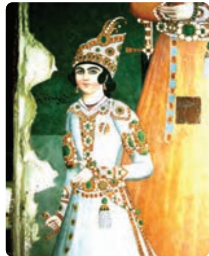
شکل ۶-۱۰ تصاویری از سران قاجار در کاخ سلیمانیه