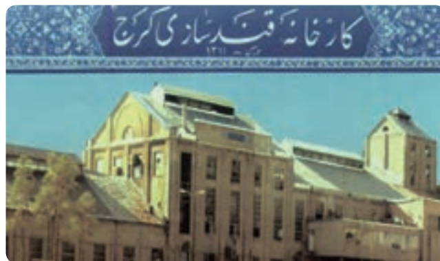
شکل ۸-۱۰ کارخانه قند کرج از اولین واحدهای صنعتی استان

مجموعه این تحولات موجب شد در مدت کوتاهی کرج با جذب مهاجرانی از سراسر کشور به دومین شهر پرجمعیت استان تهران تبدیل شود و سرانجام در سال ۱۳۸۹ به عنوان مرکز استان البرز انتخاب شد.