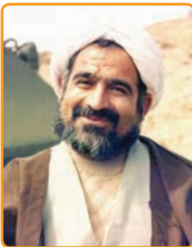
شهید حجت الاسلام غلامرضا سلطانی نماینده مردم کرج در مجلس شورای اسلامی