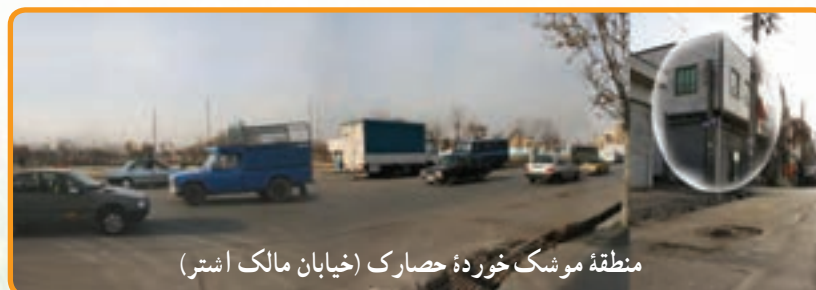
منطقه موشک خورده حصارک (خیابان مالک اشتر)