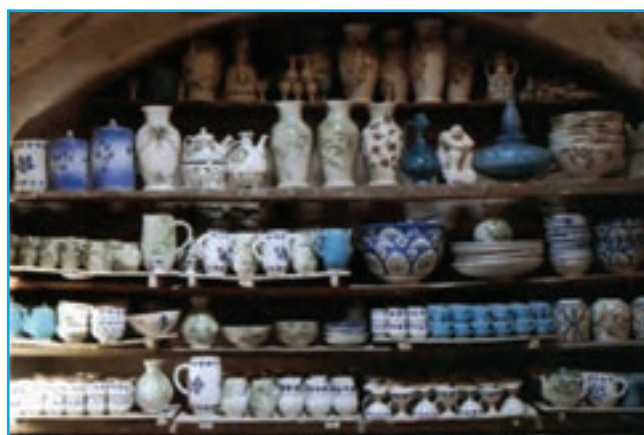
شکل ۱۴-۳- سفالگری در زنوز

صنایع دستی برجسته این استان شامل قالی‌بافی، ورنی بافی، گلیم بافی، سوزن دوزی، جاجیم بافی، تذهیب، هنرهای چوبی، سفالگری، نقاشی روی چرم، سبذبافی و... است. رونق صنعت زیبای فرش بافی در این استان به حدی است که عمده‌ترین صادرات غیرنفتی استان را به خود اختصاص داده است. فرش این استان معمولاً به کشورهای آلمان، فرانسه، ایتالیا و انگلیس صادر می‌شود.