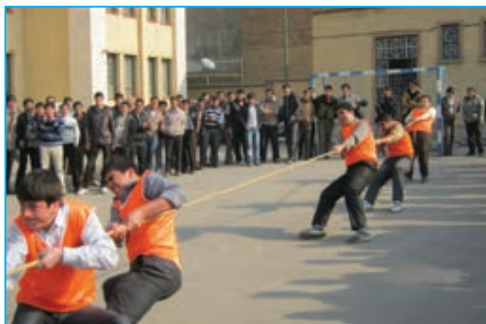
شکل ۷-۳- تصویری از مسابقه طناب کشی در میان دانش آموزان در مدارس

در گذشته در مناطق مختلف آذربایجان همچون دیگر مناطق ایران، کودکان و نوجوانان اوقات فراغت خود به صورت های گوناگون سپری می کردند که هم موجب تفریح و شادی آنان می شد و هم آنها را با فنون و مهارت های اجتماعی آشنا می ساخت. امروزه این بازی ها که پر از شادی و نشاط بوده اند، جای خود را به وسایل ارتباط جمعی به ویژه تلویزیون، بازی های رایانه ای، آتاری و ... داده است که هم آثار نامناسبی بر سلامت روح و روان کودکان و نوجوانان برجای می گذارد و هم سلامت جسمی آنان را به مخاطره می اندازند. در آذربایجان با توجه به تنوع این منطقه انواع بازی های محلی مشاهده می شود. از جمله آنها می توان به بازی : بنفشه بنده دوشتر، بش داش، طناب کشی، تیرنا ووردی، پیل دسته (کلینگ آغاج)، آرادا ووردی، گیزلین پالانج (قایم باشک) و ... اشاره کرد.