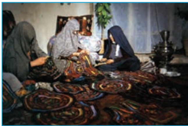
شکل ۱۳-۳- سوزن‌دوزی در ممقان