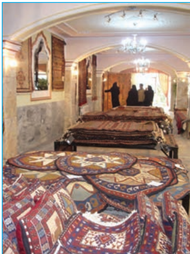
شکل ۱۲-۳- نمایشگاه و فروشگاه صنایع دستی عشایر

در این میان صنایع دستی به عنوان جلوه‌ای بدیع از هنرهای سنتی در آذربایجان توانسته همواره تحسین نظاره‌گران را برانگیزد.