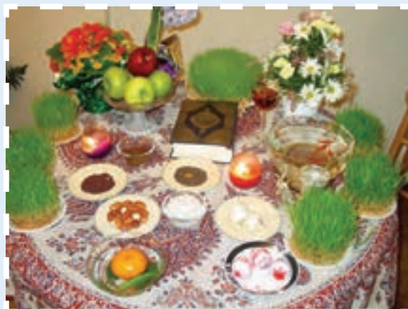
شکل ۱۰-۳- تصویری از مراسم عید نوروز در استان