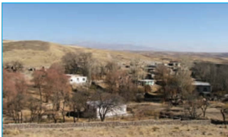
شکل ۵-۳- تصویری از روستای خشک‌تاب (زادگاه شهریار)

یکی از دلایل شاهکار بودن منظومه «حیدر بابا به سلام» آن است که دربر گیرنده فرهنگ عامه این دیار است. تصویر ارائه شده در این شعر، نه تنها تصویر واقعی روستای خشک‌تاب بلکه نمایی از تمام روستاهای ایران است. شهریار که به حق او را شهریار شعر و سخن نامیده‌اند، در قالب‌های مختلف شعر فارسی، مانند قصیده، مثنوی، غزل، قطعه، رباعی و قالب‌های آزاد شعر سروده است. از غزل‌های او می‌توان به «همای رحمت» و «آمدی جانم به قربانت» و «سهندیه شهریار» اشاره کرد.