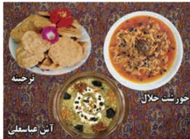
شکل ۳-۳- برخی از غذاهای محلی استان کرمانشاه

بیشتر غذاهای رایج در استان همان هایی هستند که در اکثر نقاط کشور رواج دارند ولی برخی از خوراک ها و شیرینی ها نیز ویژه این استان بوده و از تنوع و شهرت خاصی برخوردار است. از جمله می توان به موارد زیر اشاره کرد : برخی از غذاهای محلی استان کرمانشاه شامل : دنده کباب، خورش خلال، پلو کشمش، دانه کولانه، بورانی کنگر، پلو شویت، قورمه، هلیسه، آش غوره، بُورانی چغندر، آش ترخینه، آش عدس، دلمه، خورش کدو حلوایی و شیرینی ها شامل : نان برنجی، نان خرمايي، کاک، بژيي (پرساق) و حلوا است. در بین انواع شیرینی ها نان برنجی و کاک و نان خرمايي از شیرینی های مشهوری است که در سطح کشور به عنوان سوغات استان کرمانشاه شناخته شده اند؛ چنانکه روغن حیوانی کرمانشاه نیز در تمام کشور جایگاه ویژه ای دارد.