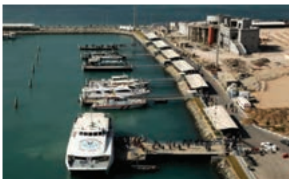
شکل ۱۰-۲- بندرعباس

بندرعباس : بندرعباس به عنوان مرکز استان امروزه یکی از شهرهای بزرگ ایران و مرکز مهم فعالیت‌های اقتصادی و تجاری است. این شهر که در قسمت انتهایی خلیج فارس و در فصل مشترک شاهراه خلیج فارس و دریای عمان واقع شده است، نقش مهمی در زمینه صادرات و واردات کشور ایفا می‌کند. تأسیسات مهم دریایی و زیربنایی کشور همچون بندر شهیدرجایی، پالایشگاه نفت بندرعباس، کارخانه آلومینیوم المهدی، کارخانه آلومینیوم هرمزگان، کشتی‌سازی خلیج فارس، فولاد و سیمان هرمزگان از این جمله می‌باشند.