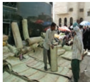
شکل ۳-۲- نمونه‌ای از منابع درآمد روستائیان استان