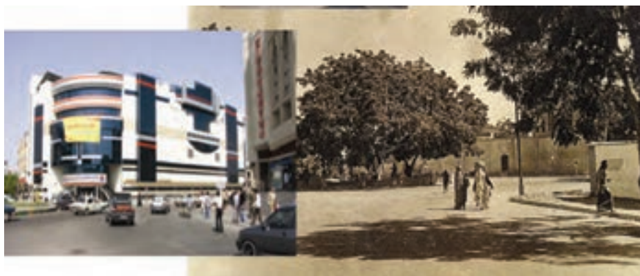
شکل ۵-۲- توسعه شهر بندرعباس (میدان ۱۷ شهریور)

به نظر شما شهرنشینی در استان نسبت به گذشته چه تفاوتی یافته است؟ به دو تصویر زیر که مربوط به نقطه‌ای از شهر بندرعباس است توجه کنید. چه عواملی سبب این تغییرات شده است؟