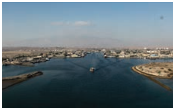
شکل ۱۱-۲- بندر شهید رجایی

بندر شهید رجایی: مجتمع بندری شهید رجایی، با برخورداری از موقعیت منحصر به فرد جغرافیایی در نزدیک ترین نقطه به تنگه هرمز و دهانه ورودی خلیج فارس، به دلیل فاصله کوتاه از مسیر اصلی تردد بین قاره‌ای کشتی‌ها، با قرار گرفتن در محل تلاقی کریدور ترانزیتی شمال - جنوب، مهم ترین دروازه واردات و صادرات جمهوری اسلامی ایران محسوب می‌شود.