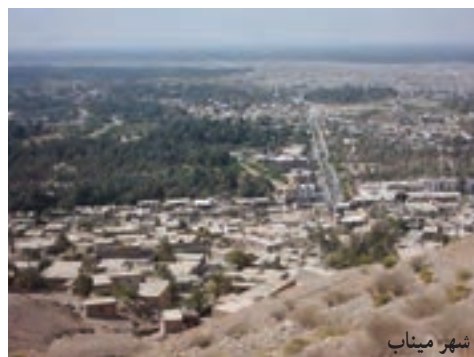
شکل ۶-۲: چشم اندازی از شهر ابوموسی، بندرعباس، میناب و قشم