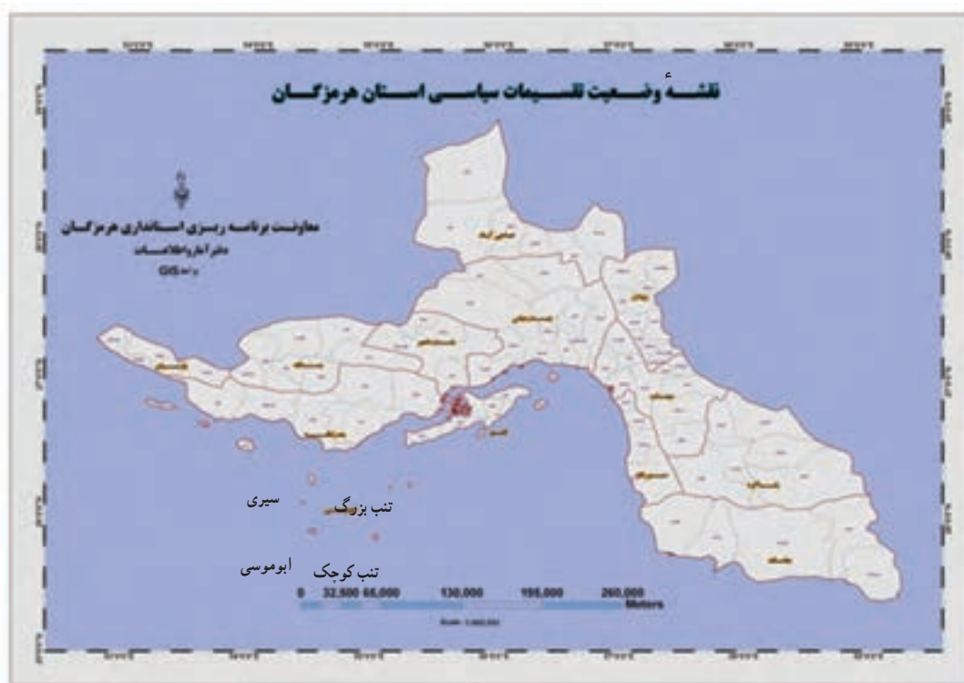
شکل ۱-۲- نقشه تقسیمات سیاسی استان هرمزگان به تفکیک شهرستان

استان هرمزگان بر اساس آخرین تقسیمات کشوری ۱۳ شهرستان که ۹ شهرستان آن ساحلی است، ۳۸ شهر، ۸۵ دهستان، ۳۸ بخش و ۲۹۱۰ آبادی و ۱۴ جزیره دارد.