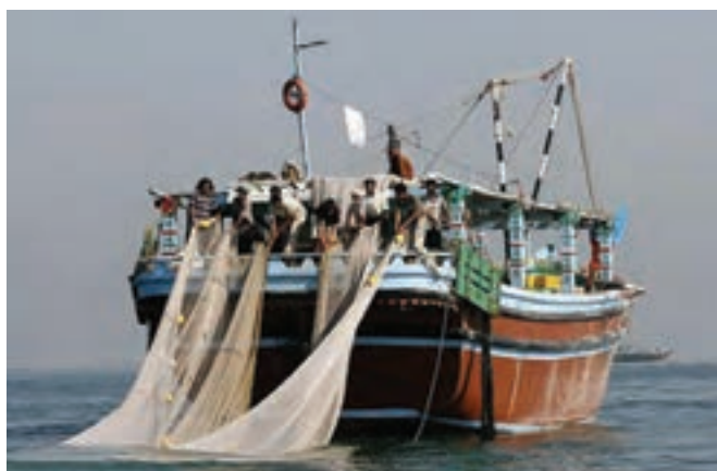
شکل ۷-۲- صیادی

مهم‌ترین منابع درآمد جزیره نشینان: ویژگی‌های طبیعی جزایر، کمبود آب شیرین و عدم خاک حاصلخیز، نزدیکی آنها به امارات متحده عربی و سهولت رفت و آمد موجب شده که شغل بیشتر جزیره نشینان خرید و فروش کالا، صیادی و دریانوردی باشد و همین عوامل باعث شده که در گذشته، گروهی از مردم این جزایر برای پیدا کردن کار مناسب و درآمد بیشتر جزیره را ترک نمایند؛ اما با اقداماتی که دولت در سال‌های اخیر انجام داده است؛ مانند ایجاد مناطق آزاد تجاری، بازارچه‌های مرزی، دستگاه‌های آب شیرین‌کن، فروشگاه‌های زنجیره‌ای، بانک‌ها و غیره، تحولی در زندگی مردم زحمت‌کش بومی پیش آمده است که چشم‌انداز روشنی را در پیش‌رو خواهند داشت.