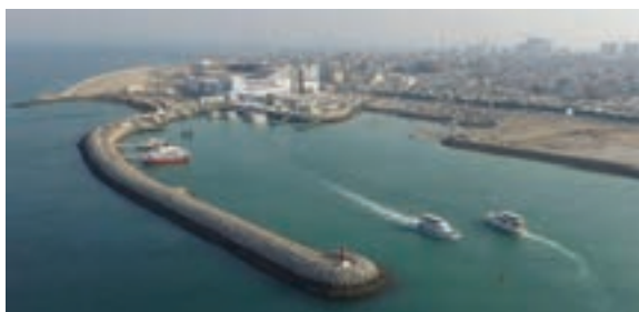
شکل ۸-۲- جزیره قشم

جزیره کیش : جزیره‌ای آباد و زیبا واقع در تپه‌های مرجانی برآمده از دل آب‌های نیلگون خلیج فارس است. عمده تجارت کیش در گذشته مروارید بوده است.