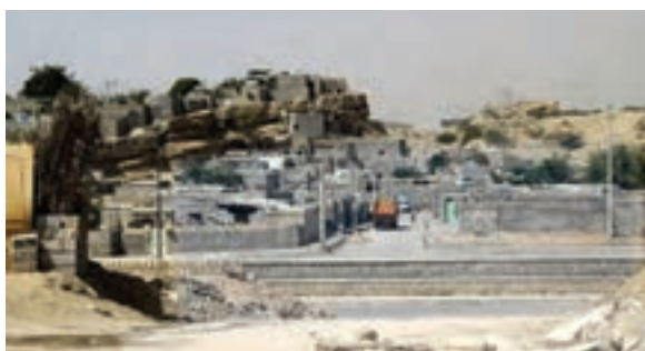
شکل ۱۵-۲ حاشیه نشینی در بندرعباس