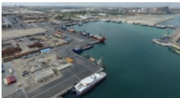
شکل ۹-۲- جزیره کیش

این جزیره از لحاظ وسعت مقام دوم را در میان جزایر خلیج فارس دارد و از لحاظ تاریخی دارای سوابق بازرگانی می‌باشد به طوری که مرکز ارتباطات بازرگانی بین هندوستان، ایران و بین‌النهرین به شمار می‌آمده است.