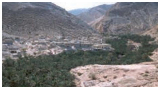
شکل ۴-۲- شکل روستای طولی و متمرکز