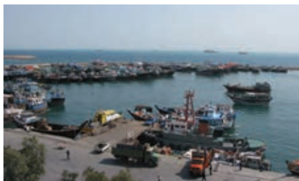
شکل ۱۲-۲- بندر لنگه

بندر لنگه: بندر لنگه جنوبی ترین مرز ساحل خشکی خلیج فارس است از این رو این بندر کمترین فاصله را با سایر کشورها و بنادر حاشیه جنوب خلیج فارس دارد. اتصال از سه جهت به شبکه جاده‌ای کشور، موقعیت مناسب قرارگیری بندر به لحاظ جغرافیایی، نزدیکی به تنگه هرمز و آب‌های بین‌المللی، وضعیت مساعد شرایط حوضچه بندر، ارتباطات قوی ساکنان با اتباع کشورهای حاشیه خلیج فارس و فاصله کوتاه بندر تا کشورهای مذکور بندر را از لحاظ ارتباطات دریایی در جایگاه ویژه‌ای قرار داده است.