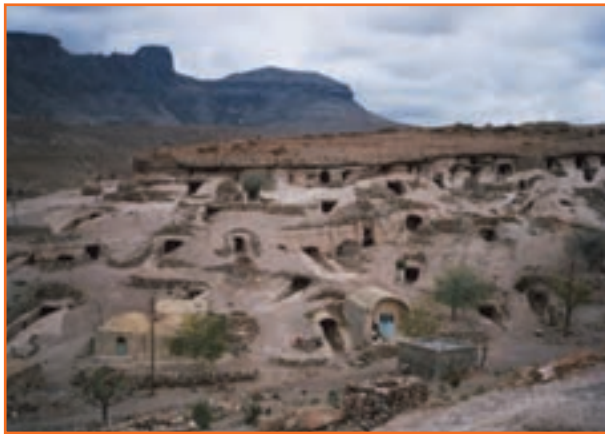
شکل ۲-۶- روستای میمند یکی از نمونه‌های سکونت اولیه در ایران

آب با آبادی در ایران پیوند دیرینه دارد. در نواحی مرکزی و شرقی کشور به‌خصوص استان کرمان پسوند اکثر روستاها کلمه (آباد) برگرفته از آب و آبادی است.