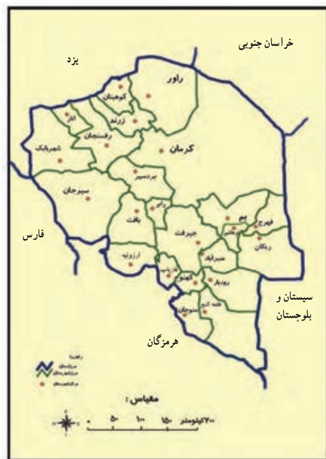
شکل ۱-۲- نقشه تقسیمات سیاسی استان کرمان

استان کرمان، پهناورترین استان ایران است. در سال ۱۳۹۱ دارای ۲۳ شهرستان، ۵۸ بخش و ۶۷ شهر است. این شهرستان‌ها عبارت‌اند از: انار، بافت، بردسیر، بهم، جیرفت، رابر، راور، رفسنجان، رودبار جنوب، ریگان، زرنده، سیرجان، شهربابک، عنبرآباد، فهرج، قلعه گنج، کرمان، کهنوج، کوهبنان، منوجان، نورما شیر، فاریاب و ارزوئیه. با مراجعه به نقشه سیاسی استان کرمان شکل ۱-۲ شهرستان محل سکونت خود را هاشور بزنید. شهرستان شما در کدام قسمت استان کرمان واقع شده است؟ و با کدام شهرستان‌ها یا استان‌های دیگر همسایه است؟