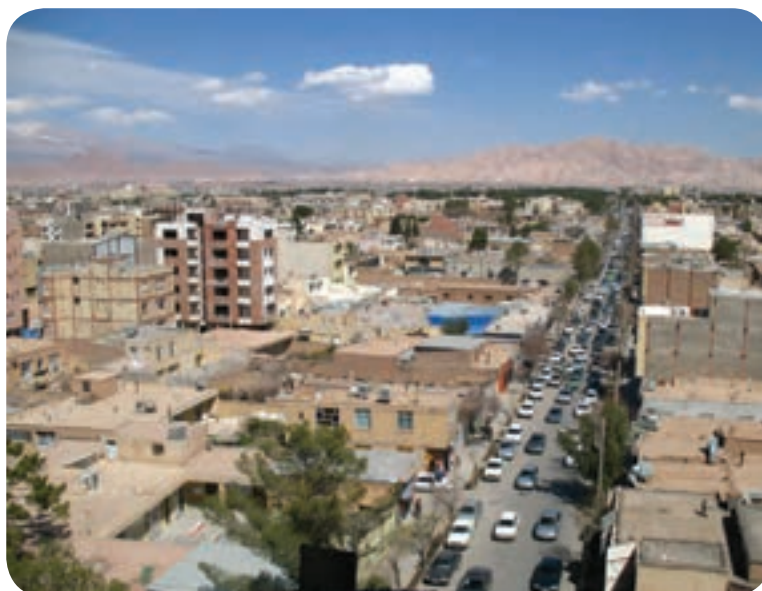
شکل ۱۵-۲- شهر کرمان