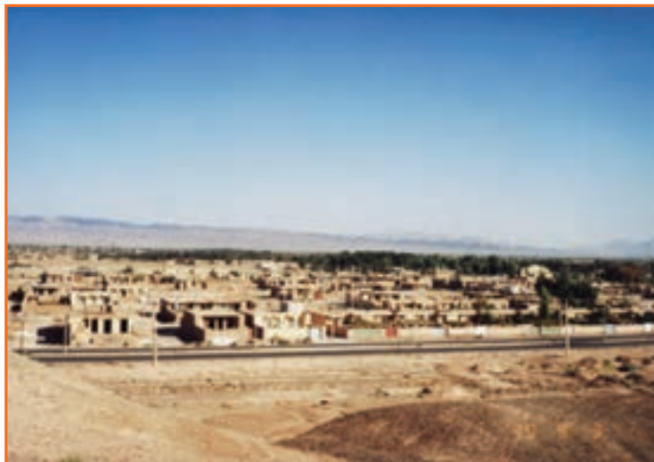
شکل ۱۲-۲ شهر را ور با نقش ارتباطی