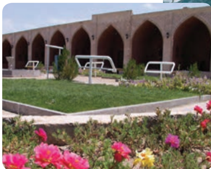
شکل ۱۷-۲- کاروانسرای وهاب‌زاده رفسنجان