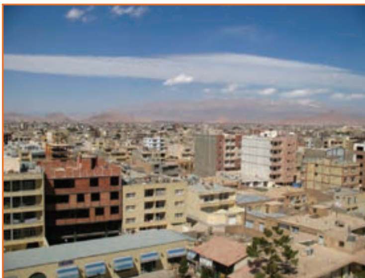
شکل ۱۱-۲ چشم اندازی از شهر کرمان

– مهاجرت روستاییان به شهرها چه مشکلاتی برای شهرها به وجود می آورد؟