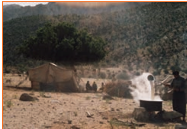
شکل ۴-۲ زندگی عشایری

به دلیل تنوع آب و هوایی و مجاورت مناطق گرمسیری (قشلاق) و سردسیری (بیلاق) با یکدیگر در بخش وسیعی از استان، یکی از کهن‌ترین معیشت‌های اقتصادی؛ یعنی کوچ‌نشینی در استان کرمان به وجود آمده است.