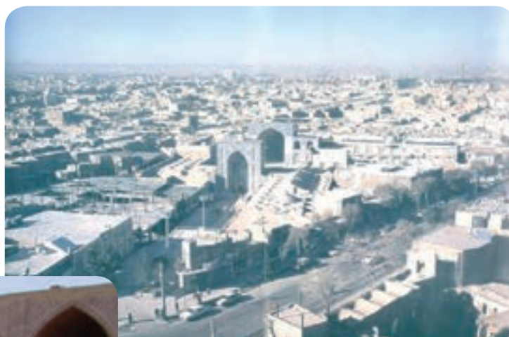
شکل ۱۶-۲- مسجد جامع کرمان - شهر کرمان