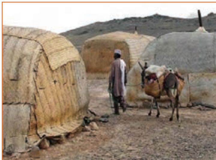
شکل ۹-۲- کَپر نشینی در جنوب استان کرمان

در نواحی جنوبی استان کرمان که از محروم‌ترین مناطق ایران است هنوز بیشترین درصد جمعیت در مناطق روستایی زندگی می‌کنند. عده زیادی از آن‌ها در خانه‌هایی به نام کَپر زندگی می‌کنند. که اگر برای اشتغال و مسکن آن‌ها فکر اساسی نشود در آینده‌ای نه چندان دور، آن‌ها نیز به نواحی شهری مهاجرت کرده و بر درصد جمعیت شهرنشین و همچنین مشکلات شهرها می‌افزایند.