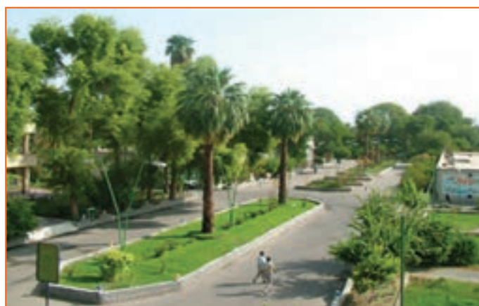
شکل ۱۴-۲- شهر جیرفت

شهرهای استان کرمان از نظر نقش و عملکرد وضعیت یکسانی نداشته و از درجات متفاوتی برخوردارند. بیشتر آن‌ها دارای نقش اداری، خدماتی و تجاری اند اما بعضی از این نقش‌ها، بارزتر است؛ مثلاً نقش اداری سیاسی در کرمان، ارتباطی در انار و سیرجان، تاریخی در بم و جیرفت و... در سال‌های اخیر بر اثر رشد جمعیت و همچنین مهاجرت بی‌رویه روستاییان به شهرها و تحولات دیگر نقش بعضی از شهرها نیز تغییر کرده یا در حال تغییر است.