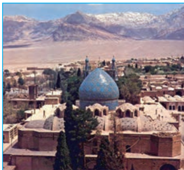
شکل ۱۳-۲- شهر ماهان

شهرهای استان کرمان از نظر نقش و عملکرد وضعیت یکسانی نداشته و از درجات متفاوتی برخوردارند. بیشتر آن‌ها دارای نقش اداری، خدماتی و تجاری اند اما بعضی از این نقش‌ها، بارزتر است؛ مثلاً نقش اداری سیاسی در کرمان، ارتباطی در انار و سیرجان، تاریخی در بم و جیرفت و... در سال‌های اخیر بر اثر رشد جمعیت و همچنین مهاجرت بی‌رویه روستاییان به شهرها و تحولات دیگر نقش بعضی از شهرها نیز تغییر کرده یا در حال تغییر است.