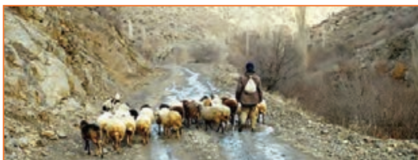
شکل ۱۰-۲- دامداری و دامپروری از منابع درآمد روستاییان استان کرمان

کشاورزی مهم‌ترین فعالیت اقتصادی روستاییان بوده و باغداری، زراعت، دامداری و دامپروری و صنایع دستی به ترتیب مهم‌ترین منابع درآمد روستاییان این استان محسوب می‌شوند. این استان با در اختیار داشتن حدود ۲۵ درصد باغات کشور بزرگ‌ترین تولید کننده محصولات باغی است و عمده محصولات درختی آن عبارت‌اند از: پسته، خرما، مرکبات و گردو. علاوه بر محصولات درختی؛ در زمینه محصولات صیفی و جالیزی و نیز دانه‌های روغنی سهم عمده‌ای در اقتصاد کشاورزی دارد. در روستاهای استان کرمان دامداری به صورت سنتی و نیز با شیوه‌های جدید و علمی رواج دارد. در گذشته دامداری و دامپروری نقش مهمی در تولید پشم و روتق صنایع دستی استان به ویژه قالی بافی داشته است، به طوری که قالی کرمان و به ویژه راور از شهرت فراوان برخوردار است، ولی در سال‌های اخیر این هنر روتق گذشته را از دست داده است.