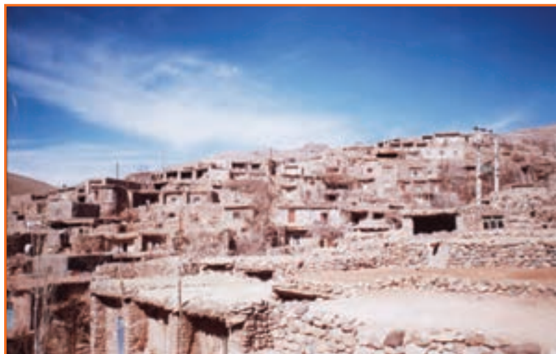
شکل ۲-۷- روستای پلکانی ریشه شهر بابک

در نواحی کوهستانی و مناطق پایکوهی استان کرمان به تبعیت از محیط طبیعی؛ خانه‌های روستایی یا در دامنه کوه‌ها واقع شده و شکل پلکانی به‌خود گرفته‌اند، یا در دره‌ها که در این صورت شکل دره‌ای دارند. در روستاهای کوهستانی معمولاً دیوار (پی) ساختمان‌ها را از سنگ و روی سقف خانه‌ها را با چوب پوشانده و روی آن گل می‌ریزند. در این گونه روستاها زمین‌های کشاورزی در قسمت‌هایی واقع شده‌اند که خاک بیشتر داشته و از شیب کمتری برخوردارند. آب آشامیدنی و زراعی این گونه روستاها بیشتر از چشمه و قنات فراهم می‌شود.