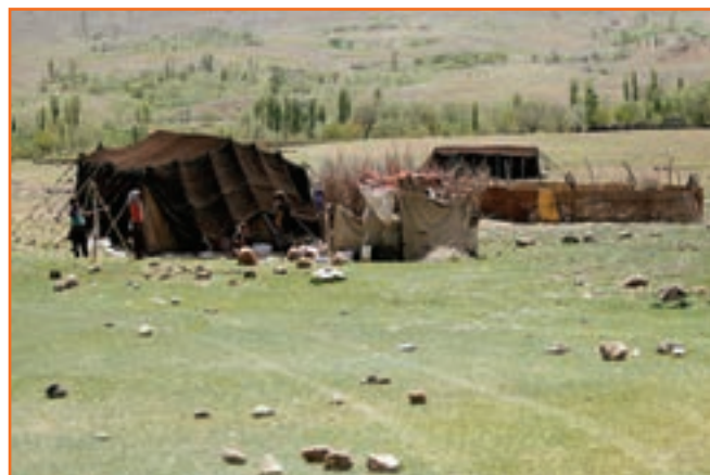
شکل ۵-۲ عشایر استان کرمان