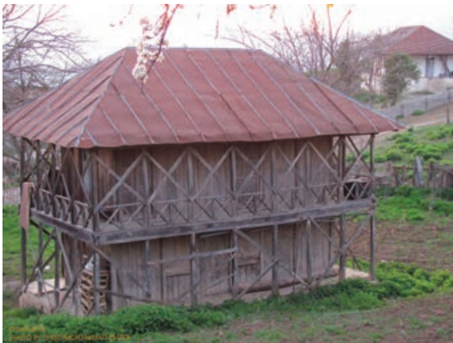
شکل ۴-۲- مسکن روستایی