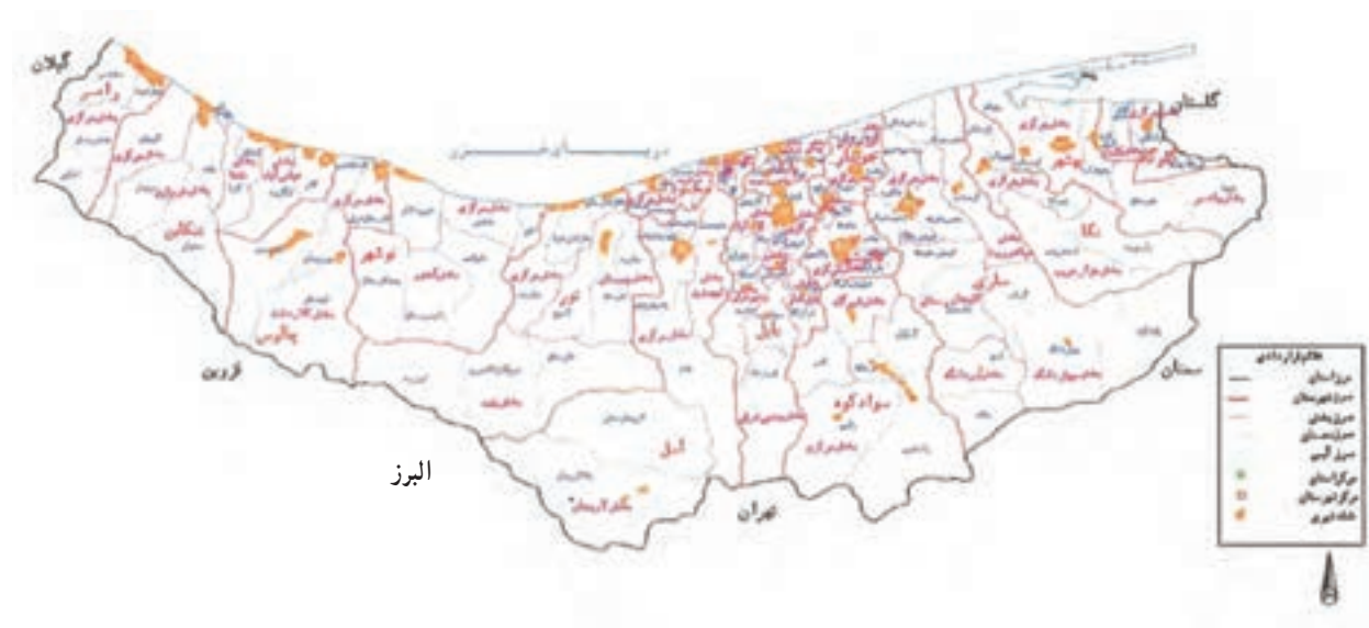
شکل ۱-۲- نقشه تقسیمات سیاسی استان مازندران سال ۱۳۸۷

استان مازندران بر اساس آخرین تقسیمات کشوری دارای ۱۹ شهرستان به نام‌های آمل، بابل، بابلسر، بهشهر، تنکابن، عباس‌آباد، جویبار، چالوس، رامسر، ساری، سوادکوه، قائم‌شهر، گلوگاه، محمودآباد، نکا، نور، نوشهر، فریدونکنار و میاندورود، ۵۲ شهر، ۴۶ بخش و ۱۱۷ دهستان می‌باشد.