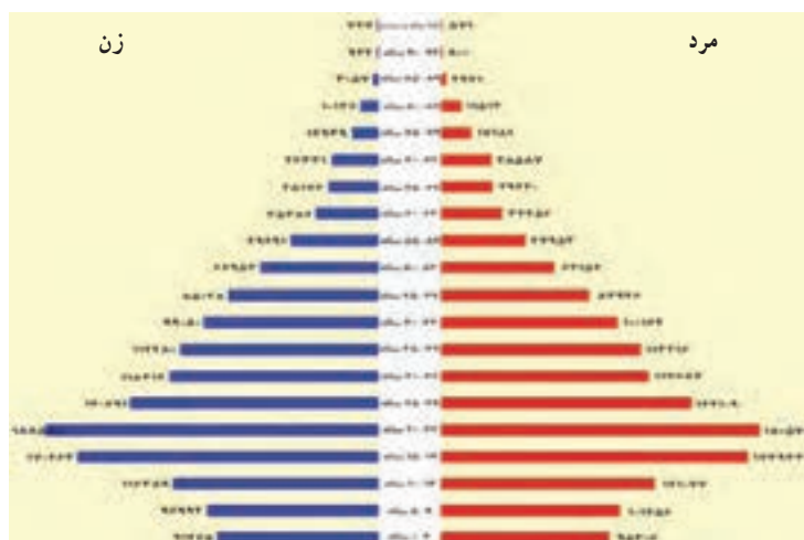
شکل ۲-۸- هرم سنی جمعیت ۱۳۸۵