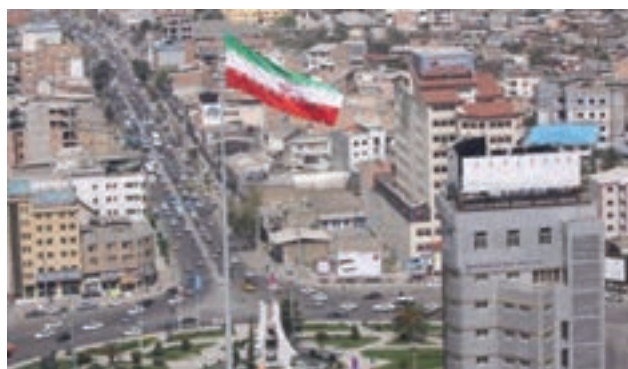
شکل ۹-۲- میدان ساری

به نظر شما اثرات مثبت و منفی مهاجرت به استان مازندران چیست؟