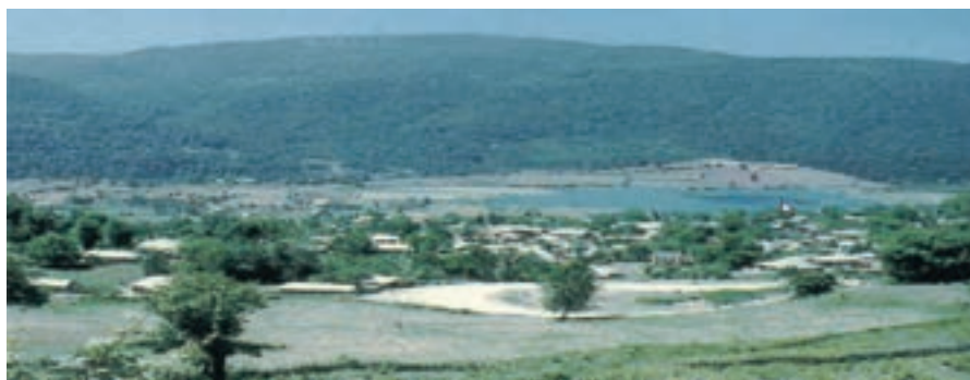
شکل ۲-۲- روستای پراکنده

امروزه دو نوع شیوه زندگی در استان مازندران وجود دارد: زندگی روستایی، زندگی شهری. زندگی روستایی: شکل‌گیری و نوع زندگی روستایی در استان تحت تأثیر عواملی از قبیل: آب و هوا، پوشش گیاهی، خاک، شرایط زیستی و فرهنگی، فعالیت‌های اقتصادی و توانمندی‌های محیط اطراف می‌باشد. مسکن از نظر شکل، از نوع پراکنده است که علت آن وجود آب و هوای مساعد، آب فراوان و خاک مناسب می‌باشد.