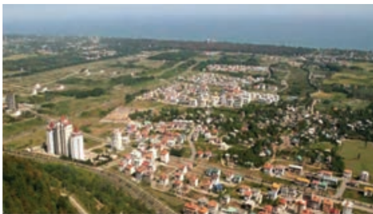
شکل ۵-۲- مسکن شهری