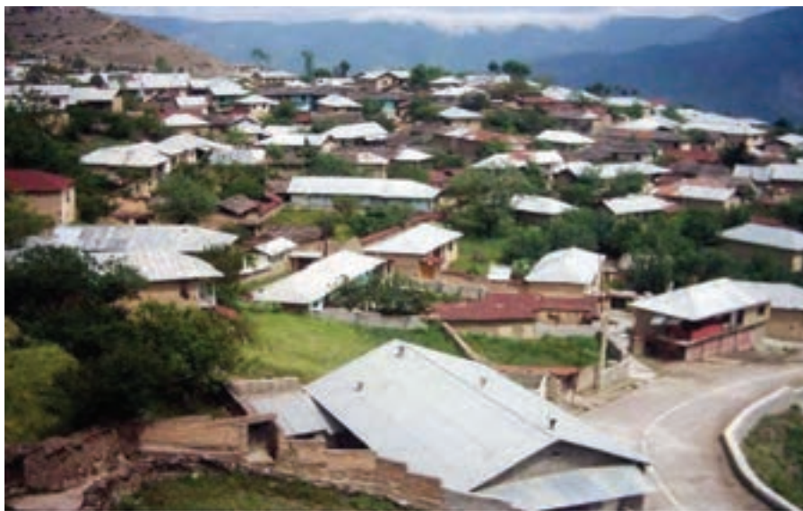
شکل ۳-۲- روستای متمرکز

هر چه از جلگه به سمت دامنه کوه‌ها پیش رویم به دلیل تغییر شیب زمین، تراکم مسکن روستایی افزایش یافته و شکل روستاها نیز از پراکنده به متمرکز تغییر می‌یابد.