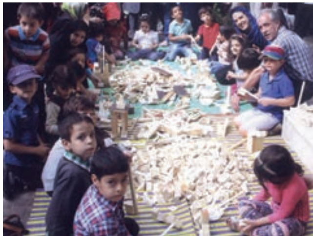
شکل ۱۷- فعالیت مشارکتی

۶ ت: تعادل در تقسیم کار: با تقسیم کار بین کودکان برای انجام فعالیت مشارکتی، شرح وظایف کودکان مشخص‌تر و تخصصی‌تر می‌شود، تداخل کاری به وجود نمی‌آید و توازن کار بین کودکان ایجاد می‌شود (شکل ۱۷).