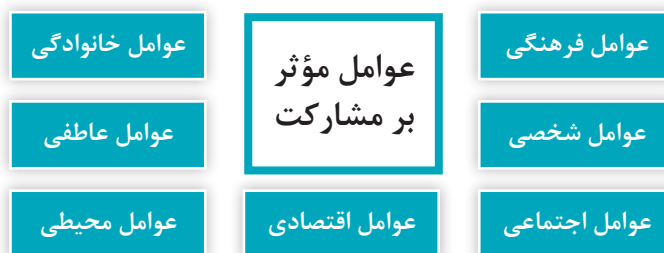
نمودار ۳- عوامل مؤثر بر مشارکت

یکی از عوامل فرهنگی روبه گسترش در اکثر جوامع، استفاده از ابزارهای مختلف فناوری ارتباطات و اطلاعات و ارتباط در دنیای مجازی است که بر میزان مشارکت مربی با کودک تأثیر می‌گذارد.