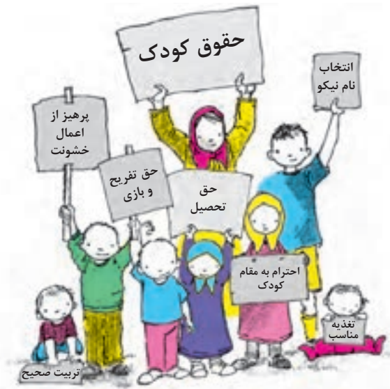
شکل ۲۰- حقوق کودکان در اسلام

اینکه این حمایت‌ها از حقوق کودکان، زمانی مطرح شده که هیچ نهاد، سازمان یا کنوانسیون بین‌المللی برای دفاع از حقوق کودکان وجود نداشته است. اسلام با در نظر گرفتن همه نیازهای اولیه جسمی، روحی و روانی کودکان و دفاع از آن، زمینه را برای رشد و پیشرفت آنان در همه جنبه‌ها فراهم آورده است (شکل ۲۰) از جمله این حقوق می‌توان به موارد زیر اشاره کرد: