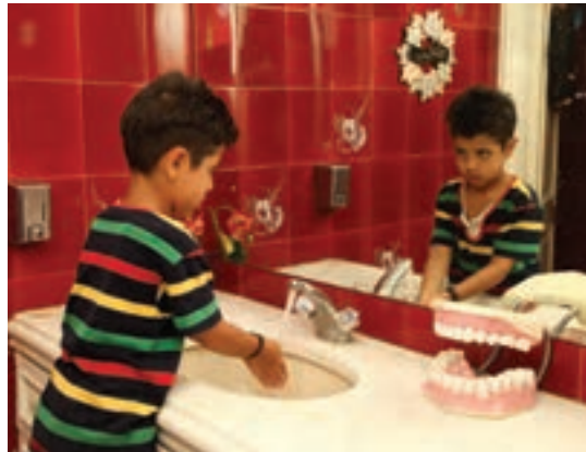
شکل ۳- مهارت‌های اجتماعی