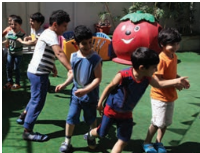
شکل ۱۰- بازی کودکان با یکدیگر