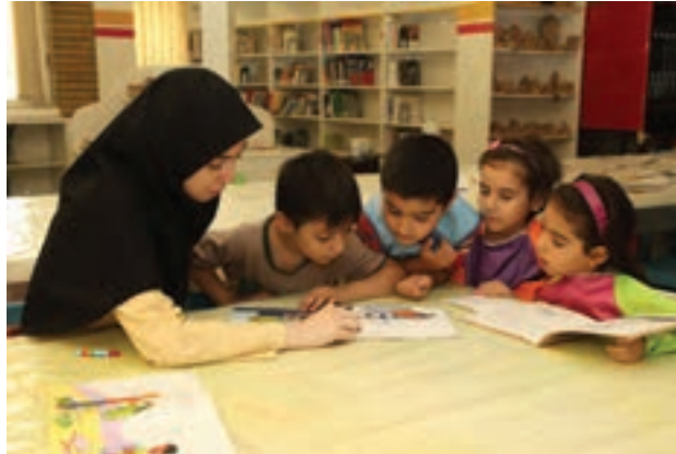
شکل ۱- ارتباط مربی با کودک

فعالیت ۱: در گروه‌های کلاسی با توجه به تصاویر بالا در مورد نقش ارتباط مربی با کودکان گفت‌وگو کنید و نتیجه را در کلاس ارائه دهید.