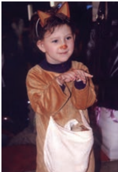
شکل ۹- شعرخوانی کودک