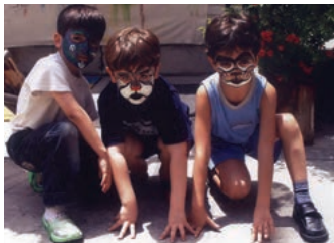
شکل ۸- نمایش کودکان

■ با استفاده از عروسک‌های مختلف ۲ به ایفای نقش شخصیت‌های قصه، توسط آنها پردازید (شکل ۸).