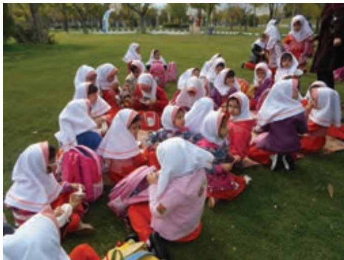
شکل ۱۳- گردش علمی کودکان