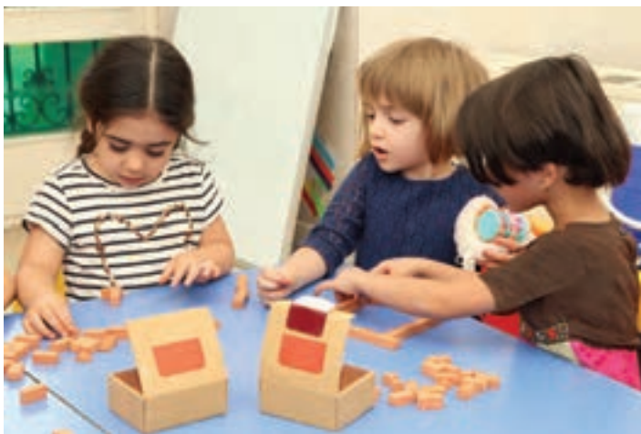
شکل ۱۴- مشارکت کودکان