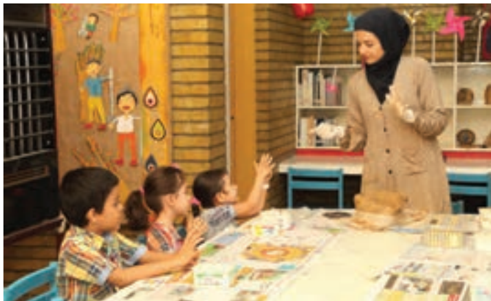
شکل ۱۹- فعالیت مشارکتی مربی با کودکان

۶ برنامه‌ریزی برای کودکان در انجام امور مرکز یا کلاس: دادن فرصت به کودکان در انجام امور مختلف کلاس می‌تواند باعث برانگیختن آنها برای مشارکت در فعالیتهای آموزشی شود برای مثال برنامه‌ریزی برای برگزاری نمایشگاه‌ها، جشن‌ها و امثال آن (شکل ۱۹).