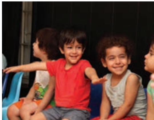
شکل ۱۵- بازی مشارکتی کودکان

فعالیت ۲۵: در گروه‌های کلاسی، هر کدام یک نمونه از فعالیت مشارکتی را که در گذشته تجربه کرده‌اید بیان کنید و دلایل رضایت و یا نارضایتی خود را از این فعالیت مشارکتی، در کلاس ارائه دهید.