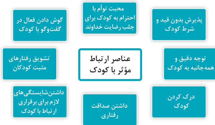
نمودار ۱- عناصر ارتباط مؤثر با کودک