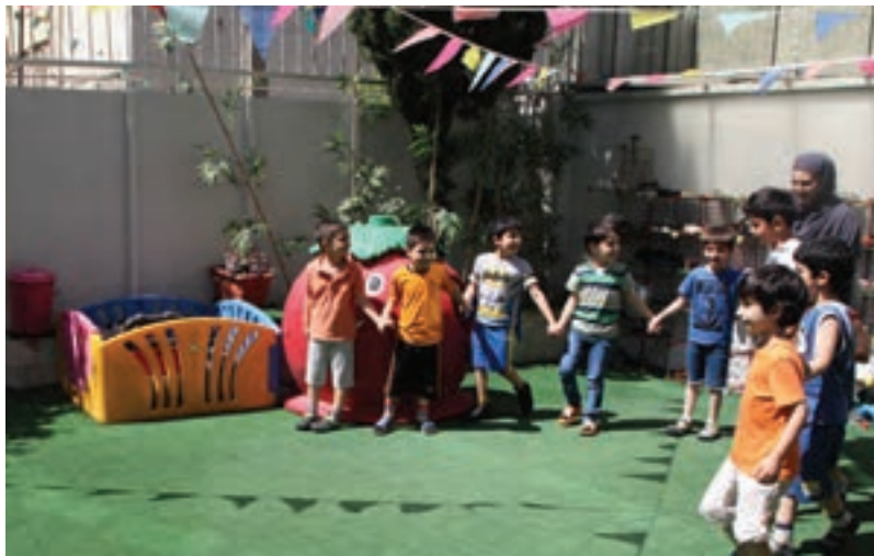
شکل ۶- مهارت‌های بین فردی کودکان