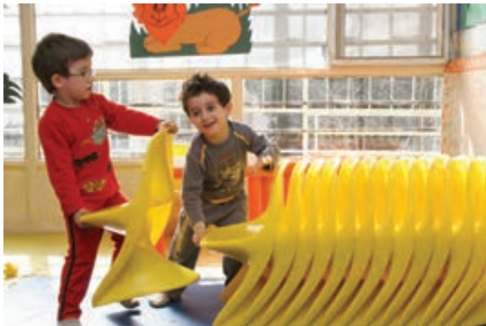
شکل ۴- پیامدهای مهارت‌های اجتماعی

افرادی که مهارت‌های اجتماعی ضعیفی دارند، در معرض روبه‌رو شدن با پیامدهای منفی شامل طرد شدن توسط همسالان، ظهور اختلال‌های روان‌شناختی، گوشه‌گیری و عملکرد تحصیلی پایین هستند.