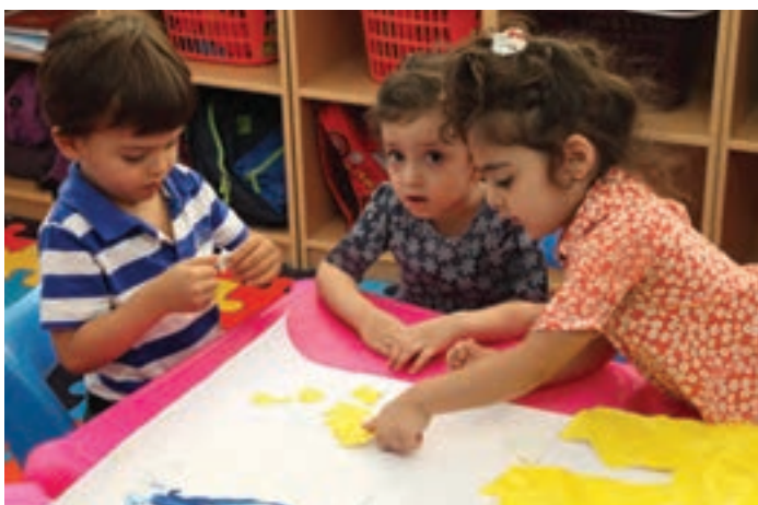
شکل ۱۱- درست کردن کاردستی

فعالیت ۲۰: در گروه‌های کلاسی با استفاده از وسایل دورریختنی عروسک درست کنید.