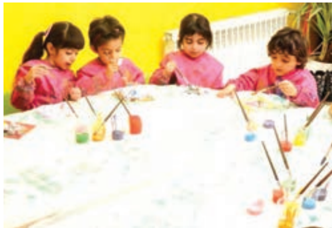
شکل ۱۸- مشارکت در انجام یک فعالیت گروهی

فعالیت ۳۲: به نظر شما برای موفقیت در والیبال هنرستان هر کدام از بازیکنان برای مشارکت گروهی مطلوب چه اصولی را باید رعایت کنند؟ با دوستان خود در این مورد گفت‌وگو کنید و نتیجه را در کلاس ارائه دهید.