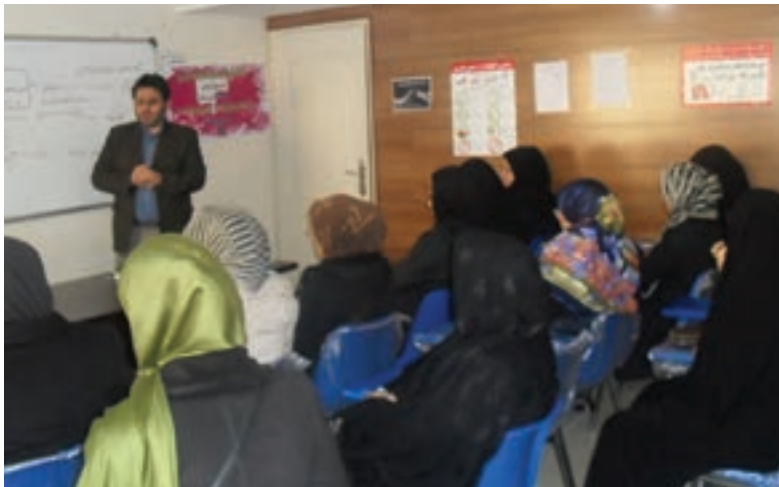
شکل ۲۱- برگزاری کارگاه آموزشی والدین

۴ کارگاه‌های آموزشی برای والدین، مربیان، و کلیه دست‌اندرکاران مرکز آموزشی توسط اساتید برگزار گردد (شکل ۲۱).