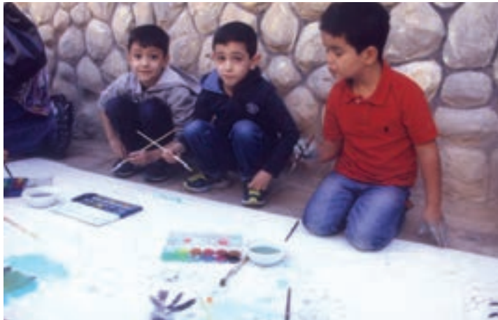
شکل ۱۲- نقاشی گروهی کودکان

۸ گردش علمی: این روش برای مهارت‌های مربوط به شناخت محیط مؤثر است. در این روش علاوه بر شناخت محیط، با افراد گوناگون آشنا می‌شود و راه‌هایی برای برقراری ارتباط مناسب با دیگران می‌آموزد. در این زمینه می‌توانید گردش‌های علمی زیر را برای کودکان تدارک ببینید (شکل ۱۳):