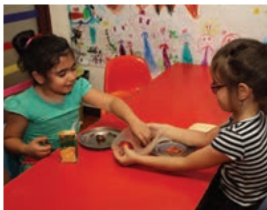
شکل ۲- مهارت‌های اجتماعی کودک

فعالیت ۶: در گروه‌های کلاسی در مورد پیام‌های شکل ۲ و عوامل مؤثر در ارتباط کودک با کودک گفت‌وگو کنید و نتیجه را در کلاس ارائه دهید.