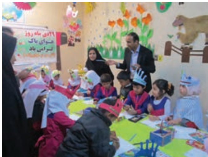
شکل ۱۶- مشارکت مربی با کودکان

بسیاری از کارشناسان و اندیشمندان و متفکران کشورمان به این نتیجه رسیده‌اند که حل بسیاری از معضلات جامعه جهانی با مشارکت سازمان‌ها و جوامع امکان‌پذیر است.