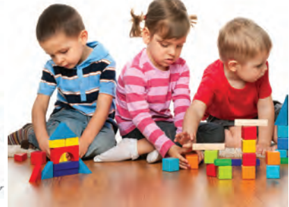
شکل ۱۰- فعالیت‌های کودکان در اوقات فراغت

فعالیت ۱۳: در گروه‌های کلاسی با توجه به تصاویر صفحه قبل در مورد تفاوت استراحت و اوقات فراغت کودکان در مراکز پیش از دبستان گفت‌وگو کنید و نتیجه را در کلاس ارائه دهید.