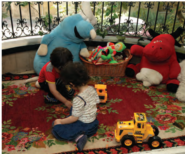
شکل ۳- مکان استراحت کودکان