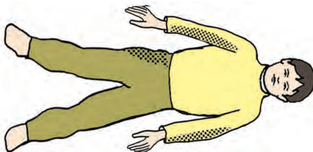
شکل ۷- وضعیت پایه

این تمرین بسیار ساده به عنوان پایه تمرینات تصویرسازی ذهنی و همچنین حرکت - آگاهی است. تن آرامی با آزادسازی تنش‌ها و چرخش آگاهی به پیام‌های (محرک‌ها) درونی، فرد را کاملاً برای خلاقیت آماده می‌نماید. وضعیت پایه: خوابیده به پشت در حالی که پاها کمی بیش از عرض شانه از هم باز هستند و دست‌ها کمی با فاصله از بدن و کف دست‌ها رو به بالا قرار می‌گیرند (شکل ۷).