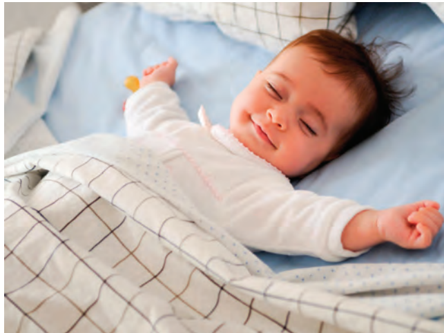
شکل ۱- محل خواب کودک

فعالیت ۱: در گروه‌های کلاسی، در مورد اهمیت ایمنی و بهداشت مکان خواب گفت‌وگو کنید و نتیجه را در کلاس ارائه دهید.