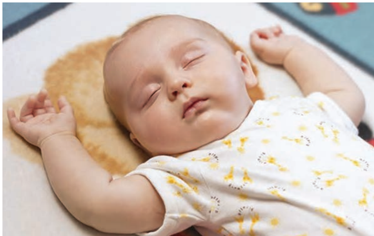
شکل ۱- خواب کودک