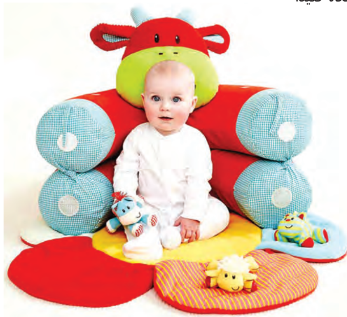
شکل ۶- کودک در حال استراحت

فعالیت ۱۰: در گروه‌های کلاسی با توجه به تصویر بالا، در مورد فعالیت‌های مناسب برای استراحت کودکان در مراکز پیش از دبستان گفت‌وگو کنید و نتیجه را در کلاس ارائه دهید.