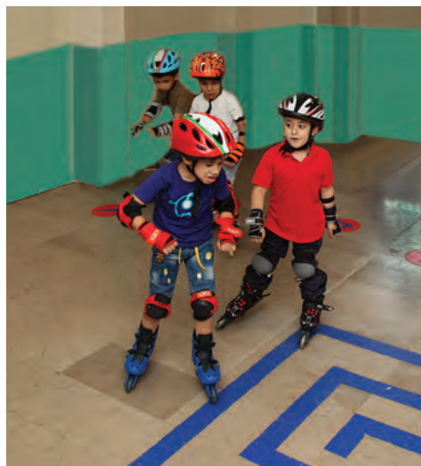
شکل ۱۲- فعالیت ورزشی

فعالیت‌های علمی: جست‌وجوگری، تجربه کردن، بودن در طبیعت و مشاهده پدیده‌های آن، کشف دنیای پیرامون خود به صورت آزاد و خلاق فعالیت‌های ورزشی ۱ : بازی‌های گروهی و انفرادی، دویدن، پریدن، توپ بازی و نظیر آنها (شکل ۱۲)