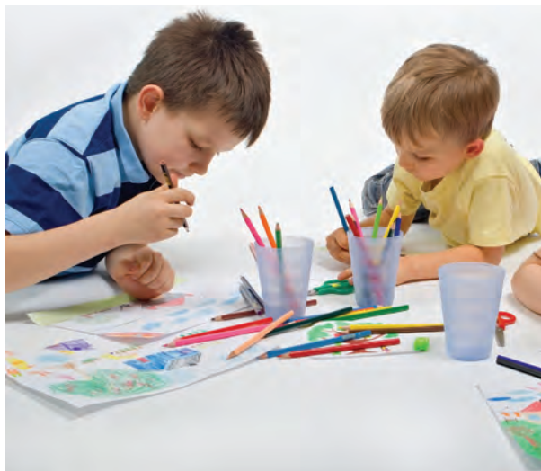
شکل ۱۱- فعالیت هنری

مهم‌ترین روش‌های مناسب برای استفاده کودکان از اوقات فراغت عبارت‌اند از: فعالیت‌های کتابخوانی ۱ : کتاب و قصه‌خوانی، تصویرخوانی و امثال آنها. فعالیت‌های هنری ۲ : نقاشی، کاردستی، موسیقی، نمایش و غیره (شکل ۱۱)