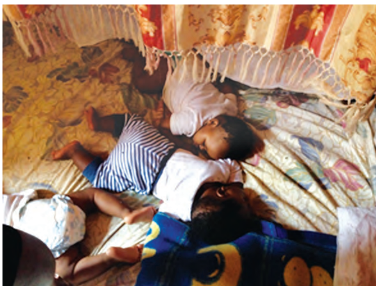
شکل ۱- شرایط نایمن برای خواب کودکان

فعالیت ۳: در گروه‌های کلاسی با توجه به تصویر بالا، در مورد بهداشت و ایمنی مکان خواب بر روی سلامت کودکان گفت‌وگو کنید و نتیجه را در کلاس ارائه دهید.