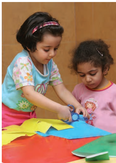
شکل ۵- مهارت‌های خودیاری کودکان