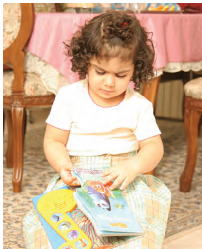
شکل ۳- فعالیت‌های فردی و گروهی کودکان