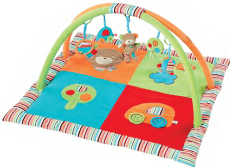
شکل ۴- وسیله‌ای برای بازی و استراحت کودکان خردسال