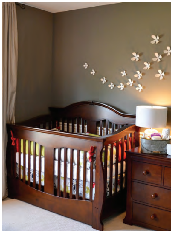
شکل ۳ - تخت کودک

خواباندن طاق‌باز نوزادان از مرگ ناگهانی نوزادان پیشگیری می‌کند. توجه شود که نسخه دستور پزشک درخصوص خواباندن نوزاد در پرونده مدارک نوزاد نگهداری شود.