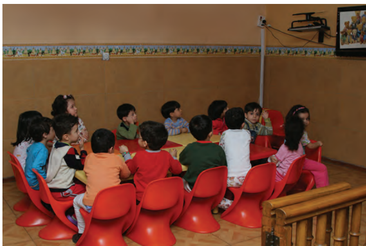
شکل ۲- کودکان در حال استراحت

تعریف استراحت: ایجاد موقعیتی که در آن کودکان احساس آرامش، آزادی، راحتی و رفع خستگی کنند. کودکان در مراکز پیش از دبستان نیاز به زمان‌هایی دارند که براساس علاقه و انتخاب خود از آن استفاده کنند. استراحت کافی به شاداب بودن و فراگیری بیشتر کودکان کمک می‌کند (شکل ۲).