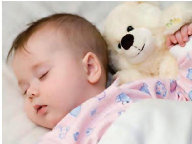
شکل ۲- خواب کودک در مهدکودک