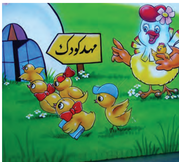
شکل ۴- درب ورودی مرکز پیش از دبستان