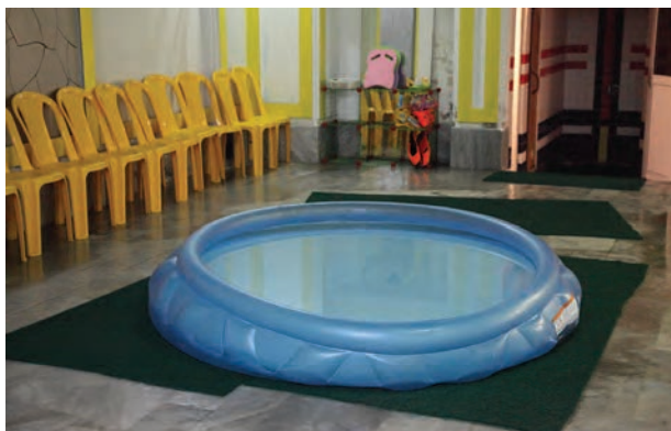
شکل ۲- استخر شنای کودکان خردسال