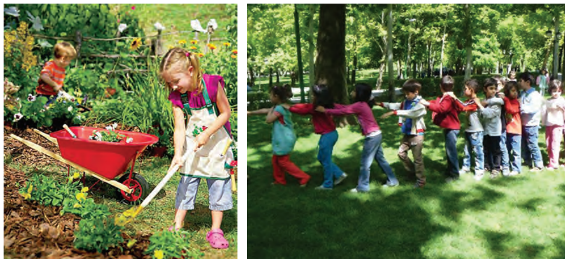
شکل ۱- بازی کودکان در فضای سبز

تحقیقات جدید دانشمندان نشان می‌دهد تماس با فضای سبز شهری به کودکان کمک می‌کند که رشد ذهنی خود را شکوفا کنند و اینکه بخشی از این تأثیر به دلیل اثر فضای سبز در کاهش آلودگی شهری است.