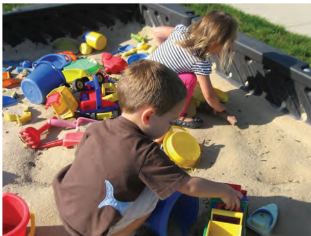
شکل ۱- شن بازی کودکان

فعالیت ۱: در گروه‌های کلاسی، با توجه به شکل ۱ در مورد بهداشت فضای شن بازی و آب بازی کودکان گفت‌وگو کنید و نتیجه را در کلاس ارائه دهید.