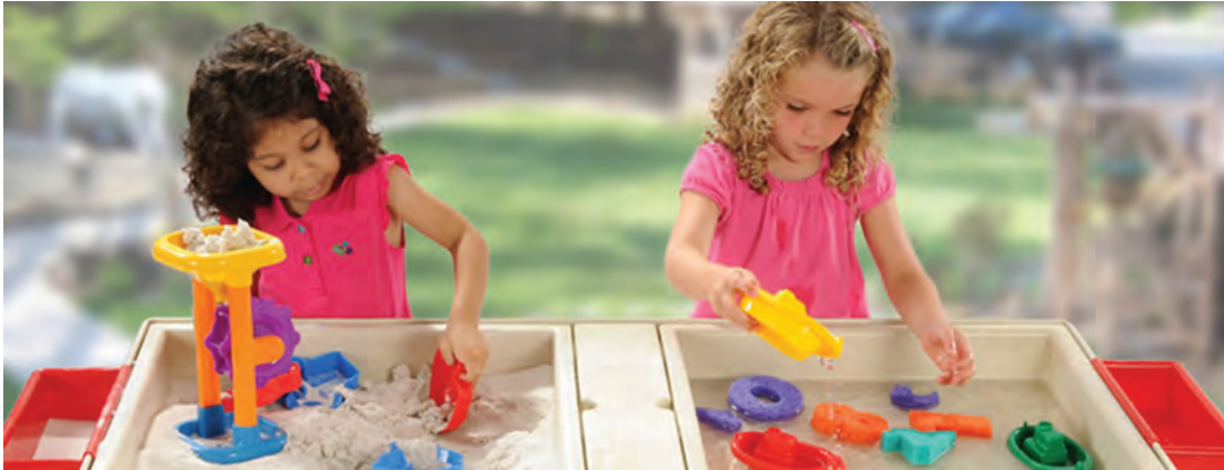
شکل ۷- فضای بهداشتی برای شن‌بازی و آب‌بازی کودکان

فعالیت ۶: در گروه‌های کلاسی، با توجه به تصویر بالا، در مورد روش‌های نگهداری فضای شن‌بازی و آب‌بازی گفت‌وگو کنید و نتیجه را در کلاس ارائه دهید.