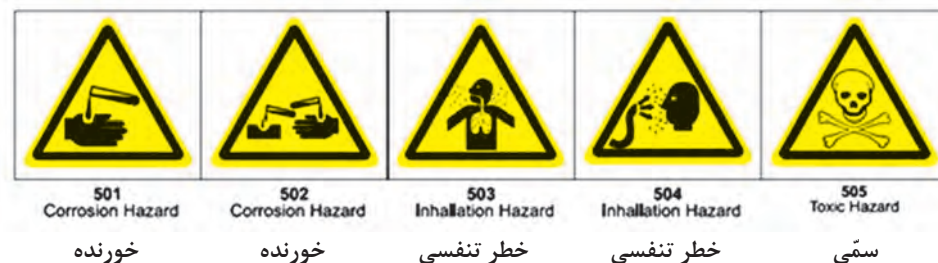
شکل ۶- علائم اخطار بر سموم

■ برای جلوگیری از آلودگی افراد و نیز محیط زیست باید توجه نمود که ظروف خالی آفت کش ها در محیط باز رها نشوند و به روش بهداشتی دفع شوند.