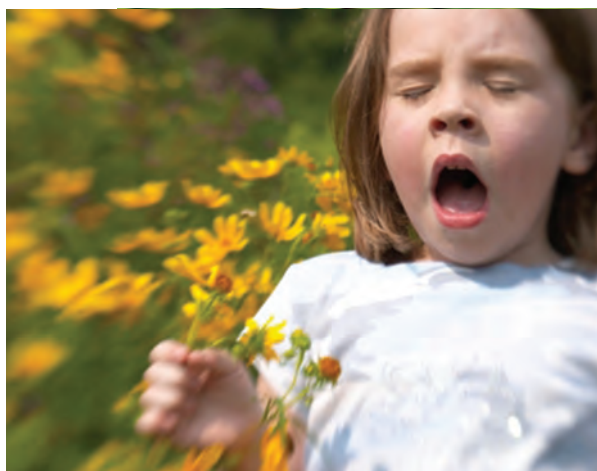
شکل ۴- حساسیت به گیاهان در کودکان