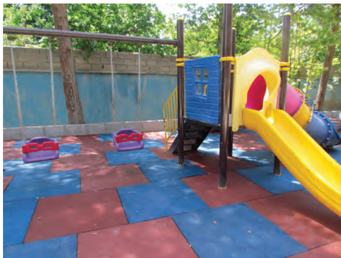
شکل ۱- وسایل بازی فضای باز مراکز پیش از دبستان

فعالیت ۱: در گروه‌های کلاسی، با توجه به تصویر بالا، در مورد اهمیت بازی و انواع وسایل بازی کودکان گفت‌وگو کنید و نتیجه را در کلاس ارائه دهید.