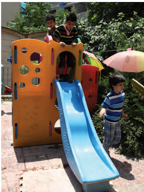
شکل ۶- بازی کودکان در فضای باز مهد کودک