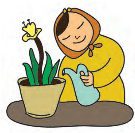
شکل ۵- کودک و نگهداری فضای سبز

برای رعایت بهداشت و نگهداری فضای سبز باید به نکات زیر توجه کرد (شکل ۵):