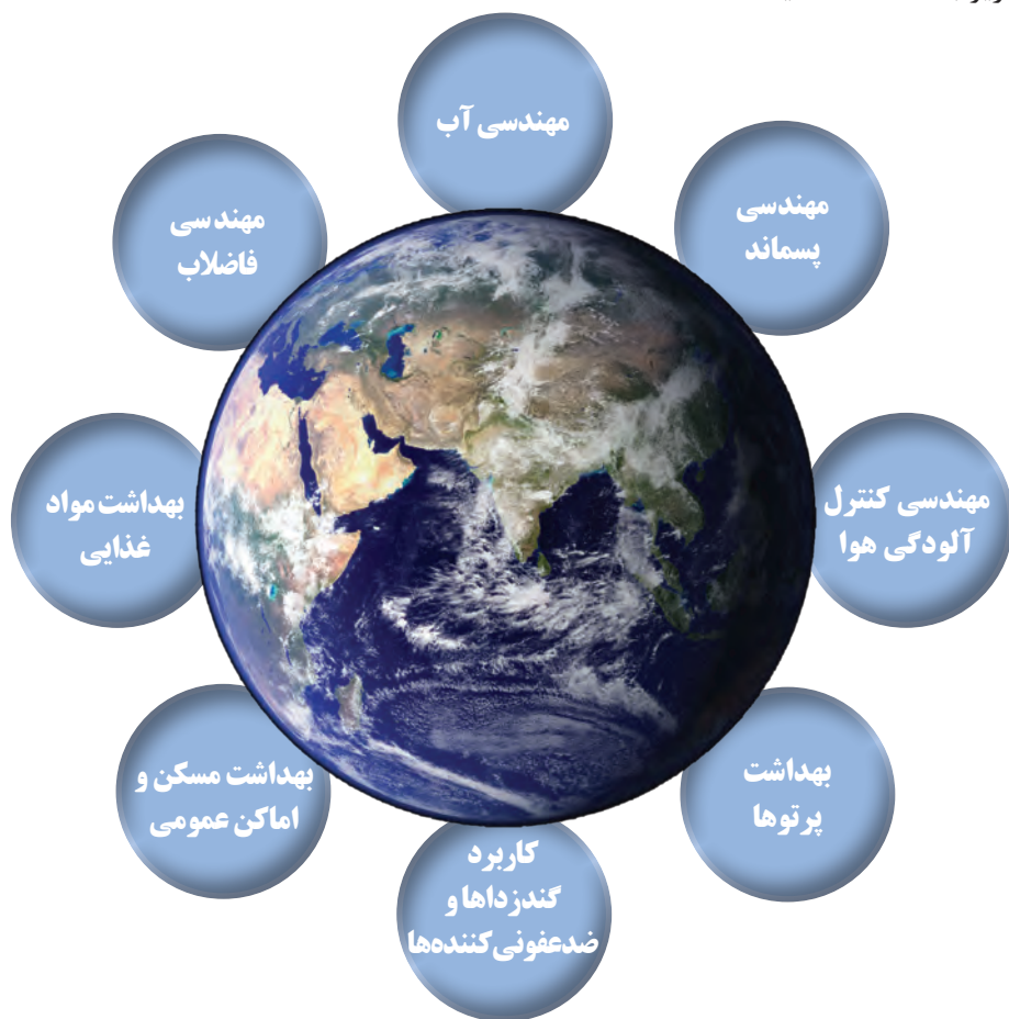
شکل ۱- بهداشت محیط

فعالیت ۱: با توجه به تصویر بالا، در گروه‌های کلاسی در مورد نقش و هدف بهداشت محیط در جامعه گفت‌وگو کنید و نتیجه را در کلاس ارائه دهید.