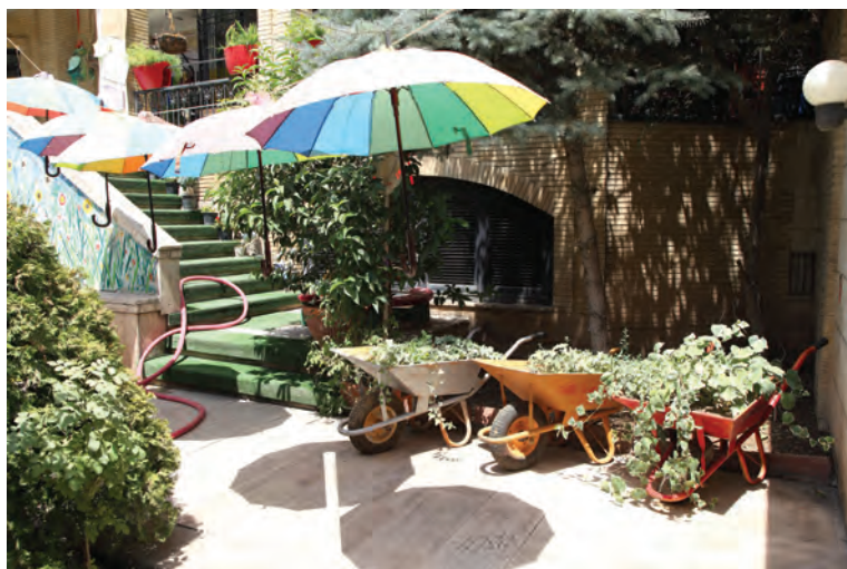
شکل ۲- بهداشت فضای سبز و باغبانی