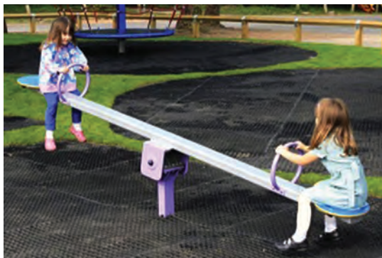
شکل ۴- الاکلنگ

تجهیزات نوسانی یا الاکلنگ: تجهیزاتی هستند که می‌توانند توسط استفاده کننده به حرکت درآیند و عموماً توسط یک جزء که حول یک تکیه‌گاه مرکزی نوسان می‌کند، قرار می‌گیرند (شکل ۴). انواع الاکلنگ شامل نوع محوری، یک نقطه‌ای، چند نقطه‌ای، نوسانی و جارویی است.