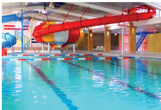
شکل ۱- استخر کودکان

فعالیت ۱: در گروه‌های کلاسی، با توجه به تصویر بالا، در موارد زیر گفت‌وگو کنید و نتیجه را در کلاس ارائه دهید.