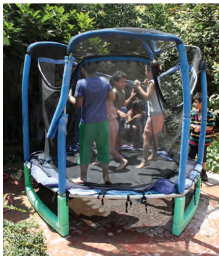
شکل ۵ - فضای ورزشی و فضای سبز

۱-۲- هدف توانمندسازی: بهداشت سطح فضای باز و حیاط را کنترل کند.