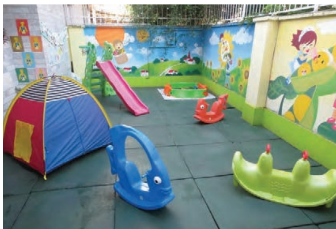
شکل ۳- وسایل بازی در فضای باز مراکز پیش از دبستان