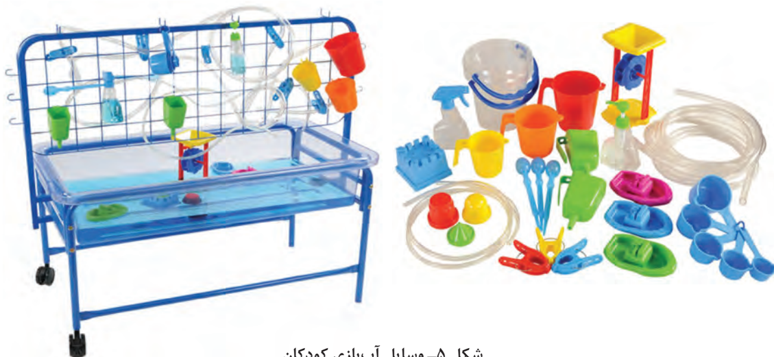
شکل ۵- وسایل آب بازی کودکان