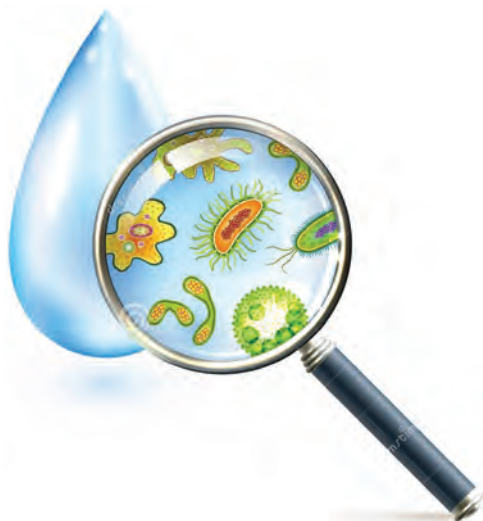
شکل ۴- میکرو ارگانیسم‌های آب استخر

ب) آلودگی‌های شیمیایی: آلودگی شیمیایی آب استخرهای شنا شامل مواد شیمیایی مورد استفاده در تصفیه آب استخر مثل کلر و نیز مواد حاصل از واکنش این مواد، به خصوص گندزداها با مواد آلی و معدنی موجود در آب خام، ایجاد می‌شود. هرچه مواد دفعی آزادشده از شناگران شامل ترشحات بینی، حلقی و پوستی، کرم‌ها، پمادها و غیره در آب بیشتر باشد، احتمال حضور آلاینده‌های شیمیایی بیشتر است.