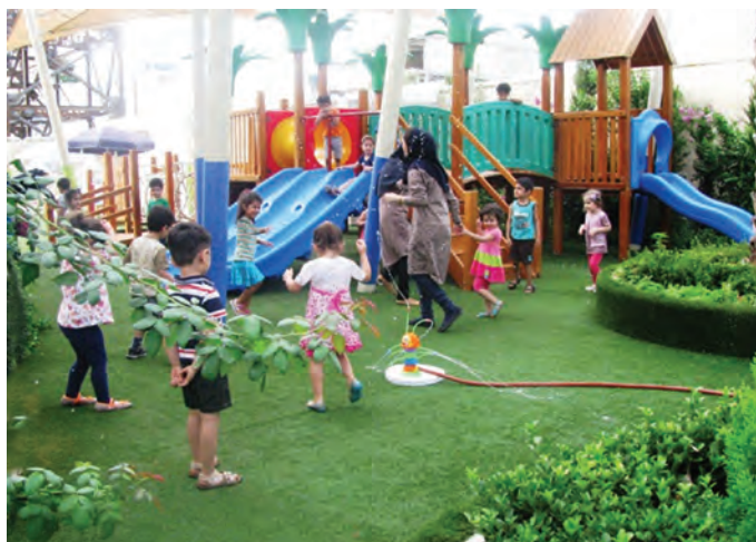
شکل ۲- فضای باز مراکز پیش از دبستان