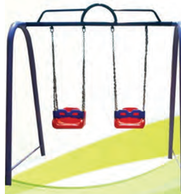
شکل ۳- تاب بازی