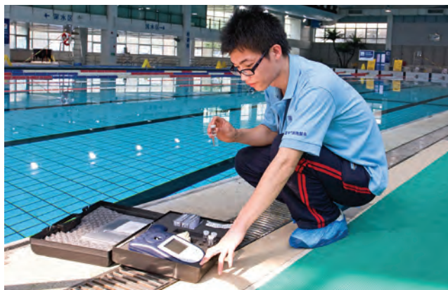
شکل ۶- نمونه برداری از آب استخر

فعالیت ۴: در گروه‌های کلاسی، در مورد انواع روش‌های تصفیه آب استخرها به‌ویژه روش‌های گندزدایی آب از منابع معتبر علمی جست‌وجو کنید و نتیجه را در کلاس به‌صورت بروشور ارائه دهید.