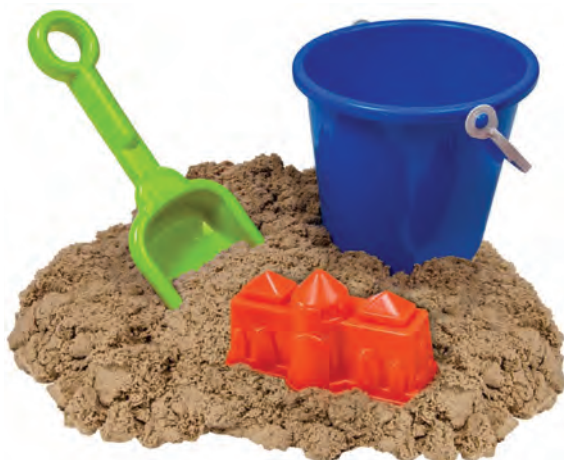
شکل ۴- وسایل شن‌بازی کودکان

فعالیت ۳: در گروه‌های کلاسی، با توجه به تصویر بالا، در مورد ایجاد فضای شن‌بازی و بهداشت آن گفت‌وگو کنید و نتیجه را در کلاس ارائه دهید.