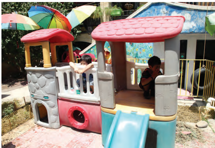
شکل ۶ - بهداشت در فضای باز مرکز آموزشی