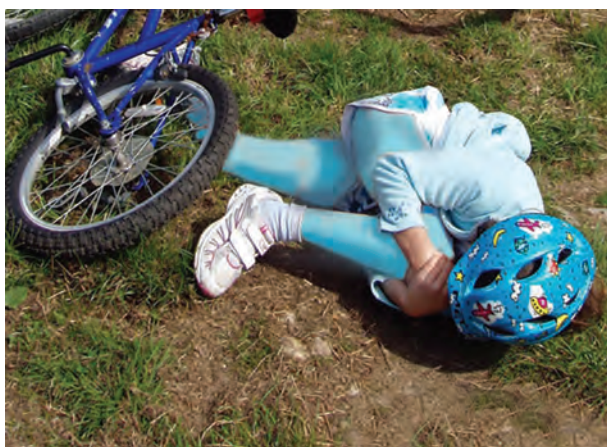
شکل ۳- خطرات فضای سبز

فعالیت ۲: در گروه‌های کلاسی با توجه به تصویر صفحه قبل، در موارد زیر گفت‌وگو کنید و نتیجه را در کلاس ارائه دهید.