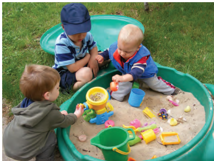
شکل ۶- فضای شن بازی کودکان

فعالیت ۵: در گروه‌های کلاسی، با توجه به تصویر بالا، در مورد آلودگی فضای شن بازی و آب بازی و روش‌های از بین بردن این آلودگی‌ها گفت‌وگو کنید و نتیجه را در کلاس ارائه دهید.