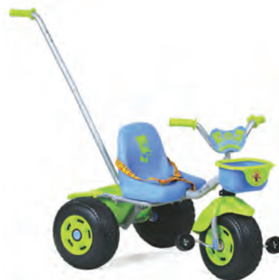
شکل ۵- سه چرخه