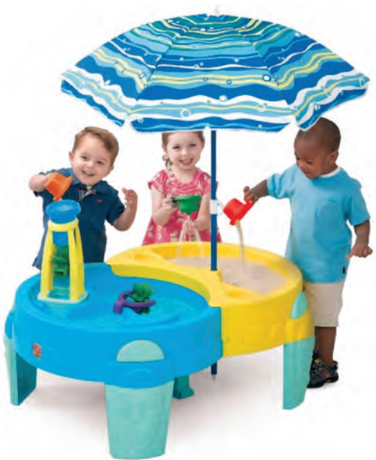
شکل ۳- فضای آب بازی کودکان

تعریف فضای آب بازی: به فضایی شامل تشت بزرگ، استخر کوچک پلاستیکی یا وان، آبپاش، بطری، عروسک و وسایل بازی که برای بازی کودکان با آب طراحی شده است، فضای آب بازی گفته می شود (شکل ۳).