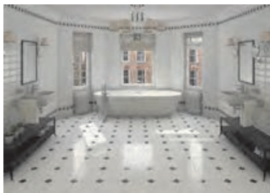
شکل ۲ ▲

کاشی لعابی اغلب برای پوشش دیوارهای اماکن مذهبی، تابلوهای تزئینی، بدنه آشپزخانه، حمام، سرویس‌های بهداشتی، رخت‌شوی‌خانه و سایر آبریزگاه‌ها به مصرف می‌رسد. همچنین نوعی از آن که به نام کاشی کف مشهور است، برای کف‌پوش این فضاها به کار می‌رود. کاشی‌های لعابی معمولاً مربع یا مستطیل هستند. (شکل ۲)