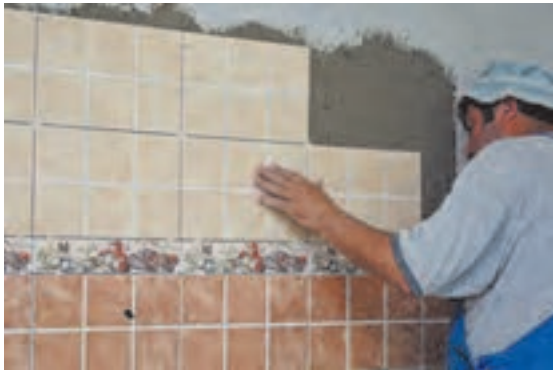
شکل ۴ ▲

در این روش ملات خمیری ماسه و سیمان را در پشت کاشی قرار داده و به دیوار می چسبانند. همان طور که گفته شد از این روش بیشتر برای رچ های آخر که امکان دوغاب ریزی نداشته و نیز زیر سقفها استفاده می شود. لازم به توضیح است که اگر بخواهند از این روش در کارهای نو همانند زیر سقفها استفاده نمایند ابتدا باید سطح زیر کار را با اندود ماسه و سیمان هموار نموده، پس از خشک شدن اندود، به نصب کاشی ها اقدام گردد.