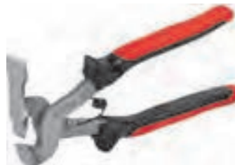
شکل ۳ ▲