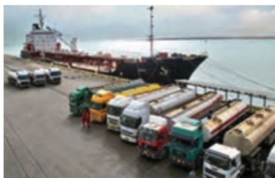
شکل ۱۲- وسایل نقلیه حمل روغن خام

۲ جنس مخزن: معمولاً مخازن حمل روغن خام از جنس آهن بوده اما می‌توان از مخازن فولاد ضدزنگ، پلی‌اتیلن و پلاستیک فشرده هم استفاده نمود در هر صورت باید دقت داشت که جنس مخازن تأثیری بر کیفیت روغن محتوی نگذارد.