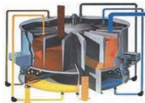
شکل ۹- اکستراکتور تراوشی دوار

در بهترین شرایط عملکرد، حدود ۵٪ درصد روغن در کنجاله نهایی باقی می‌ماند. میسلا که حاوی حلال، روغن، رطوبت و ذرات ریز ماده جامد است ابتدا از صافی عبور کرده و سپس جهت بازیابی حلال به مجموعه از تجهیزات بعدی منتقل می‌شود.