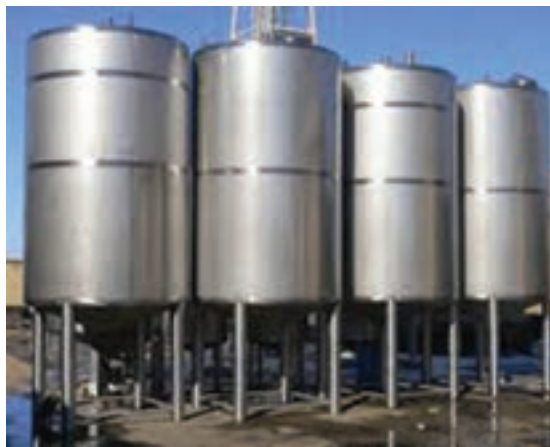
شکل ۱۱- مخازن نگهداری روغن