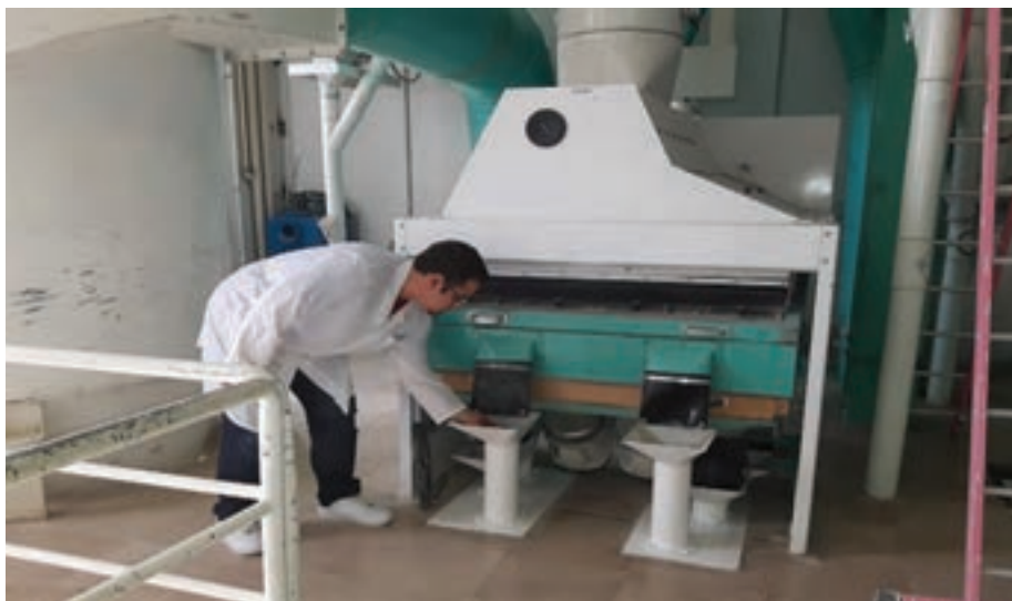
شکل ۶- دستگاه پوست‌گیری