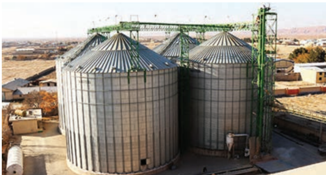
شکل ۵- سیلوی مدرن نگهداری دانه‌های روغنی