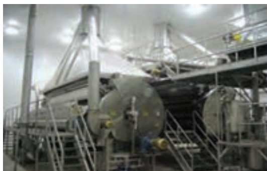
شکل ۷- انواع آسیاب پرک