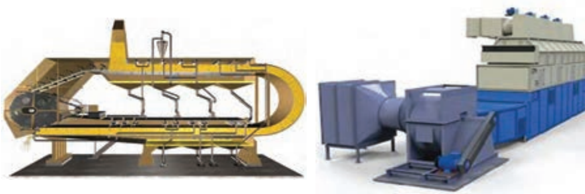
شکل ۸- اکستراکتور سبیدی

۱ اکستراکتورهای سبیدی: این دستگاه از نواری درست شده است که بر روی آن سبدهایی (توری‌هایی) با سوراخ ریز از جنس فولاد ضدزنگ قرار دارد. پرک دانه روغنی در روی توری‌ها ریخته شده و حلال روی آنها پاشیده می‌شود. (شکل ۸)