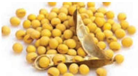
شکل ۲- دانه سویا

همچنین مواد اولیه دیگری نظیر سبوس برنج (rice bran) که دارای ۱۵ تا ۱۷ درصد روغن است با این روش قابلیت استخراج پیدا می‌کند. در روش استخراج با حلال به علت پایین بودن دما در طول فرایند، پروتئین و دیگر خواص شیمیایی مواد تغییر نمی‌کند، بنابراین از باقی‌مانده دانه پس از روغن‌کشتی (کنجاله) نیز استفاده مناسب به عمل می‌آید. به‌طور مثال می‌توان از آن به‌عنوان خوراک دام و طیور استفاده کرد.