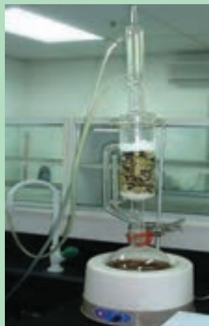
شکل ۱۰- دستگاه سوکسله