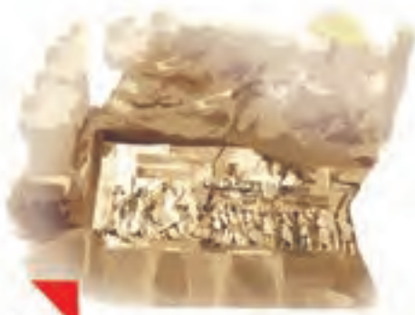
این، تصویری از بیستونِ کرمانشاه است.