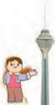
اینجا، برج میلاد تهران است.