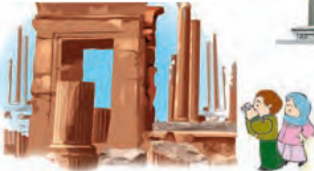
اینجا، تخت جمشید در مَرودشت فارس است.