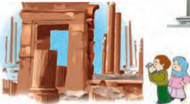
اینجا، تخت جمشید در مَرودشت فارس است.