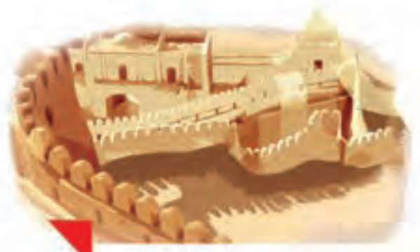
اینجا، آرگِ بَم کرمان است.