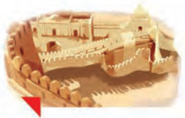
اینجا، آرگِ بَمِ کرمان است.