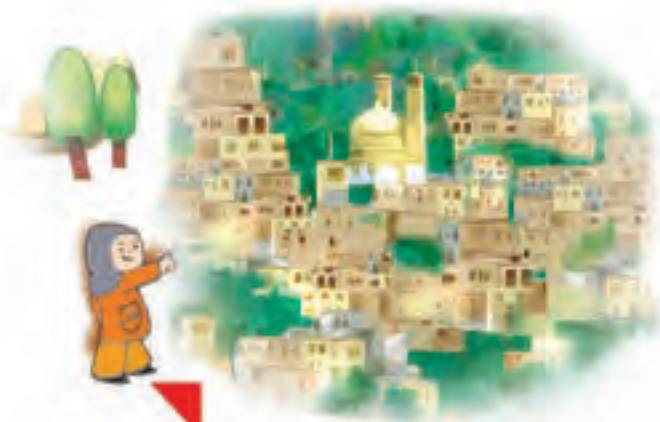
اینجا، ماسوله‌ی گیلان است.