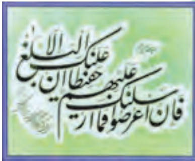
سوره شوری آیه ۴۸

پس از پیروزی انقلاب اسلامی، به دلیل درخواست‌های مکرر قرآن دوستان و قرآن پژوهان، رسانه‌های متنوع قرآنی در کشور ایجاد شده و رشد خوبی داشته است. برای آشنایی و استفاده شما دانش‌آموزان عزیز برخی از این رسانه‌ها معرفی می‌شود.