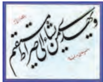
سوره یونس آیه ۲۵